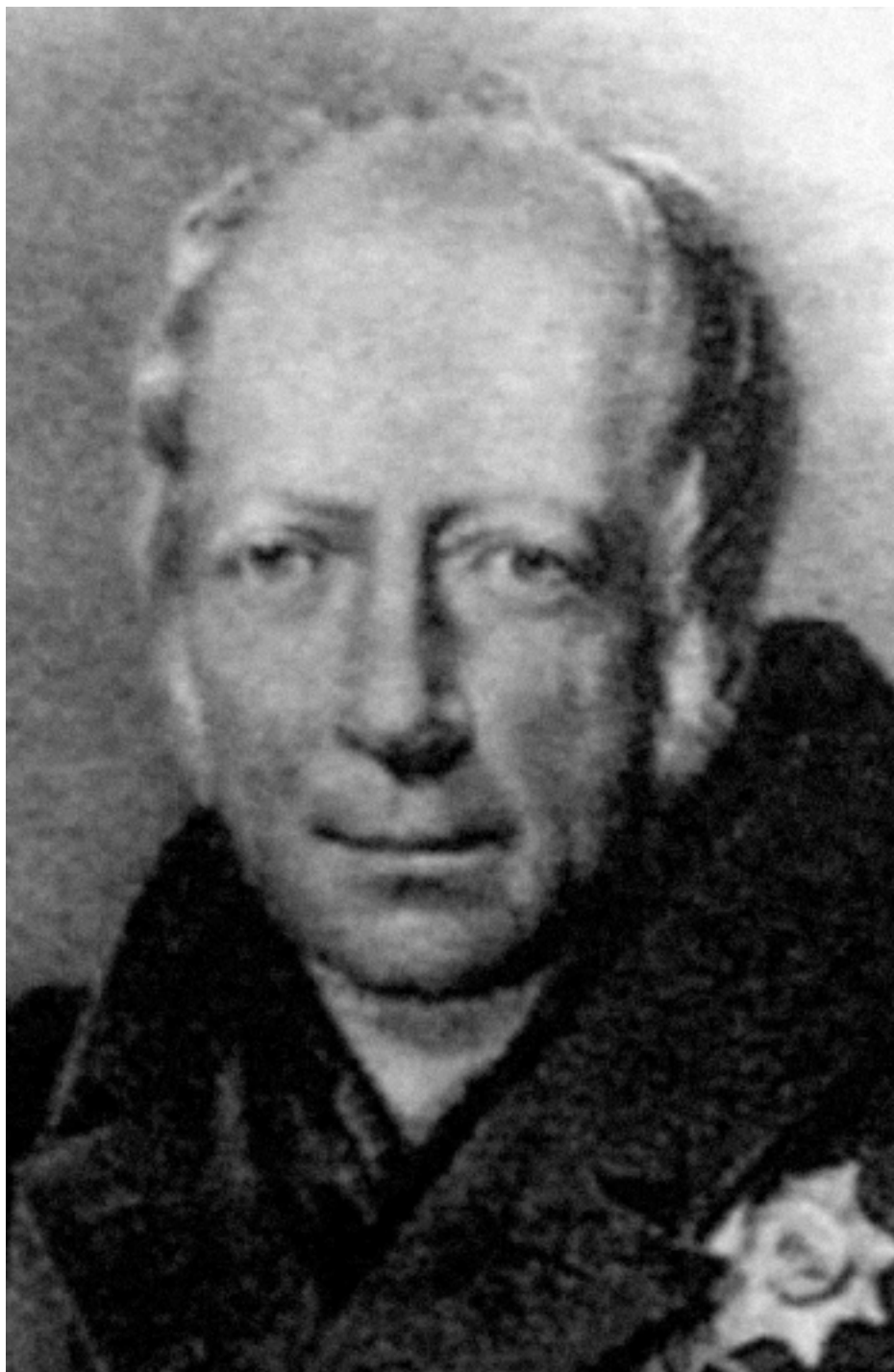
В. фон Гумбольдт

Тем не менее большинство исследователей, излагая взгляды Гумбольдта, выделяют в них ряд основных моментов.