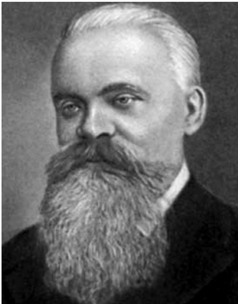
Ф. Ф. Фортунатов

является грамматическое предложение, хотя психологический и грамматический анализ могут и не совпадать. В целом разделял московский языковед и младограмматическую концепцию «звуковых законов».