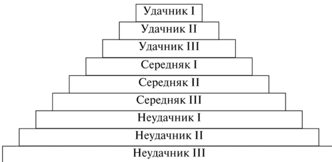
Рис. 2. Уровни благополучия