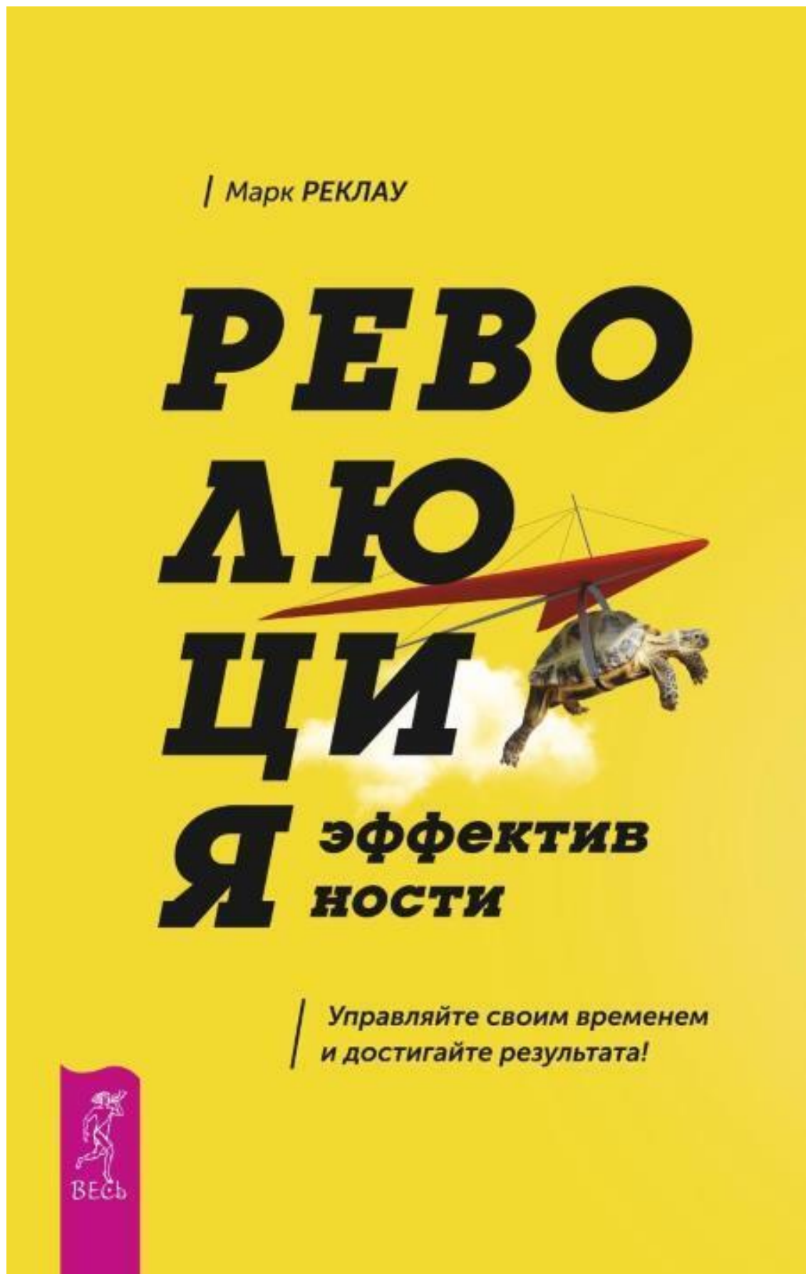
Marc Reklau THE PRODUCTIVITY REVOLUTION