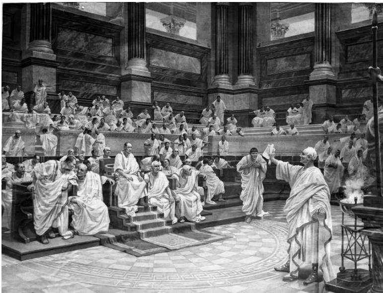
Суд сената (Ганс Вернер Шмидт, 1912)

Костомаров Н. И. Кремуций Корд. Трагедия в 3-х действиях.