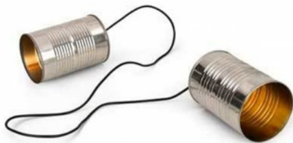
Рис.1 Верёвочный телефон

Сами карты, если они обычные, практически никак не влияют на успех гадания, так как ответ приходит не от карт – они лишь инструмент для дешифровки данных. Исключением могут являться карты, созданные и заряженные магом. Такие карты будут, безусловно, более «разговорчивыми» с их владельцем, хотя сама информация будет приходить из того же единого источника, только более чёткая и точная.