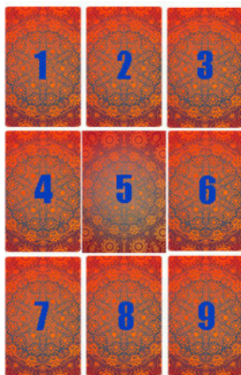
Рис. 9 Расклад «Девятка» без сигнификатора

При использовании расклада без выкладки сигнификатора (рис.9), порядок выкладывания карт немного меняется. Здесь выкладываются все девять карт, каждая из которых является рабочей. Карта, выпавшая в центр будет играть основную роль, она будет показывать то, что является главным в данной ситуации, вокруг чего и будет интерпретироваться весь основной расклад. Окружающие карты можно комбинировать в пары как между собой, так и с картой, лежащей в центре. Вы познакомитесь с обоими вариантами когда мы будем рассматривать примеры.