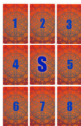
Рис. 8 Расклад «Девятка» с сигнификатором

Расклад «Девятка» выкладывается по простой схеме слева направо и сверху вниз. Если вы решили использовать карту-сигнификатор, то после её выкладки в центр расклада, остальные карты располагаются вокруг него (рис.8). В результате расклад будет иметь восемь рабочих карт, между которыми можно составлять комбинации. С картой-сигнификатором комбинации не составляются. Обратите внимание, что в раскладе без сигнификатора у нас девять рабочих карт, а с сигнификатором уже только восемь. Это отражается и на номерах позиций расклада.