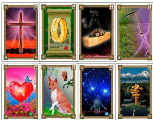
Рис.7 Эти сигнификаторы лучше выбирать из другой колоды

В раскладах на некоторые важные темы, в колоде обязательно должны находиться определённые карты, без которых сложно увидеть ключевую информацию и сделать точный окончательный вывод. В зависимости от темы вопроса такими картами могут быть показанные рис.7: