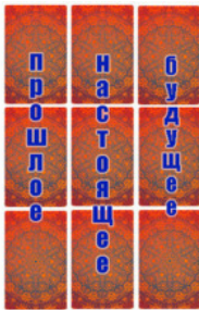
Рис. 10 Общие указатели времени