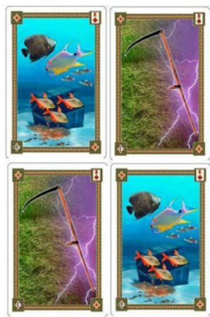
Рис.3 Выдадут ли зарплату?

Предположим, что на вопрос про зарплату вам ответили комбинацией Рыбы+Коса (рис.3).