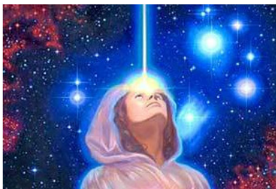
Рис.4 Связь через канал ясновидения

Через пять-десять секунд после того, как ваша «посылка» отправлена, начинайте тасовать карты, не думая больше о вопросе. Очень важно в этот момент не думать о том, какие карты могут выпасть, или, наоборот, не выпасть!