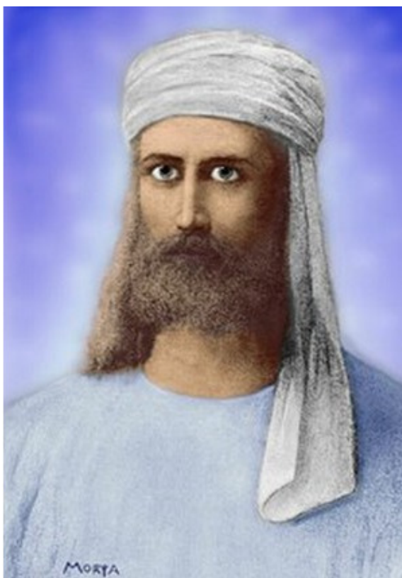
Рис. 2. Эль Мория

Позднее она пишет, как ей давались знания: «Знание приходит в видениях, сначала в снах, а затем в картинах, которые предстоят перед внутренним взором в ходе медитаций. Таким образом мне была преподана вся система эволюции, законы бытия и все остальное, что я знаю, – тайны жизни и смерти, деяния кармы. Ни слова обо всем этом не было сказано мне обычным путем, кроме, быть может, подтверждения того, что было таким образом дано мне, – меня ничему не учили на письме. И знание, обретенное так, столь ясно, столь убедительно, столь неизгладимо по тем впечатлениям, которые оно оказало на разум, что все другие источники информации, все другие методы обучения, с которыми мы знакомы, кажутся совершенно незначительными по сравнению с ним. Одна из причин, по которой я колеблюсь при немедленном ответе на некоторые вопросы, задаваемые мне, – это трудность выражения достаточно правильным языком того, что дается мне в виде картин и постигается мной при помощи чистого Разума, как назвал бы это Кант. Их метод – это синтетический метод обучения: сперва даются самые общие очертания, затем некое интуитивное видение метода работы, после того перед взором появляются главные принципы и понятия, и в конце концов начинается раскрытие небольших деталей». 7