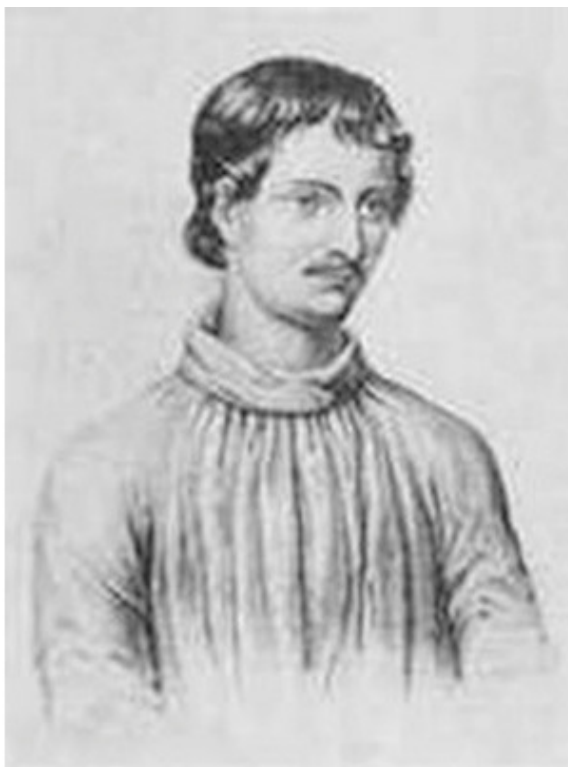
Рис. 6. Джордано Бруно

Чем же Бруно, монах и странствующий философ, навлек на себя самое суровое наказание церкви? Он был сожжен за свои еретические воззрения, в числе которых была и мысль о том, что после смерти человеческая душа может вернуться на Землю в новом теле и даже может идти дальше, чтобы жить в бесконечном многообразии миров за пределами Земли.