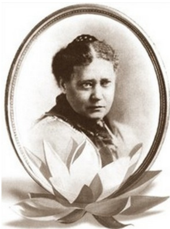
Рис. 1. Блаватская Елена Петровна

Никакие тайны не откроются человеку, если ум его не будет успокоен, пока его воля не станет твердой, а душа чистой, как родниковая вода; и только когда ищущий наберется храбрости сделать шаг в дверь, находящуюся в конце души, к своему Духу и сделает его, чтобы установить постоянный контакт со своим Высшим Я – настоящим источником жизни и знания.