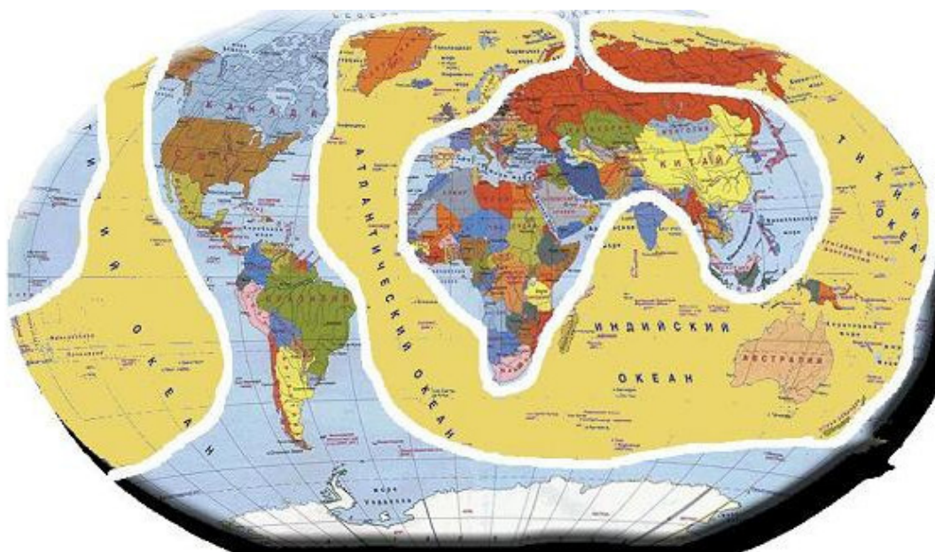
Рис. 3. Материк лемурийской расы

Этот материк третьей коренной расы назывался Лемурией и был похож на огромный подковообразный континент.