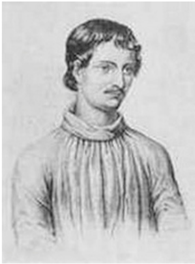
Рис. 6. Джордано Бруно

Чем же Бруно, монах и странствующий философ, навлек на себя самое суровое наказание церкви? Он был сожжен за свои еретические воззрения, в числе которых была и мысль о том, что после смерти человеческая душа может вернуться на Землю в новом теле и даже может идти дальше, чтобы жить в бесконечном многообразии миров за пределами Земли.