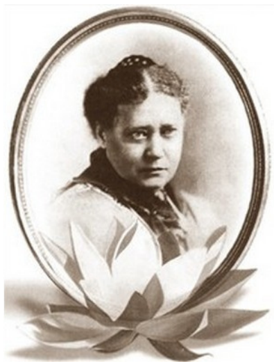
Рис. 1. Блаватская Елена Петровна

стой, как родниковая вода; и только когда ищущий наберется храбрости сделать шаг в дверь, находящуюся в конце души, к своему Духу и сделает его, чтобы установить постоянный контакт со своим Высшим Я – настоящим источником жизни и знания.