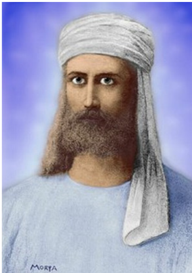
Рис. 2. Эль Мория

А вот что пишет один из тех, кто давал эти знания: «Когда я находился в воплощении в последний раз, и вы слышали об этом воплощении как Эль Мории, я приходил с целью дать западным ученикам часть тайных знаний, которыми обладали посвящённые со времён древней Лемурии и Атлантиды. Доступ к этим знаниям был открыт для очень немногих посвящённых, приходящих в воплощение вновь и вновь, чтобы поддерживать пламя Истины горящим в этой физической октаве.