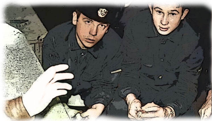
Наряд по кухне. БЛУГА 1970

Говорят, демократы таки добились отмены дневальных нарядов... На святое покусились, истинно вам говорю! Боюсь даже представить уровень безопасности полетов тех, кто не стоял на тумбочке!