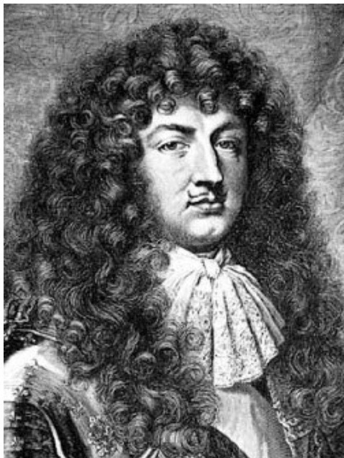
Людовик XIV, гравюра XVII в.

Людовика называли «Король Солнце». Хотя, пожалуй, у людей, давших ему это прозвище, было странное представление о солнце. Едва ли оно похоже на мужчину среднего роста с высокомерным и брюзгливым выражением лица. (Под старость король стал просто уродлив. Особенно на парадных портретах, где он стоит в особенных, вымученно-величественных позах).