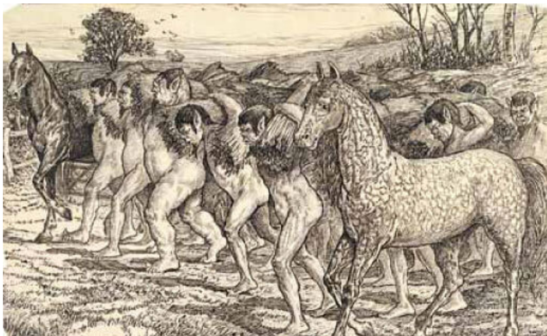
Еху тащат снопы для высших лошадоподобных существ (гуингнмов), худ. Луи Джон Рхэд

В этой стране ни один закон не может заключать в себе больше слов, чем имеется букв в алфавите, а букв всего двадцать две. Но даже такой длины достигают только очень немногие законы. Все они составлены в самых ясных и простых выражениях. Надо ещё добавить, что эти люди не отличаются такой изворотливостью ума, чтобы открывать в законе несколько смыслов, а сочинять толкования на законы считается у них большим преступлением».