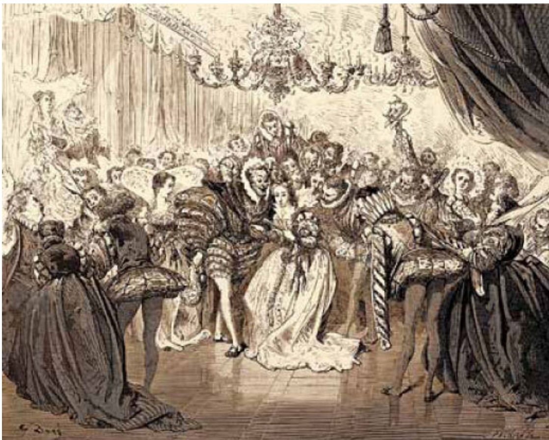
«Золушка», илл. Гюстава Доре

Хочется сказать: это и были те сказки Перро, которые мы сейчас знаем. Нет. Не совсем. Тексты, записанные сыном, стали для отца только отправной точкой для работы. Даже после того, как обработанные сказки были преподнесены принцессе, Перро продолжал их переделывать.