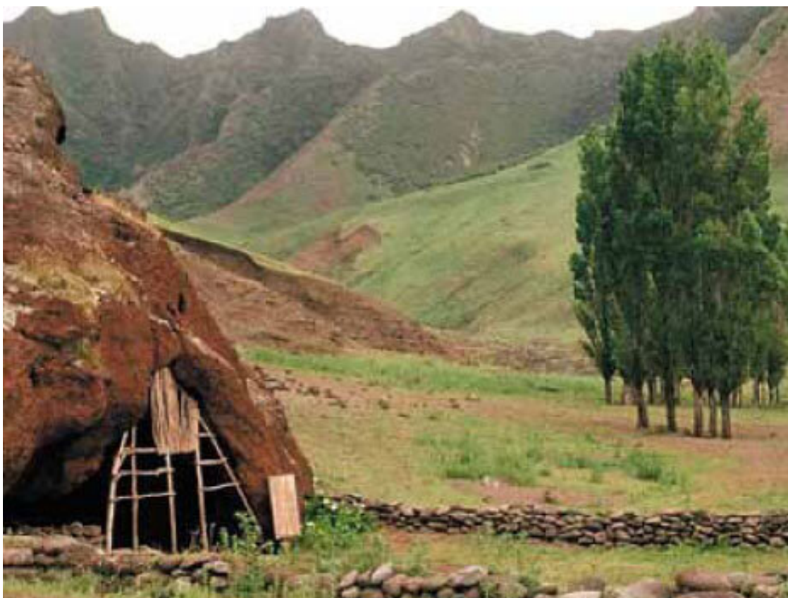
Хижина Селькира на острове Мас-а-Тьерра (сейчас остров Робинзон-Крузо)

Но была ли в истории Робинзона документальная основа?