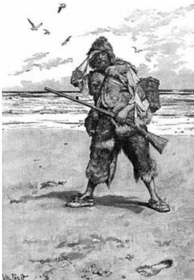
Илл. к «Робинзону Крузо», худ. Н. С. Уайт

Но самая знаменитая книга Дефо, «Жизнь и удивительные приключения Робинзона Крузо», это совсем другое дело. Это – героическая сага о сильном и неутомимом европейце, который несёт всю цивилизацию в себе и может постепенно воссоздать её в одиночку на ровном месте. Стать охотником, потом скотоводом, потом земледельцем, приобщить к просвещению и культуре дикаря (притом сделав его своим слугой), наконец, основать государство. Робинзон – это подобие Гильгамеша, героя древнейшего сохранившегося эпоса. Он ровня Гераклу и Самсону, Ахиллу и Одиссею. И он – обычный англичанин своего времени. Конечно, идеализированный.