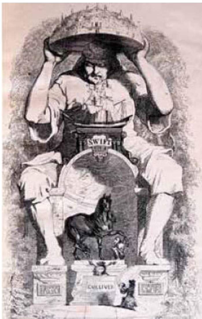
«Приключения Гулливера», Париж, 1838, худ. Жан Гранвиль

Когда, одетого в козы шкуры, одичавшего Селькирка доставили на английское судно (тоже пиратское), он увидел там... Дампира. Селькирка охватил ужас, и он не хотел выходить из шлюпки. Но ему объяснили, что экспедицией на сей раз командует другой человек. А учёный пират, смилостивившись, дал своему мятежному подчинённому хорошие рекомендации... Так что капитан Роджерс не только пустил островитянина на судно, но и назначил своим помощником. Вместе с ним Селькирк, грабя испанские галеоны, обошёл вокруг света и вернулся в Англию.