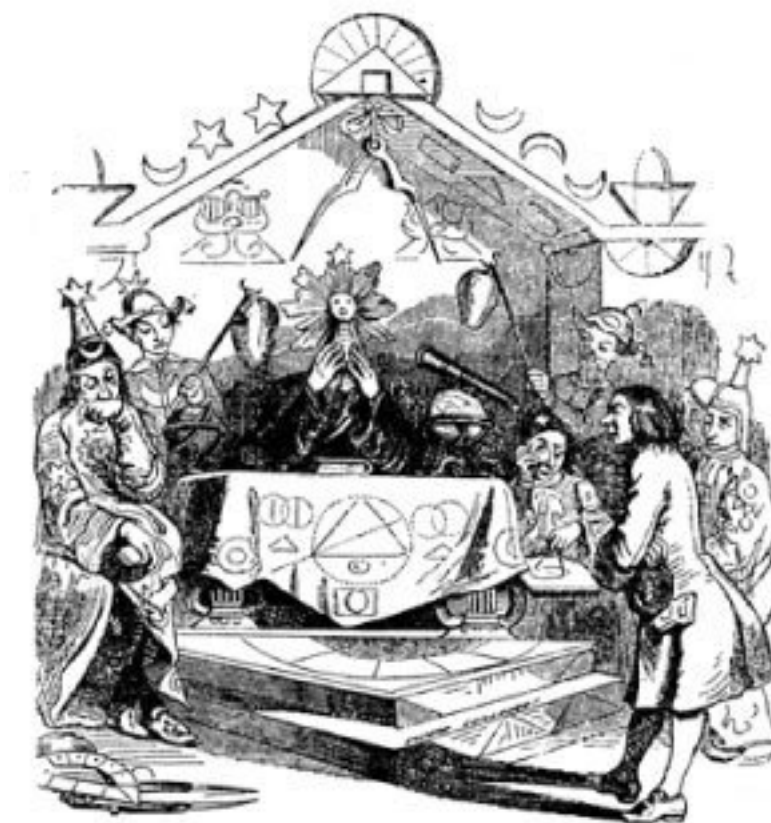
«Гулливер. Путешествие в Лапуту», худ. Жан Гранвиль

А вот мир великанов на наш не похож. Это разумный, гармоничный мир. Но на чём основана его гармония? Броддинггег – общество тотального упрощения.