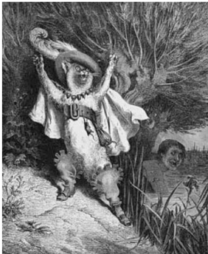
«Кот в сапогах», илл. Гюстава Доре

Кот поднёс дичь королю, выдав её за подарок своего хозяина – Маркиза де Карабаса. Восемнадцатилетний Пьер Дарманкур (всё-таки не совсем уже ребёнок) поднёс пять сказок (в том числе эту, про кота в сапогах) королевской племяннице, принцессе Орлеанской (своей, кстати, ровеснице). Кот приписал свои охотничьи трофеи другому. А Пьер выдал за собственное произведение сказки, автором которых, как считается, был всё-таки не совсем он. Во всяком случае, не он один.