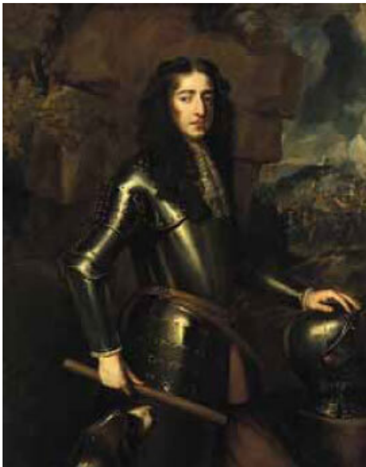
Вильгельм III Оранский, худ. Виллем Виссинг, XVII в.

Вообще парадокс тогдашней английской истории в том, что короли пытались облегчить положение меньшинства, а демократические институты им этого сделать не давали. Дискриминация касалась и протестантов других толков – не англикан. (Но их положение было легче, чем у католиков).