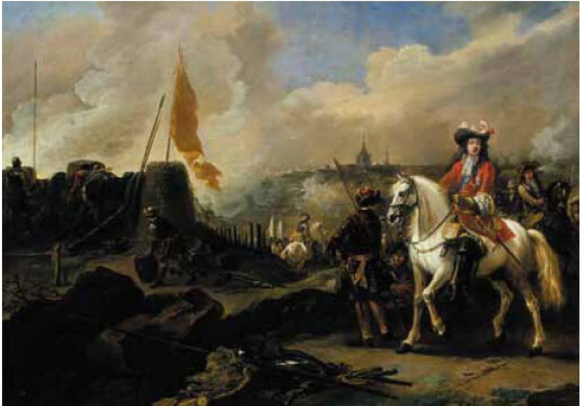
Джейс Скотт, герцог Монмут и Баклу, худ. Ян Вик, XVII в.

Что поделать: законных детей у Карла II не было. А значит, престол должен был занять его брат. Правда, старший из многочисленных бастардов покойного короля, герцог Монмаунт, поднял мятеж против своего дяди и попытался завладеть короной.