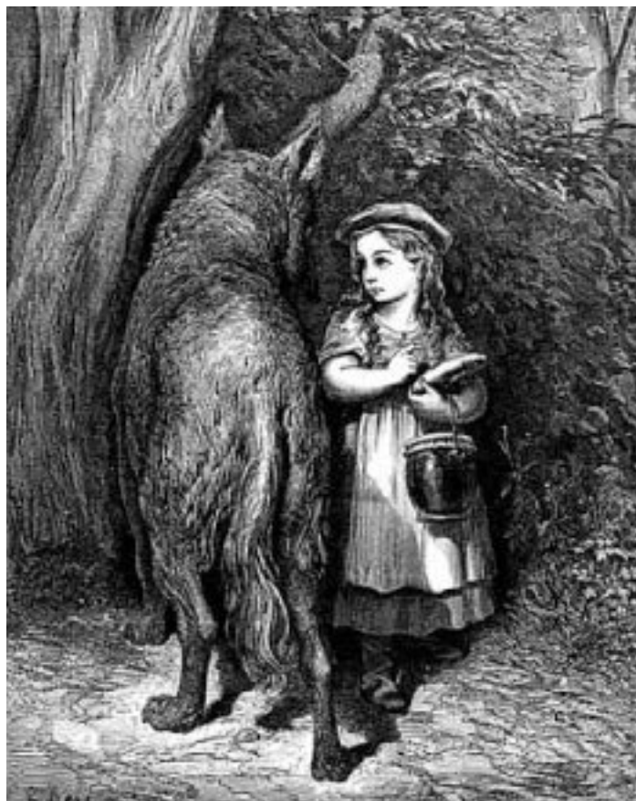
«Красная Шапочка», илл. Гюстава Доре

Вот «Синяя Борода». Подлинная история гораздо страшнее сказочной. Человек, носивший это прозвище (борода у него была чёрной, с синеватым отливом, а волосы на голове намного светлее) – Жиль де Рец (1404–1440), полководец, друг и соратник Жанны д'Арк, книголюб и алхимик. Жиль де Рец обвинили в похищении не то двухсот, не то восьмисот мальчиков и девочек, которых он жестоко пытал, а потом приносил в жертву каким-то демонам во время алхимических опытов – чтобы добыть философский камень и эликсир бессмертия. Показания Жиль де Рец и его слуги дали под пытками. Справедливы или нет обвинения, до сих неизвестно, но ни одного трупа в замке де Рец не нашли. А дети – дети действительно пропадали... Народная легенда превратила кровавого алхимика в обычного brutального многожёнца (кстати, жена у Жиль была всего одна).