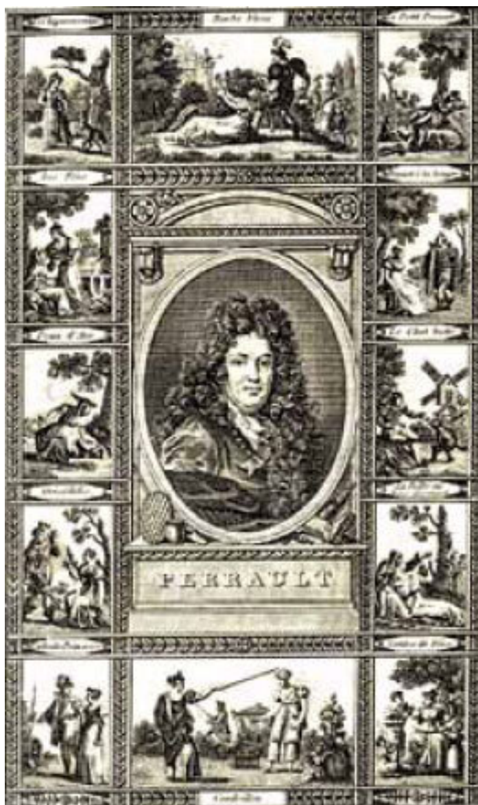
«Сказки матушки Гусыни», начало XIX в.