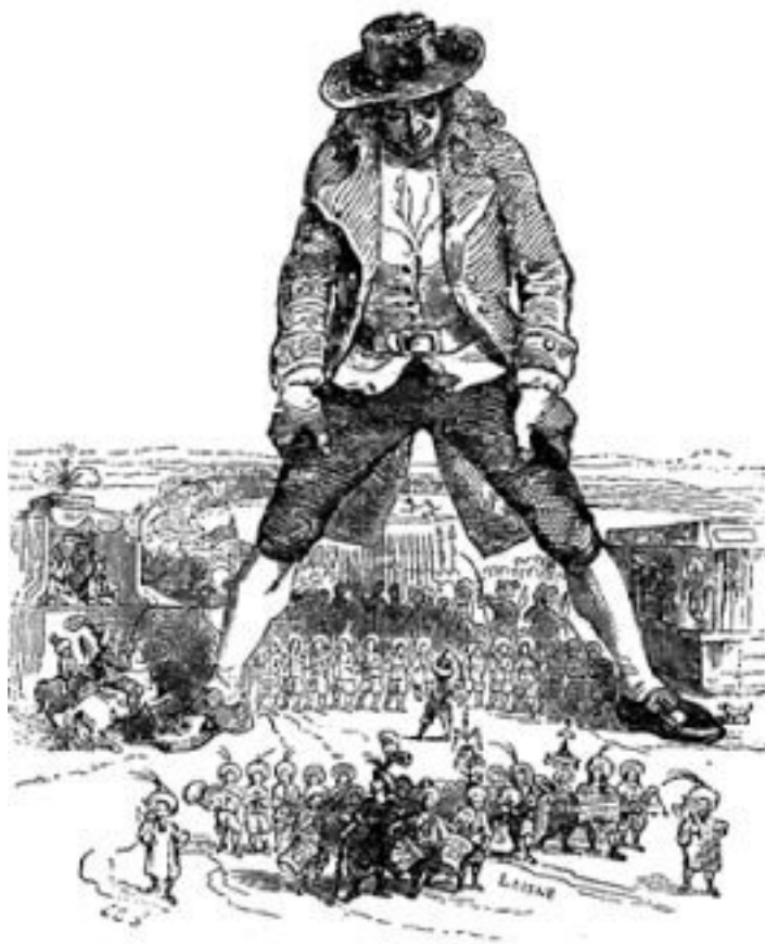
«Гулливер в стране лилипутов», худ. Жан Гранвиль

Свифт, в отличие от Дефо, не выдавал свой вымысел за чистую монету. Он давал волю фантазии и приглашал читателей наслаждаться этой фантазией. Но его миры подчинены строжайшему математическому расчёту. Например, в мире лилипутов всё (в одном измерении) ровно в двенадцать раз меньше, чем в нашем, а в мире великанов – во столько же раз больше.