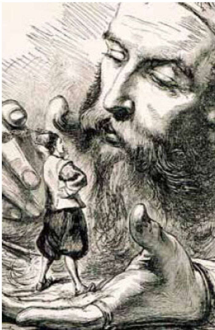
«Гулливер. Путешествие в Бробдингней», худ. Т. Мортен