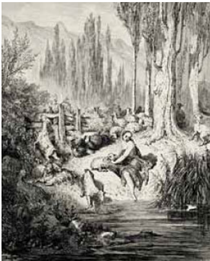
«Ослиная шкура» илл. Гюстава Доре

В соответствии со своими теориями Перро написал несколько сказок в стихах. Первую – «Гризельда» – он сочинил ещё в молодости, но долго не печатал. Из всех сказок Перро эта, может быть, самая страшная, даже чудовищная. И не потому, что там происходят какие-то театральные ужасы.