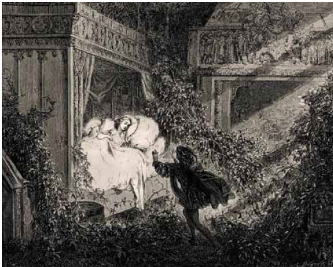
«Спящая красавица», илл. Гюстава Дора

Да и «Спящая красавица» у Перро заканчивается вовсе не счастливым пробуждением от поцелуя принца. С этого места начинается совсем другой сюжет: у принца есть матушка из племени людоедов, которая, движимая своим непобедимым инстинктом, хочет съесть невестку и внуков. (Почему она в своё время не съела мужа и сына, не объясняется). Добрый дворецкий спасает бывшую спящую принцессу, но дальше всё оборачивается не так хорошо: