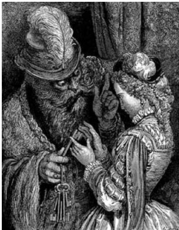
«Синяя Борода», илл. Гюстава Доре

Все эти ужасы, уходящие в незапамятную древность, не пугали галантных читателей конца XVII века. Они привыкли ко многому. Во Франции, например, вплоть до второй половины следующего столетия практиковались чудовищные по изощрённости публичные казни. А сказки хранили воспоминания о временах не столь уж давних, но ещё более кровавых.