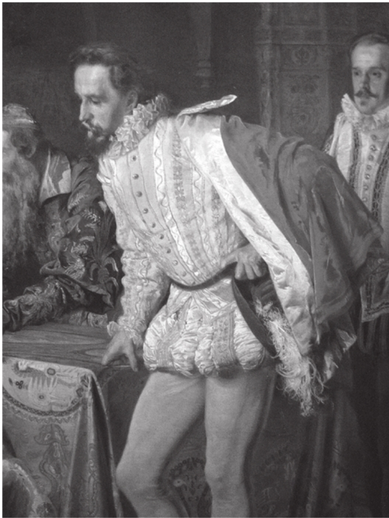
Джером Горсей – английский дворянин, дипломат.