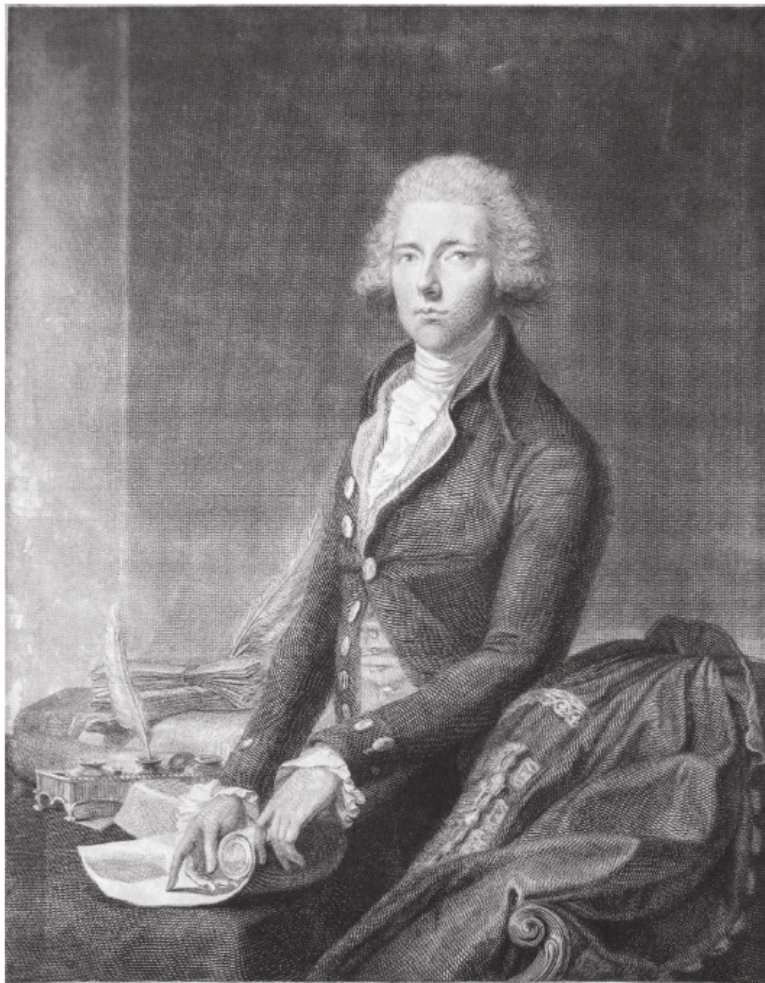
Уильям Питт-младший. На протяжении в общей