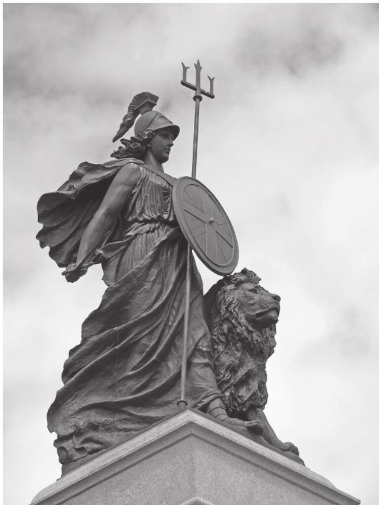
«Правь, Британия». Статуя, олицетворяющая Бри-