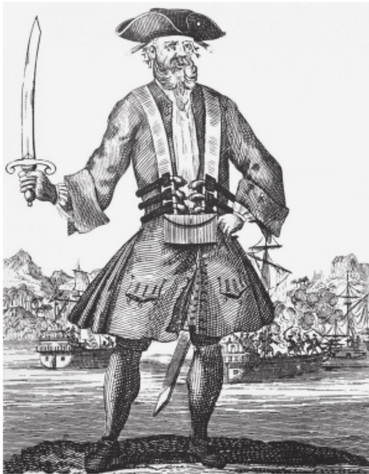
Знаменитый английский пират Эдварт Тич, он же