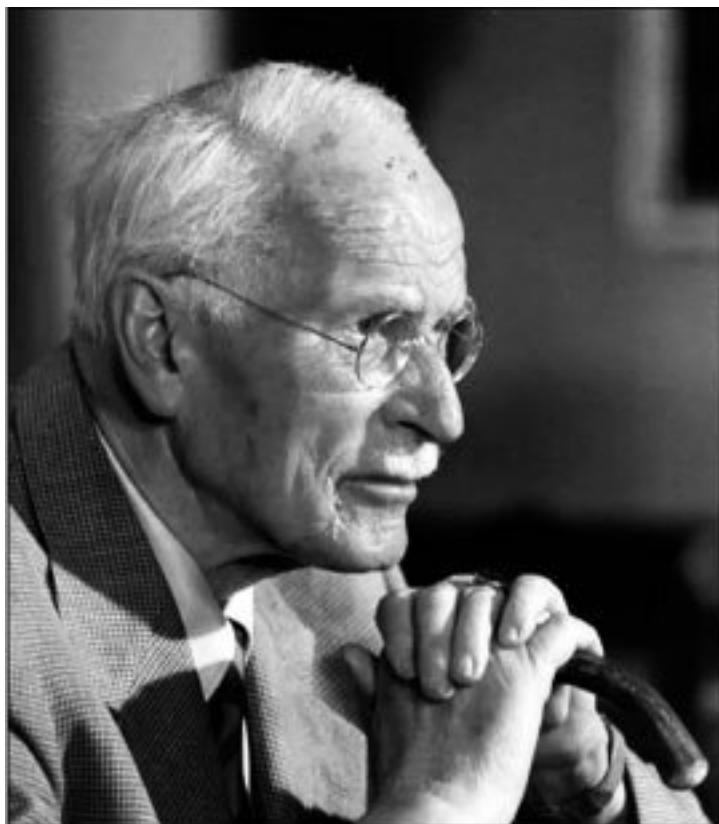
Карл Густав Юнг швейцарский психиатр 1875—1961 годы жизни