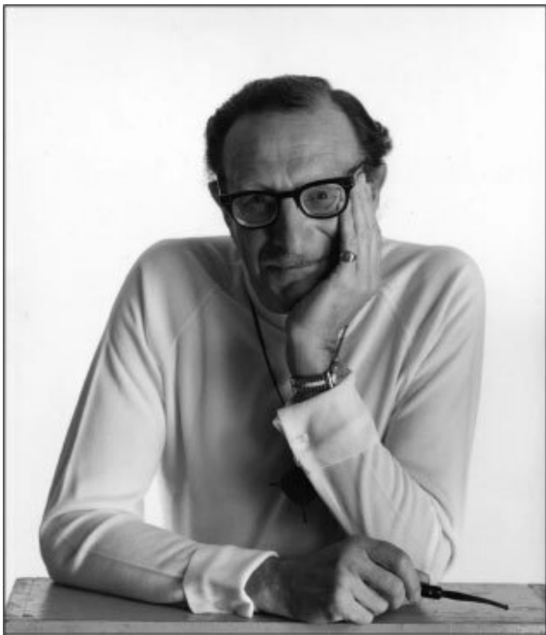
Эрик Бёрн американский психиатр 1910 — 1970 годы жизни