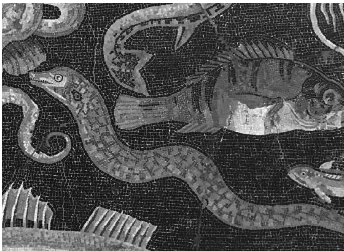
Это мурена! Морская мозаика из Дома фавна в Помпеях, хранится в Национальном археологическом музее Неаполя.

В сельской местности однообразие такого рациона компенсировали охота и рыбалка. В городах же, особенно в греческих, разнообразить стол позволяли религиозные праздники, когда в жертву приносили животных и устраивали всеобщее пиршество. В римскую эпоху, помимо появления в меню блюд из свинины, единственным новшеством с течением времени стало использование в пищу новых культур, в первую очередь персиков, абрикосов и лимонов 83 .