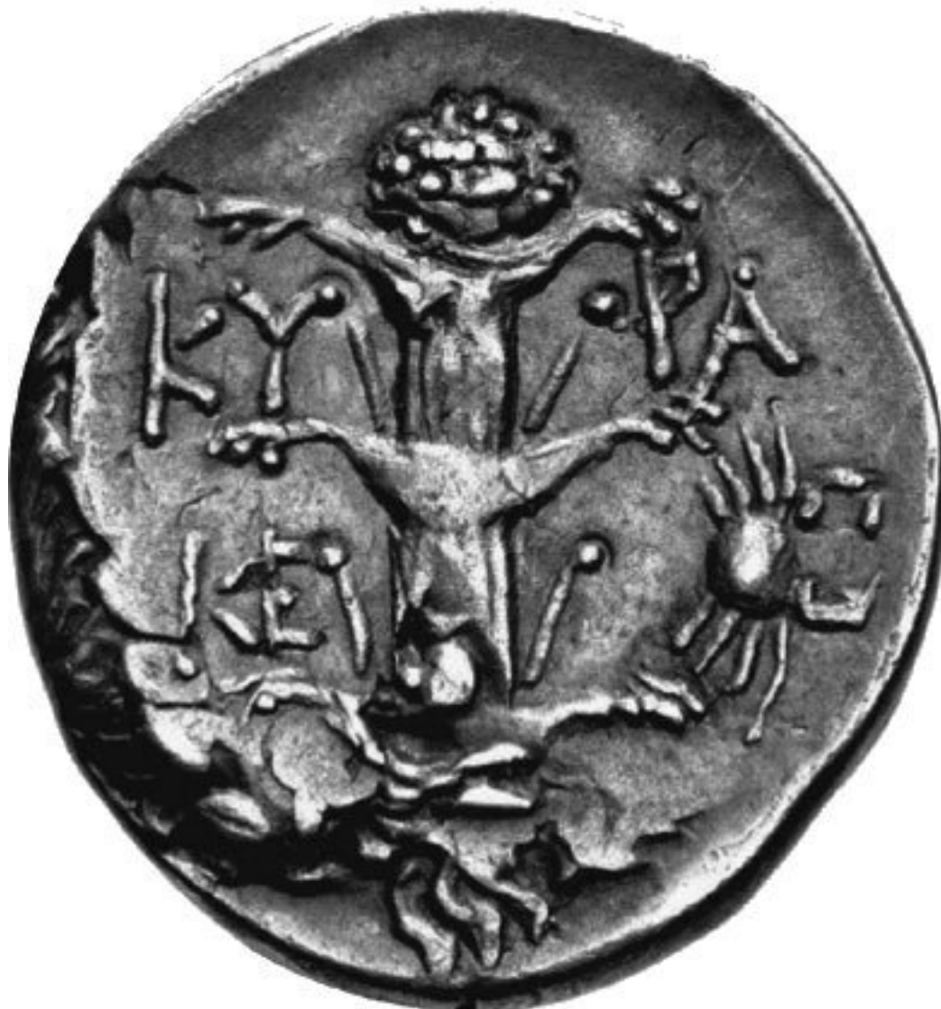
Стебель сильфия, изображенный на монете из Кирены.

вания акта – особенно эффективного, по мнению одного автора, если женщина задерживала дыхание 53 .