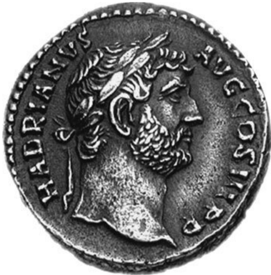
Адриан и его величественная борода

После смерти Александра, несмотря на непростое законодательство в отношении растительности на лице, тренд на гладко выбритые щеки быстро распространился по греческому миру. Новую моду приняли не все. В частности, своими бородами продолжали гордиться представители интеллигенции. Один философ утверждал, что, если бы ему пришлось выбирать между бритьем и смертью, он бы с радостью покинул этот мир. Сохранялось ощущение, что щетина выглядит благороднее, чем щеки в порезах. В императорскую эпоху один путник, приехавший в отдаленный греческий город, застал всех мужчин с традиционной бородой, за исключением одного негодяя, побрившегося, как говорили, чтобы произвести впечатление на римлян 20 .