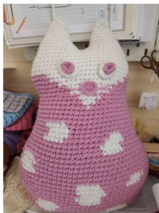
Та самая Шарлотта