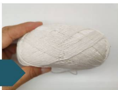
Не смогла не купить