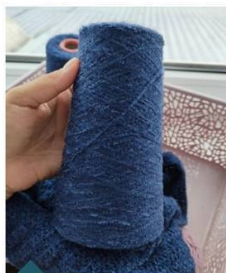
Бобина тонкого букле