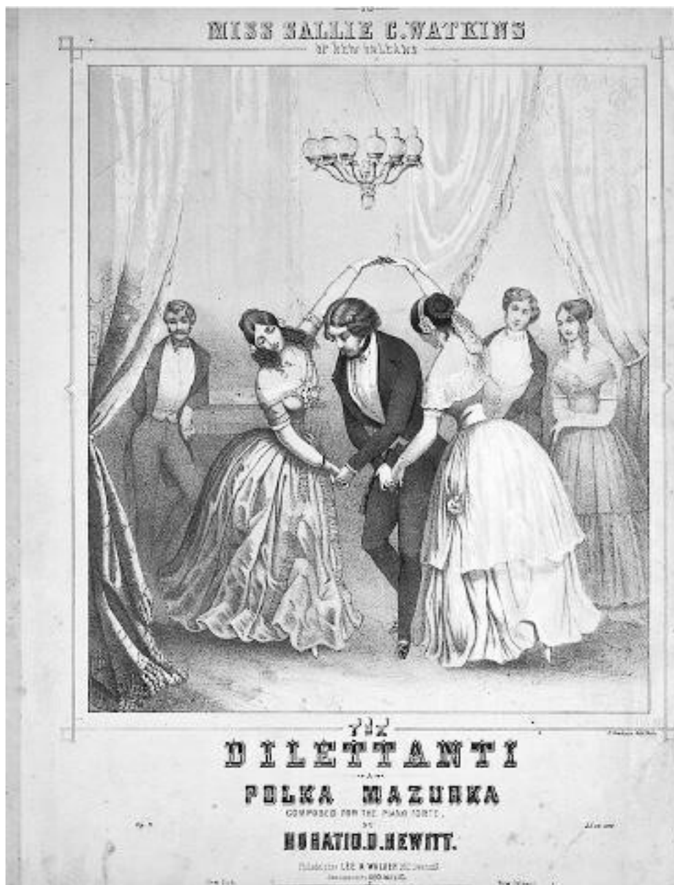
Мазурка. Иллюстрация на обложке The Dilettanti Polka Mazurka. 1850 год 4