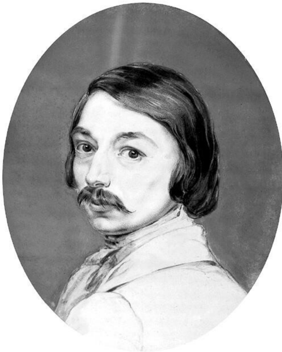
Жан Жерень. Портрет Николая Гоголя. Конец 1830-х годов.