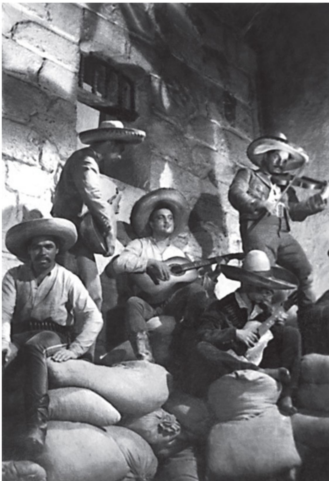
«Мексиканец», массовка. В центре – я!