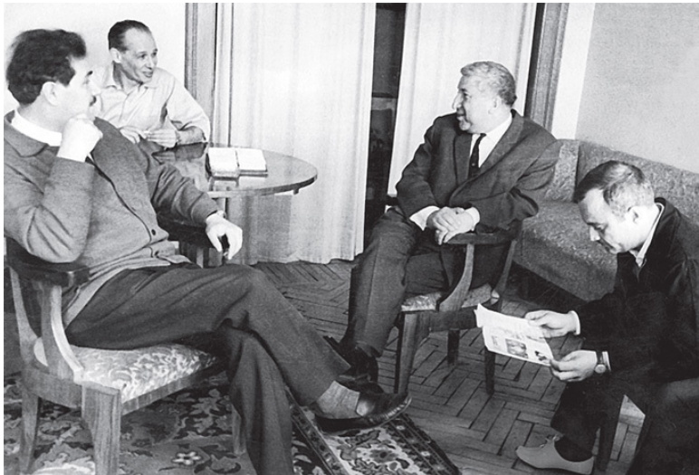
Григорий Чухрай, Владимир Александрович Познер, Ра- сул Гамзатов и я