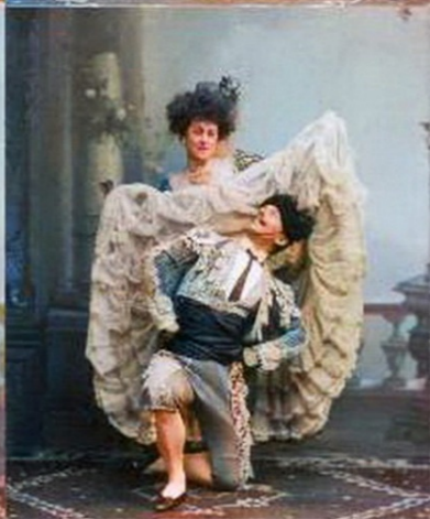
Томаш Нижинский и Мария Лабунская в сценических костюмах. Санкт-Петербург, лето 1900 года