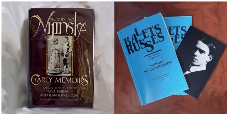
Фото книг из личной библиотеки автора