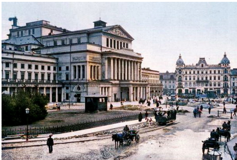
Большой Театр в Варшаве, конец XIX века