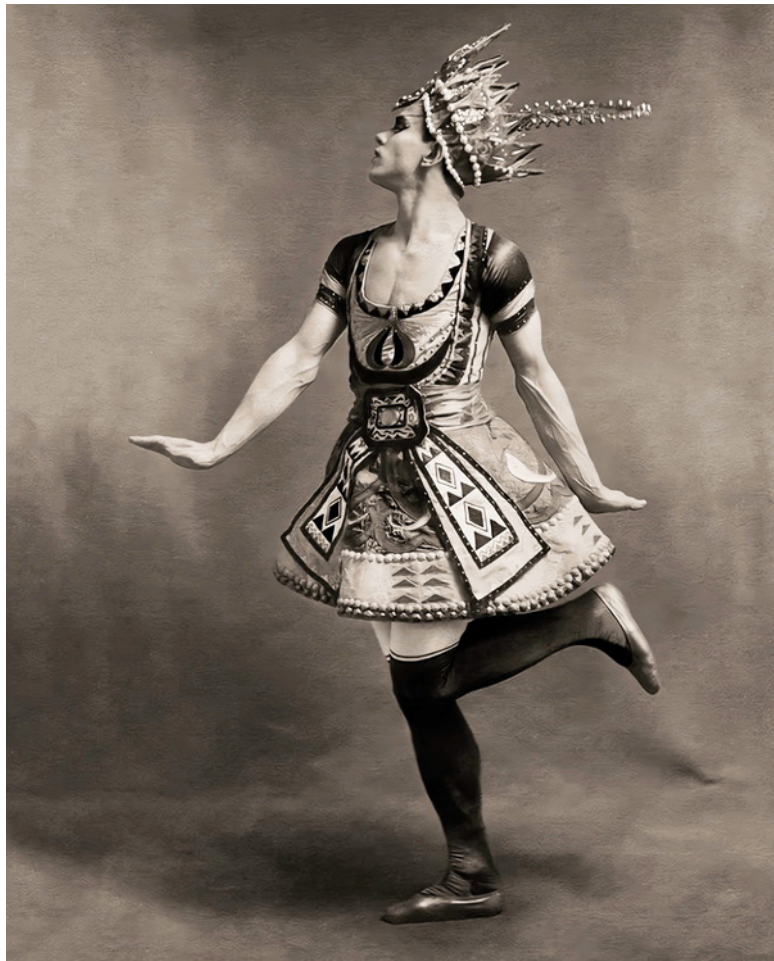
Вацлав Нижинский в балете «Синий Бог», Париж, 1912 год