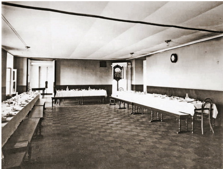
Столовая Санкт-Петербургского Императорского Театрального Училища. Начало XX века