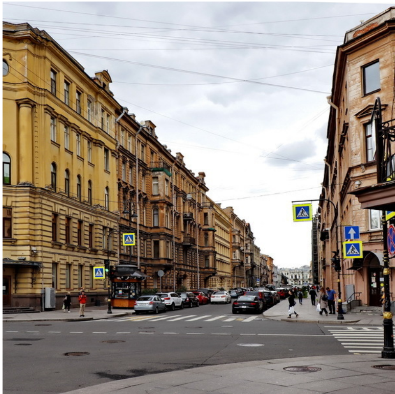
Улица Моховая. Пересечение с улицей Пестеля. Дом 20 – второй по правой стороне. Современный вид.