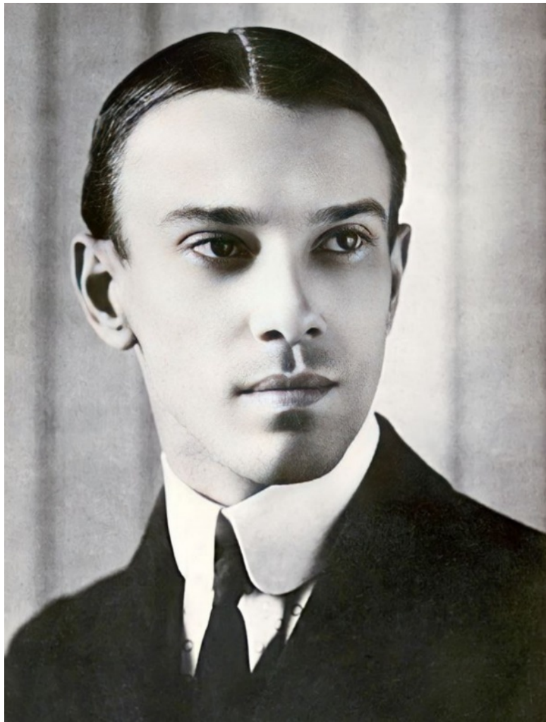
Вацлав Нижинский на вершине своей славы в возрасте 23-