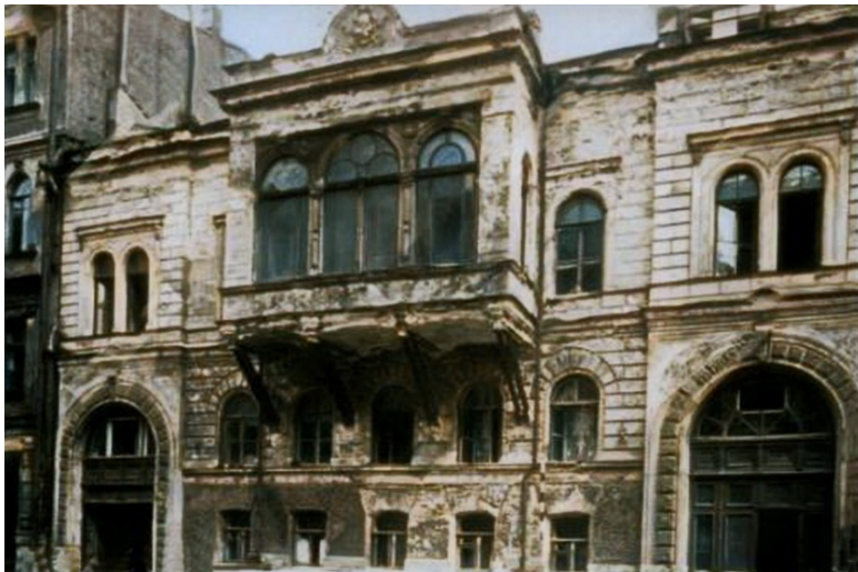
Улица Моховая, 20. Вид дома после войны, до реставрации в середине XX века