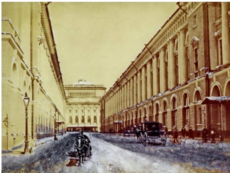
Театральная улица в Санкт-Петербурге. Справа – Императорское Театральное Училище. Конец XIX века