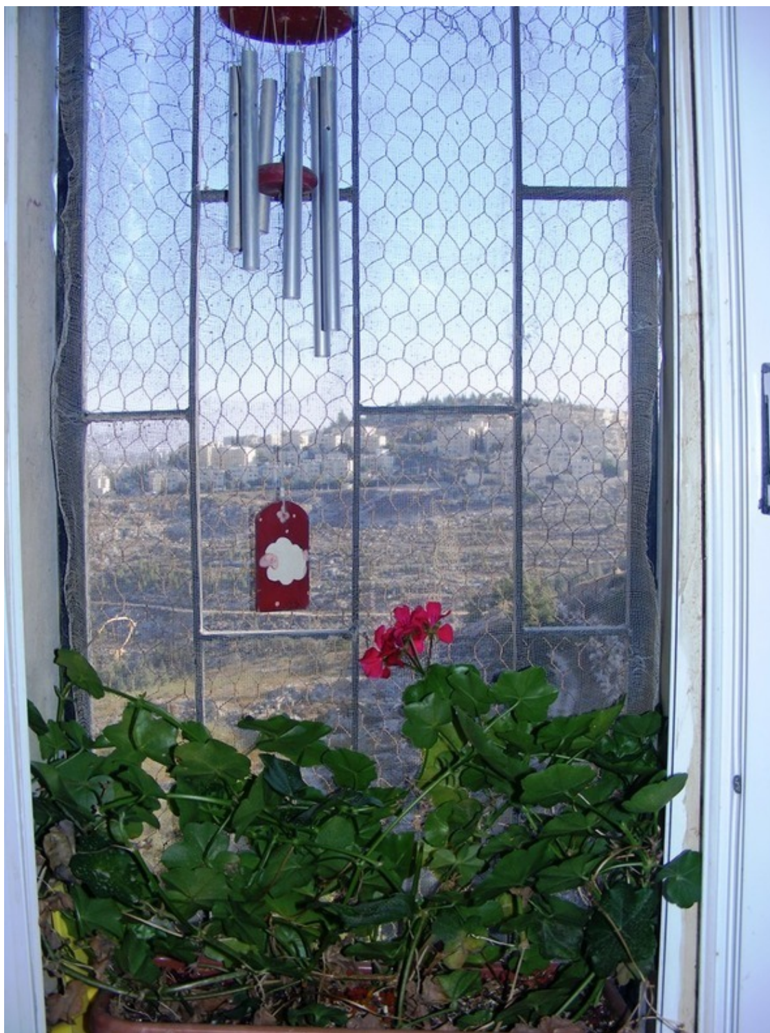
Герань под моим окном.