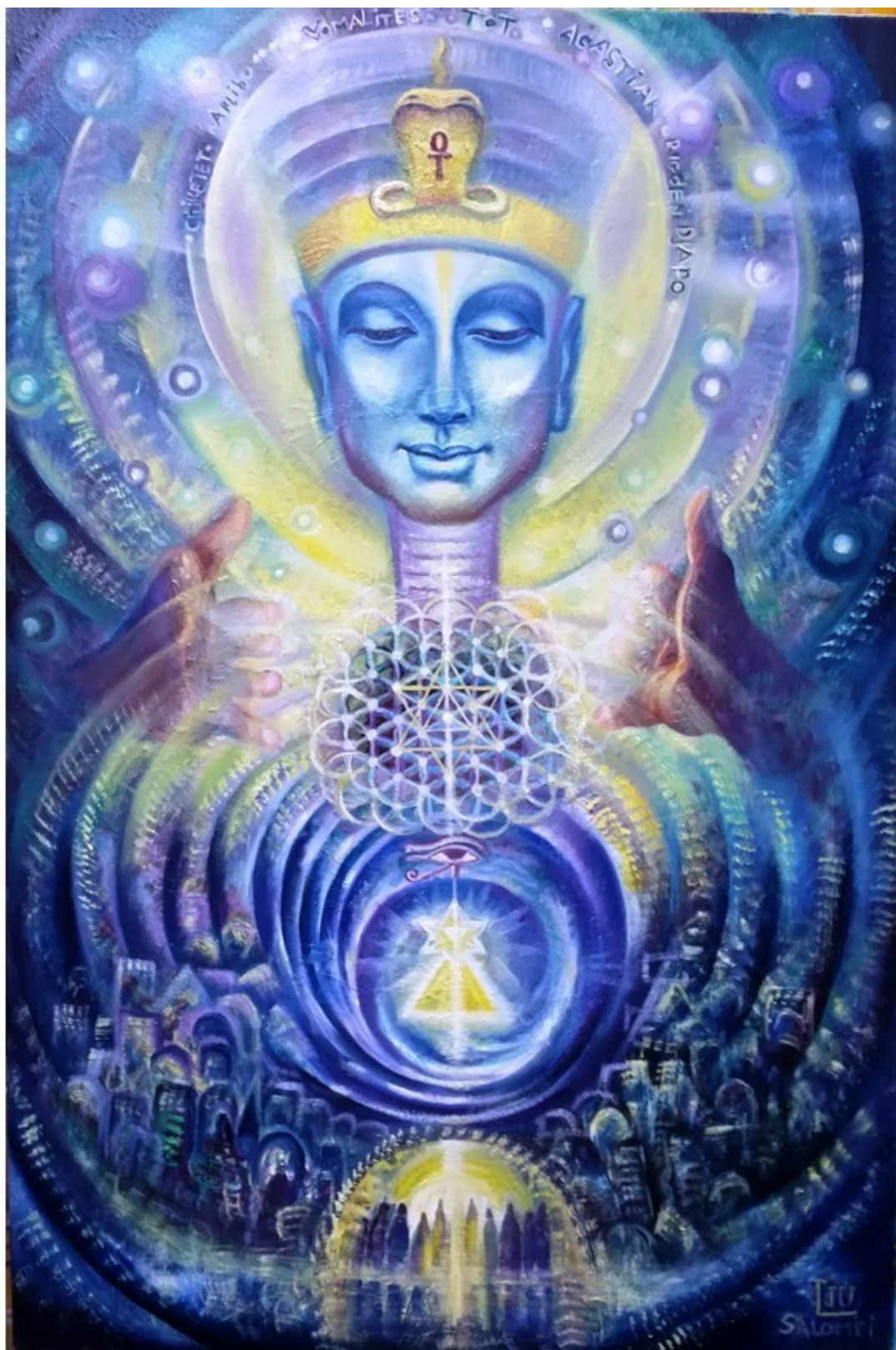
Это Тот – Бог мудрости, знаний, Луны, покровитель библиотек, ученых, чиновников, государственного и мирового порядка. Он же создатель цивилизации древнего Египта. (Эзотерическая картина Юлии Лагус)