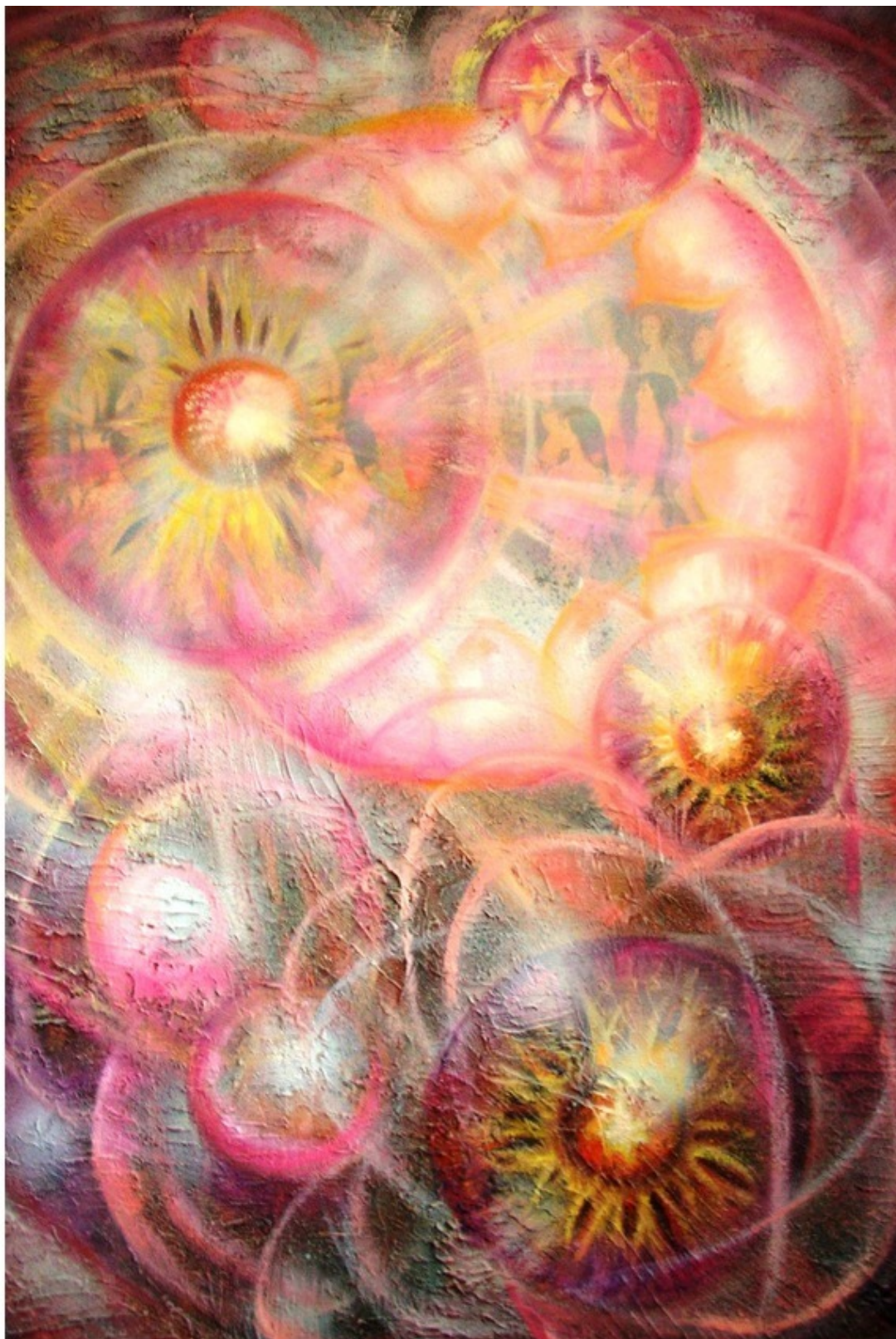
Эзотерическая картина Юлии Лагус