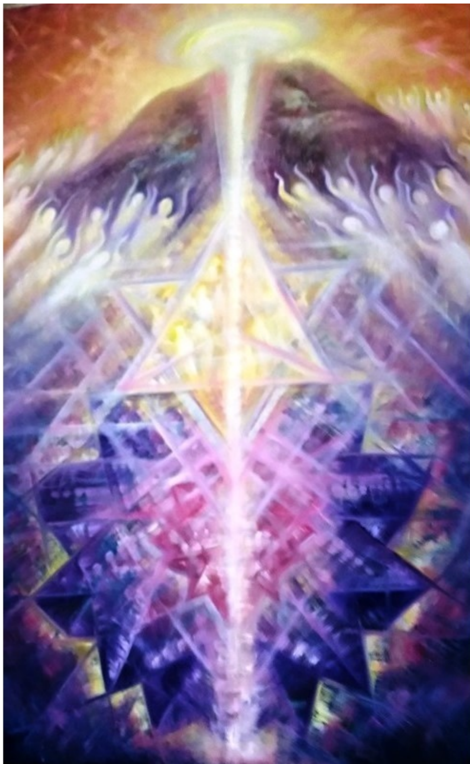
Эзотерическая картина Юлии Лагус