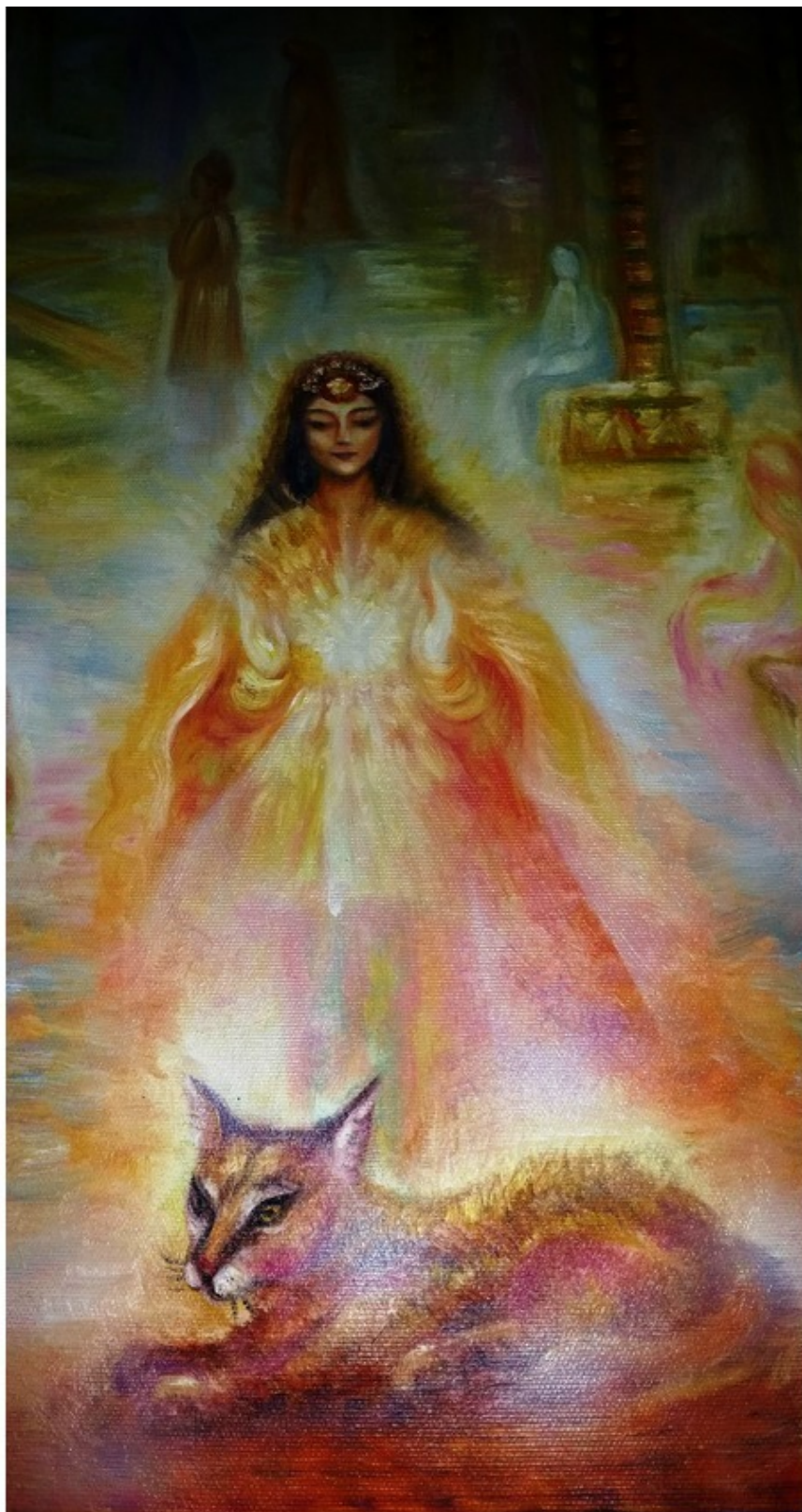
Эзотерическая картина Юлии Лагус