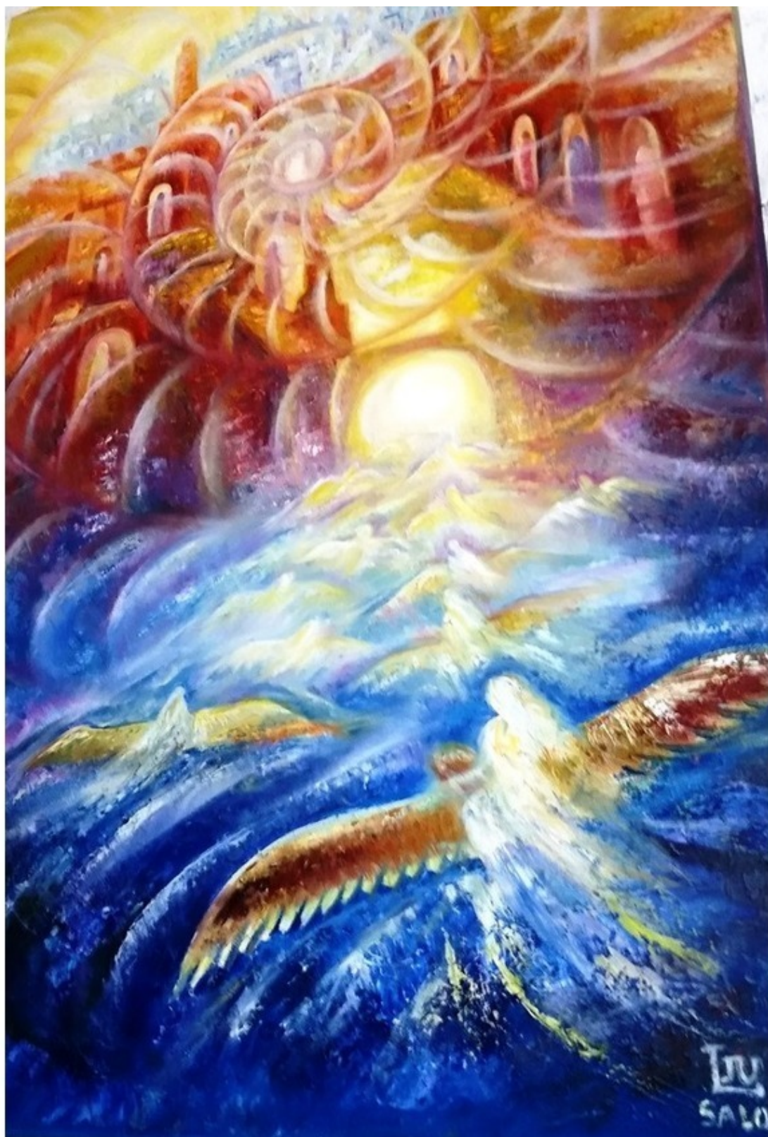
Иерусалим – город загадок и мистики – открывает свои тайны. Эзотерическая картина Юлии Лагус