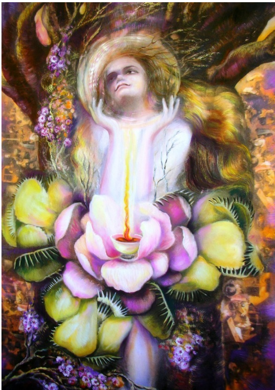
«Сила женщин» – эзотерическая картина Юлии Лагус.