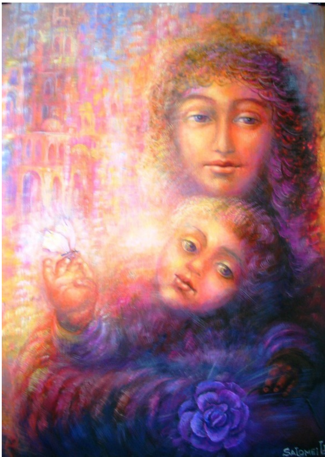
Эзотерическая картина Юлии Лагус