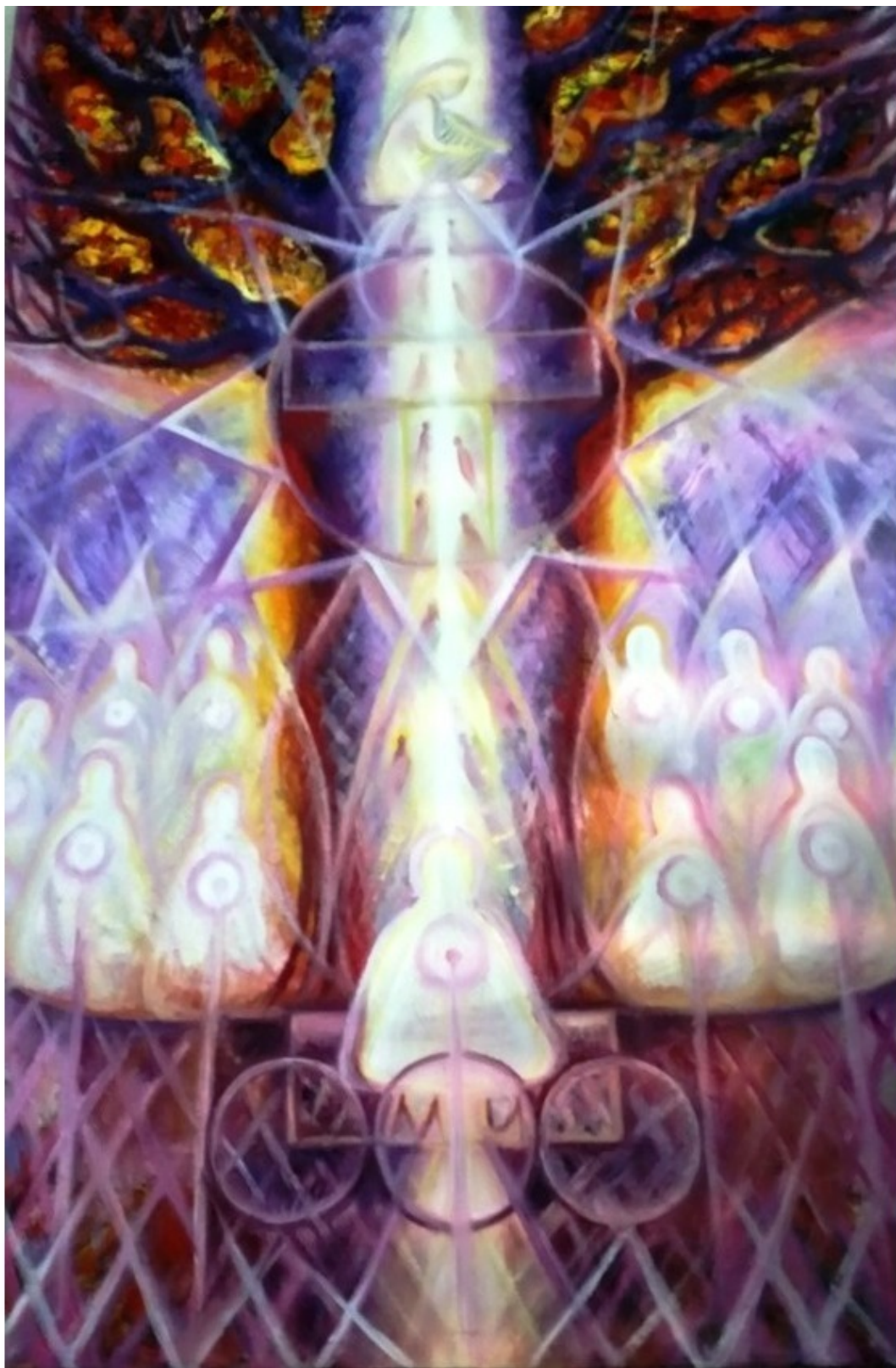
Эзотерическая картина Юлии Лагус