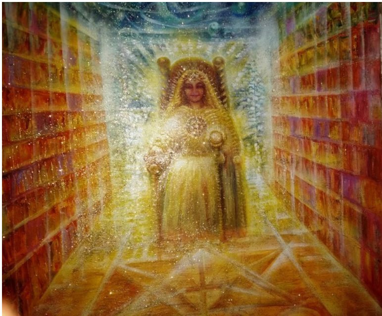
Ашера-мама Иерусалима. Помогает всем нуждающимся. Хранит историю Иерусалима. Эзотерическая картина Юлии Лагус.