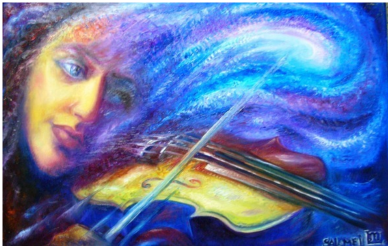
Эзотерическая картина Юлии Лагус