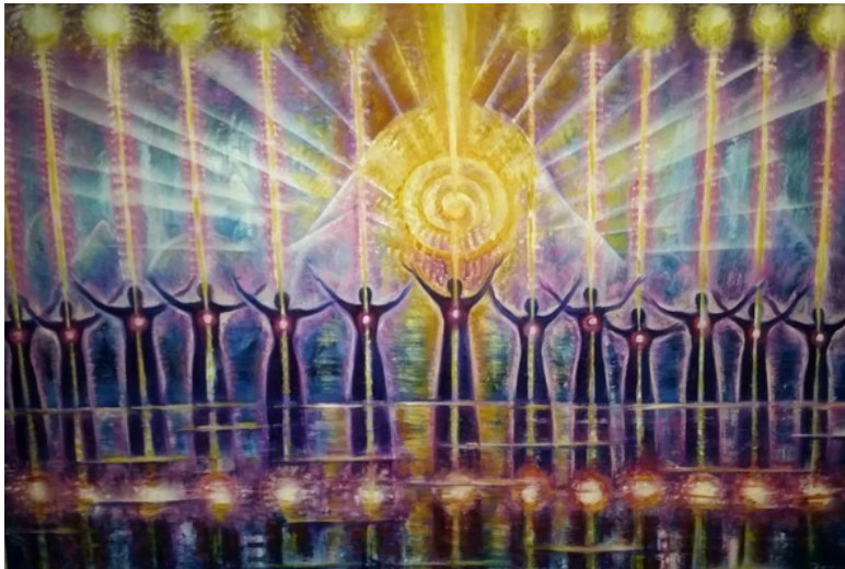
«Уход под воду – последняя песня» – эзотерическая картина о Лемурии кисти художника Юлии Лагус.