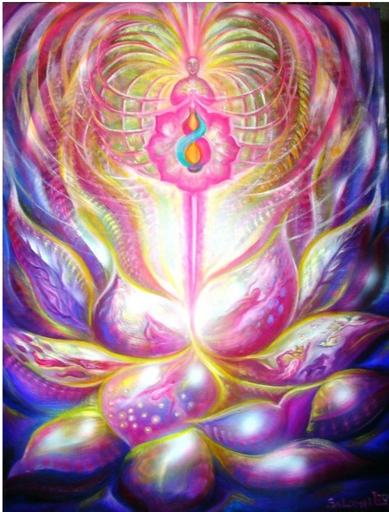
Эзотерическая картина Юлии Лагус