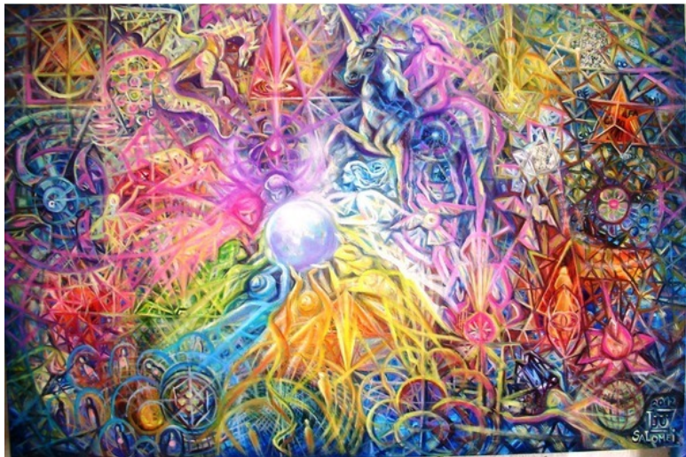
Эзотерическая картина Юлии Лагус