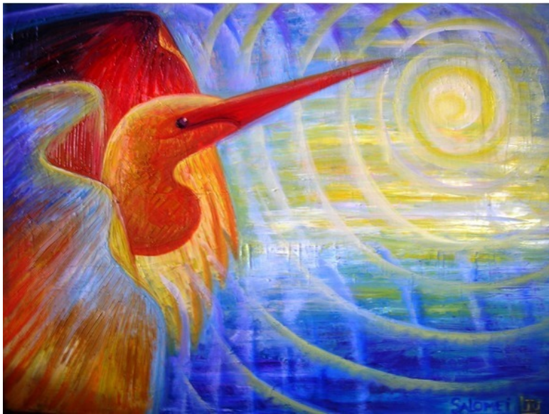
Эзотерическая картина Юлии Лагус