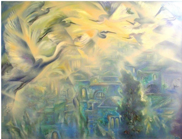
«Птицы над Иерусалимом» – эзотерическая картина Юлии Лагус.