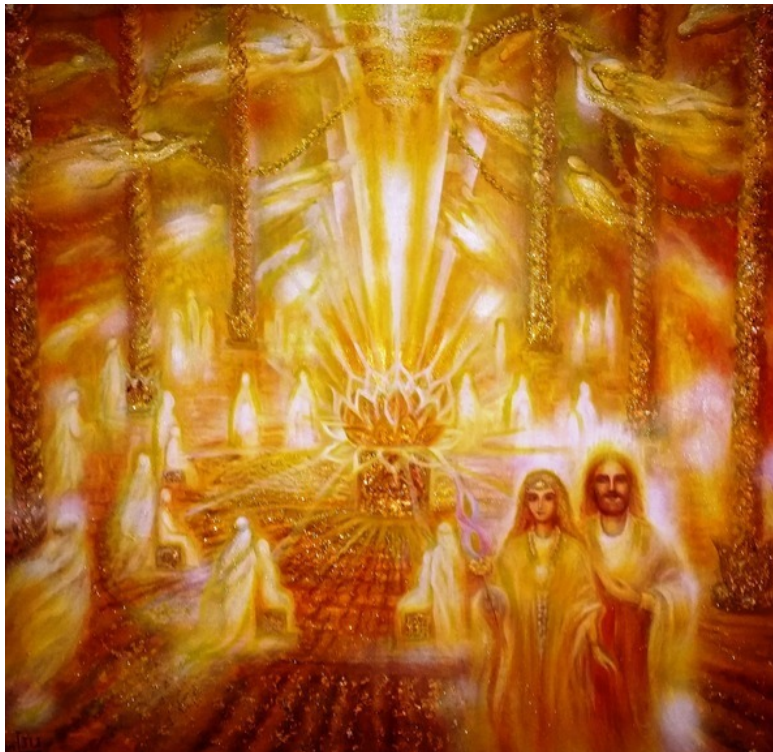
Эзотерическая картина Юлии Лагус