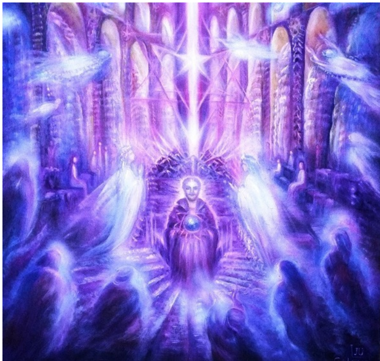
Эзотерическая картина Юлии Лагус