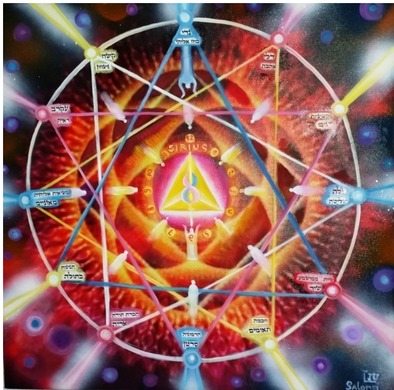
«Космические часы» – эзотерическая картина Юлии Лагус