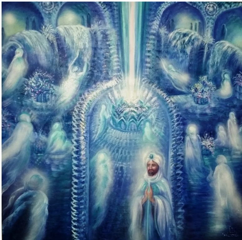
Эзотерическая картина Юлии Лагус