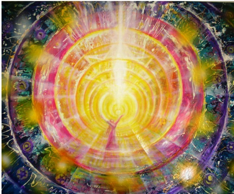
Эзотерическая картина Юлии Лагус