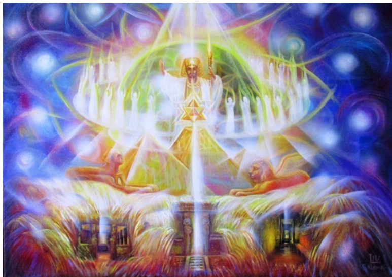
Эзотерическая картина Юлии Лагус