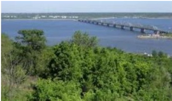
великая река Волга