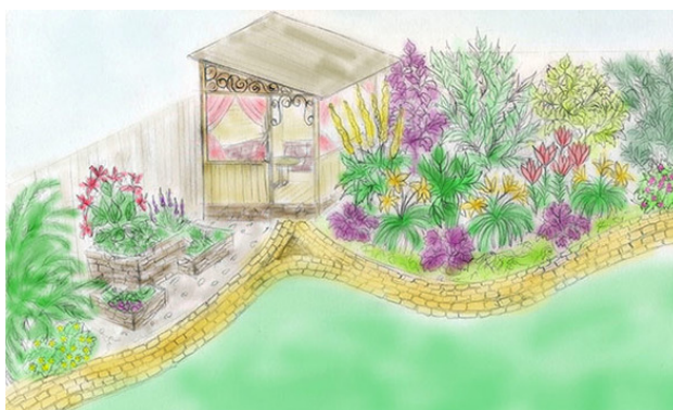
Природный стиль сада, эскиз

• Природный же стиль более мягкий, воздушный, допускает некоторую небрежность, свободные линии напоминают естественные ландшафты с их плавностью и непредсказуемостью.