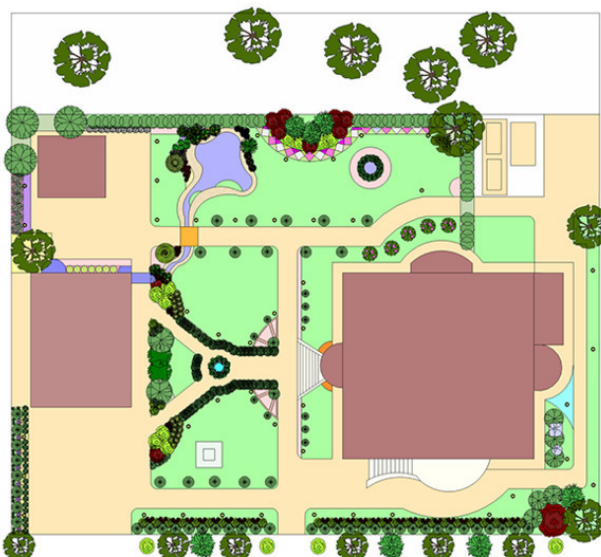
Регулярный стиль сада, план

• Природный же стиль более мягкий, воздушный, допускает некоторую небрежность, свободные линии напоминают естественные ландшафты с их плавностью и непредсказуемостью.