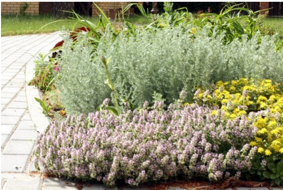
Тимьян, очиток, полынь

Перед началом благоустройства важно также уделить внимание инженерным сетям: дренажу, системе полива и системе освещения.