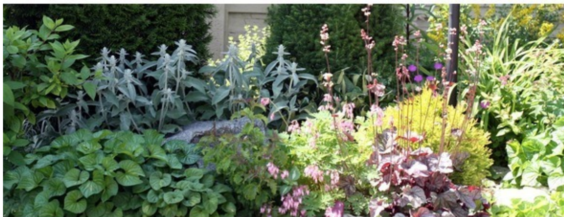
Клумба в природном стиле

Для того, чтобы идеи в самый ответственный момент не разбились об ограниченный бюджет, необходимо сделать предварительный расчёт. Это поможет уравновесить желания с возможностями и найти оптимальное решение.