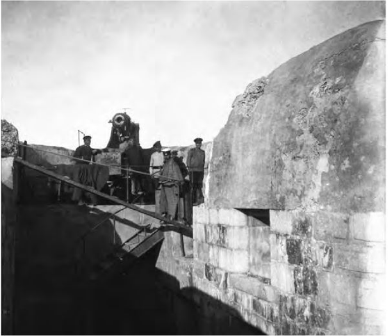
Офицер и солдаты у крепостного орудия в одном из фортов Порт-Артура