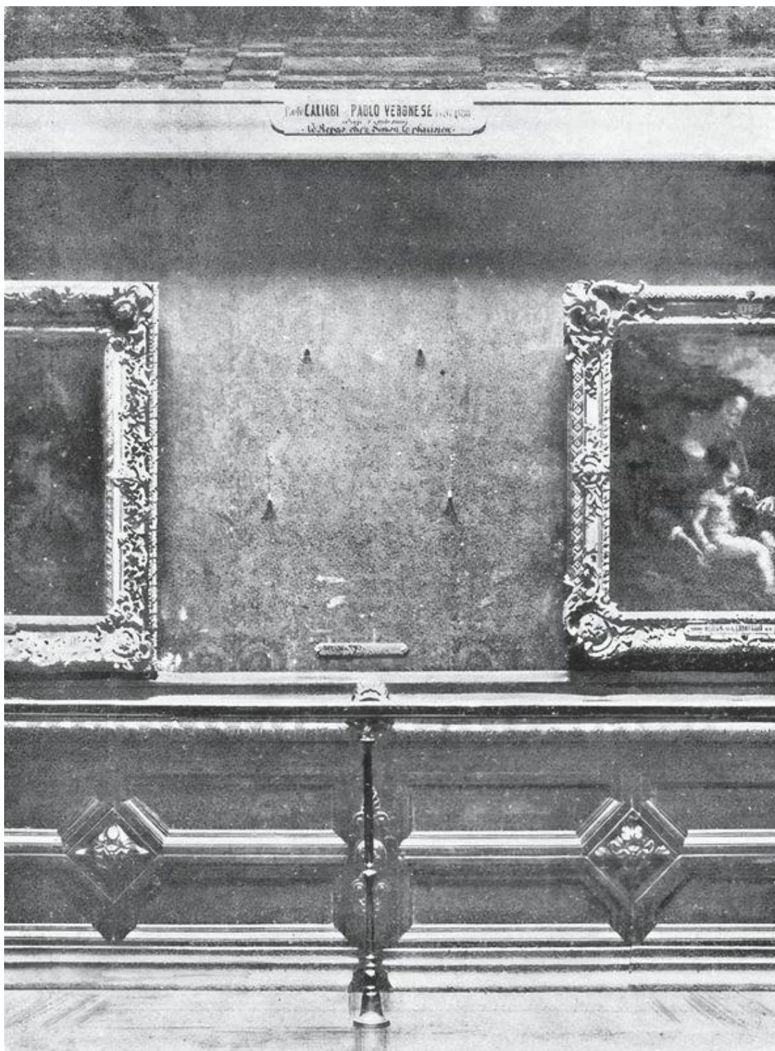
Пустая стена в Лувре, где висела «Мона Лиза»

«Мона Лиза» была для самого да Винчи особенной. Если сторонние заказы он часто выполнял нехотя, срывал сроки, а иногда вообще не завершал работу, то портрету таинственной девушки он посвящал все свободное время примерно в 1503–1505 годах и даже забрал картину с собой во Францию, куда переехал в конце жизни. Несмотря на десятки версий, мы достоверно не знаем, кто изображен на доске. Версии варьируются от Катерины Сфорца и Изабеллы Арагонской до автопортрета художника. Одно ясно – работал да Винчи над картиной