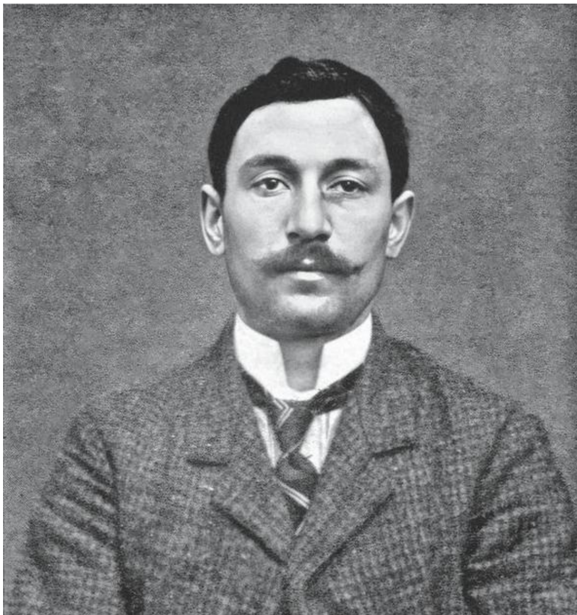
Винченцо Перуджа (1881–1925)

Преступление произошло в понедельник, когда музей был закрыт для посетителей. Пропажу заметили только на следующий день, причем даже не сотрудники музея, а начинающий художник, который пришел с утра копировать полотно великого мастера. Полиция отреагировала мгновенно – границы закрыли, каждый сантиметр Лувра исследовали в поиске улик. Тщетно – холст растворился в столице так же мистически, как и улыбка героини картины. Полиция распечатала шесть с половиной тысяч репродукций «Джоконды» и расклеила их по улицам в надежде, что кто-то случайно мог заметить картину. Директора Лувра уволили, как и ответственного за безопасность, но картину это не вернуло.