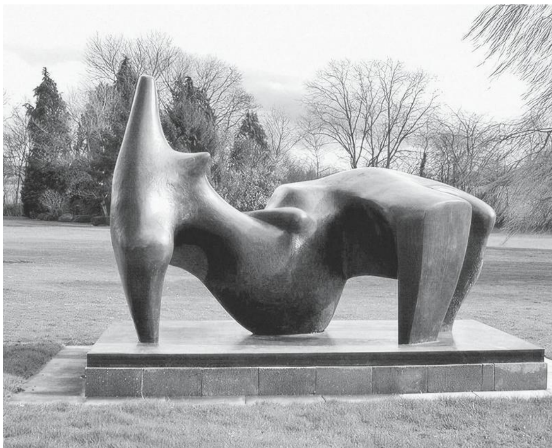
Генри Мур. Лежащая фигура. 1970

Вечером 15 декабря 2005 года трое мужчин украли бронзовую работу великого английского скульптора Генри Мура (1898–1986), рыночная стоимость которой приближается к трем миллионам долларов. «Лежащая фигура» (1970) весом в две тонны и длиной в три с половиной метра была надежно защищена от кражи своими размерами – но так лишь казалось. Скульптуру украли прямо из Фонда Генри Мура в Хертфордшире вблизи Лондона. Как? Преступники заехали на территорию фонда на грузовике со строительным краном, при помощи которого подняли и погрузили скульптуру в машину. После чего они спокойно уехали и исчезли где-то на дорогах Англии.