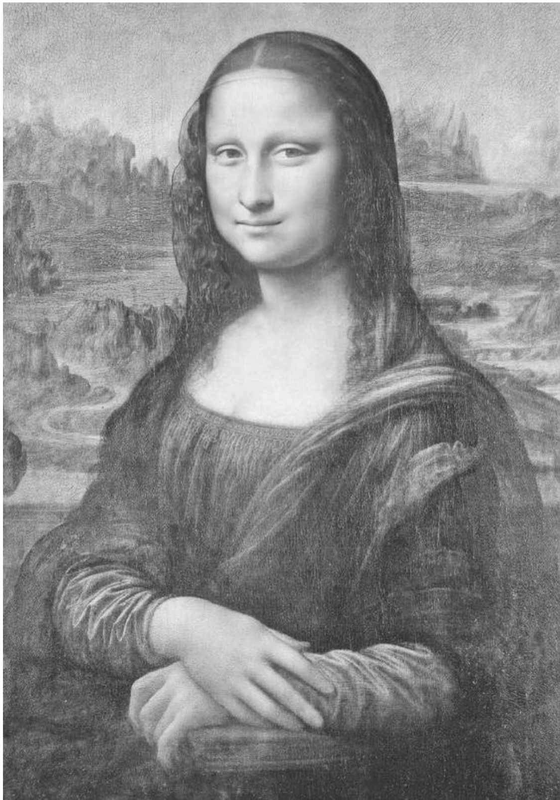
Леонардо да Винчи. Мона Лиза. 1503–1519

долго, постоянно возвращался к ней и повторно утончал мягкие переходы света и тени на лице женщины. Именно здесь магия техники сфумато проявилась наиболее ярко.