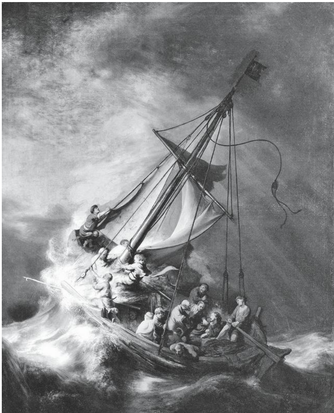
Рембрандт. Христос во время шторма на море Галилейском. 1633

Около трех часов ночи воры ушли. Горе-охранников обнаружили в подвале только в восемь утра, когда пришли их сменщики. Тогда же вызвали уже настоящую полицию. Но стражи порядка не обнаружили никаких улик – грабители забрали с собой записи с камер видеонаблюдения и не оставили отпечатков пальцев. В отличие от кражи «Моны Лизы» это преступление было явно совершено профессионалами своего дела.