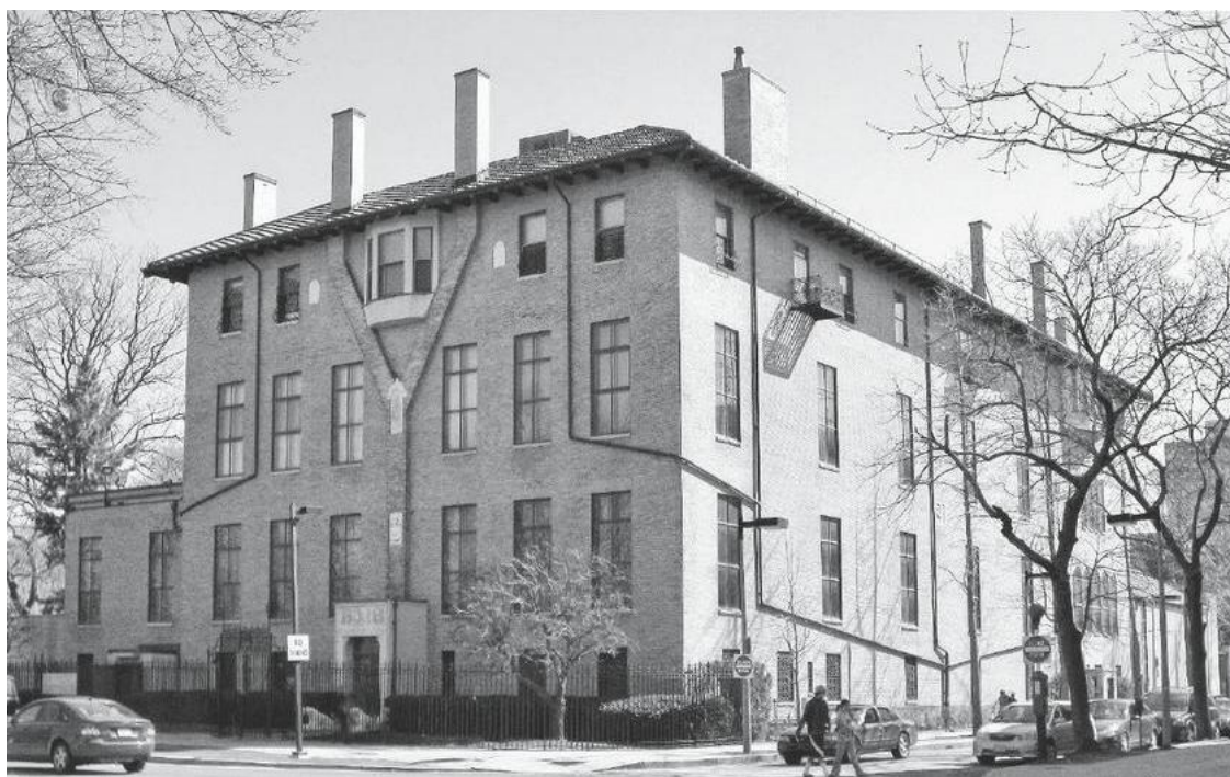
Музей Изабеллы Стюарт Гарднер.

Изабелла Стюарт Гарднер (1840–1924) вместе со своим мужем-миллионером Джеком Гарднером начали собирать произведения искусства в 1880-х годах, но первое время это увлечение носило любительский характер. Как мы привозим из путешествий сувениры, так и супруги Гарднер везли в Бостон предметы искусства. Сначала скорее яркие и необычные, чем ценные, но с 1890-х годов коллекция стала расти бешеными темпами, возрастало и качество. Семейство интересовало не только живопись или скульптура, но и более необычные предметы высокой культурной значимости. Например, в собрании имелся фрагмент оригинального сочинения Чайковского.