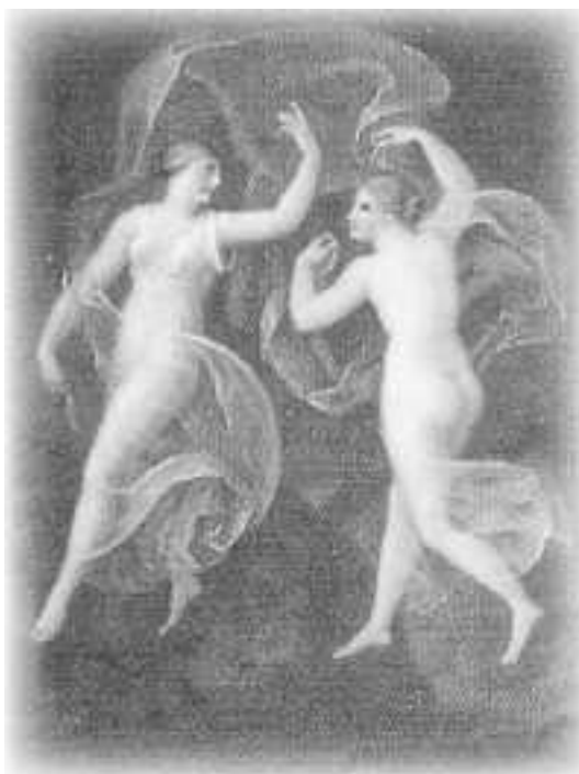
Иоганн Генрих Вильгельм Тишбейн (1751–1829). Две нимфы тумана над речной долиной (из «Ольденбургских идиллий»)

Отважимся же вступить в огромный мир духов. Перед нами открываются новые пространства, временные периоды смещаются и сливаются. Но мы следуем все дальше и дальше, пока наконец не поредает слегка пелена тумана и пробивающийся сквозь нее свет не озарит наш путь. Однажды Гёте писал об этом Шарлотте фон Штайн (1742–1827): «Я молюсь о том, чтобы боги никогда не насылали тени на мой жизненный путь» (22 марта 1781 г.).