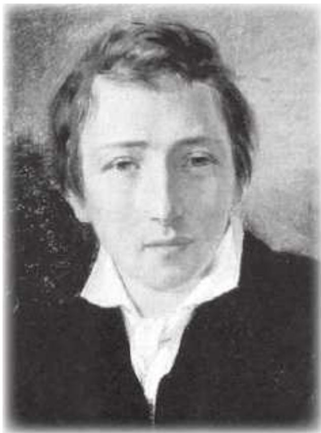
Генрих Гейне (1797–1856)

Якоб Бёме (1575–1624), « philosophus teutonicus » 9 , – выдающийся пример владения этим даром. Ему хватало оловянного сосуда, чтобы «открыть врата рая и ада» (Кернер).