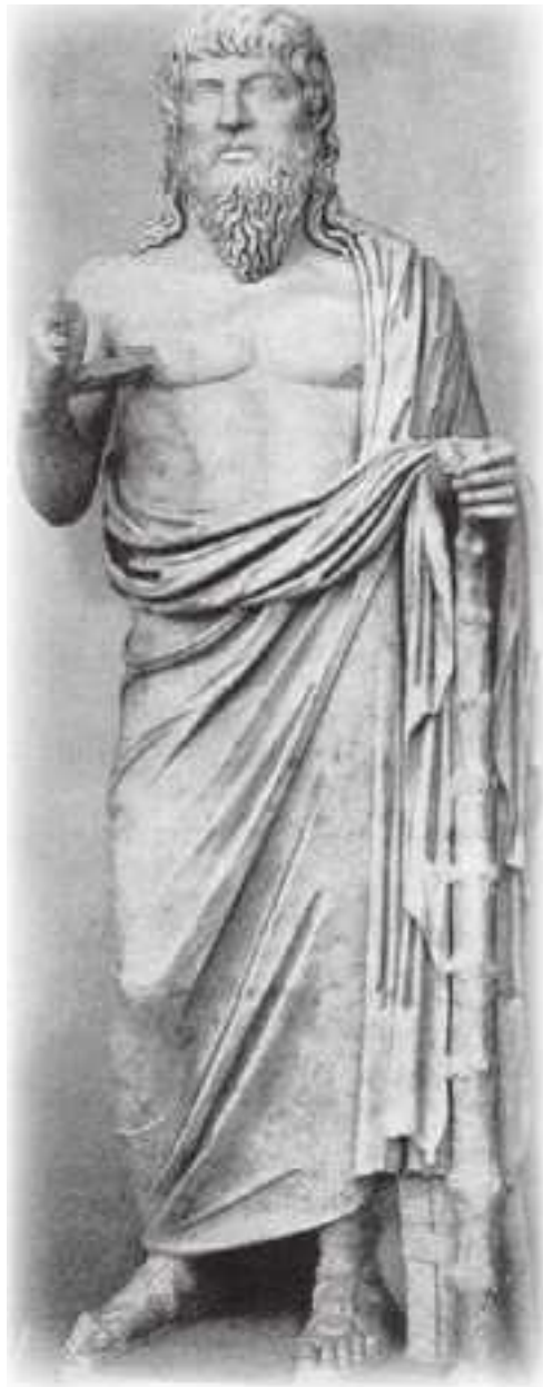
Гераклит Эфесский (ок. 500 г. до н. э.)

Разногласия с миром ведут к отчуждению от него. Вторая стадия истории человечества ознаменована односторонним развитием интеллекта. Утрачивается априорное знание, благодаря которому человек вначале еще чувствовал себя связанным со всем миром, а свойственный ему интерес к тому, «что лежит в его (мира) основе» (Гёте), превращается в любопытство, поднимается до критического переосмысления и сомнений. Аналитическое и практическое расчленение того, что было познано как целостное, ведет к раздробленному восприятию и угасанию чувства персональной ответственности.