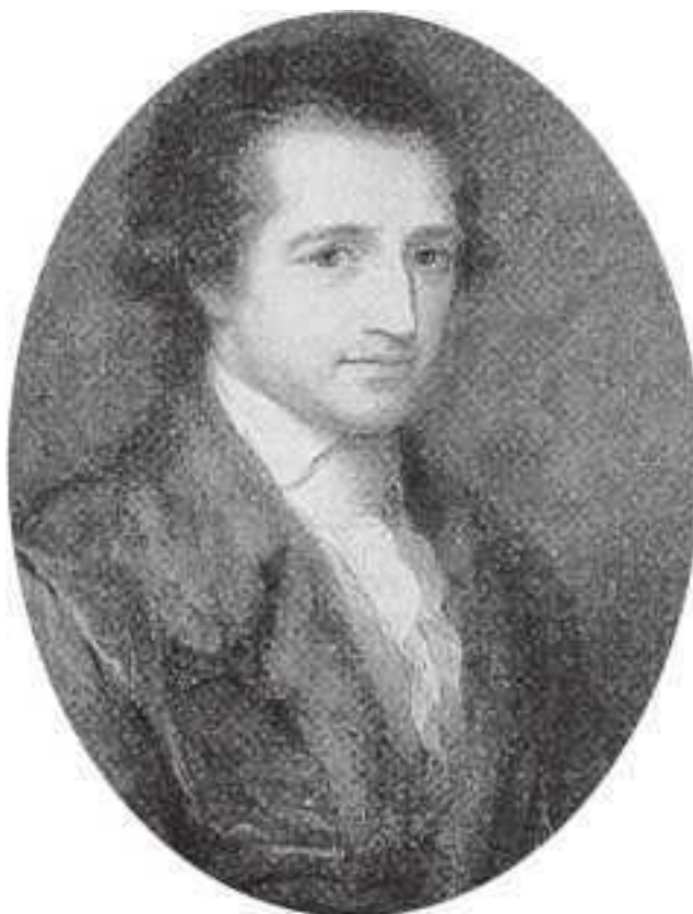
Анжелика Кауфман (1741–1807). Иоганн Вольфганг Гете (1787–1788).

Духи – существа очень древние. Вера в духов и привидения так же стара, как и история человечества. Не менее стар и вопрос, что же такое духи, кто они? Наука безмолвствует, но мы все же приближаемся к разгадке и, может быть, скоро получим ответ, но из других источников.