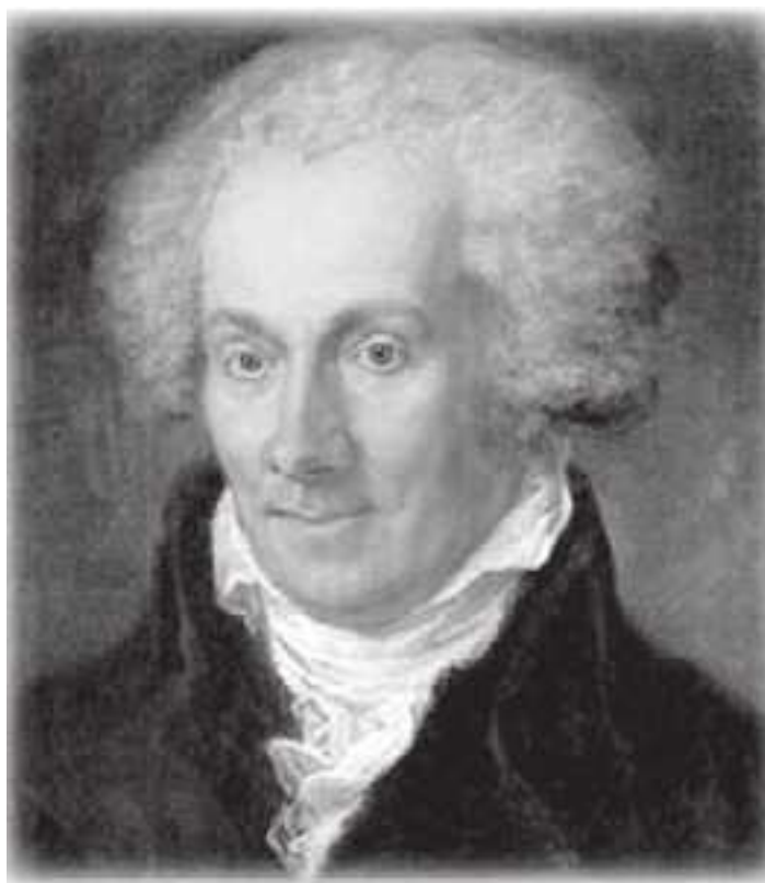
Карл фон Экартсгаузен (1752–1801)

На протяжении истории Европы здесь были написаны тысячи сочинений о духах, только в Германии их минимум две тысячи, а в число авторов кроме Гёте, входят Лютер, Агриппа Неттесгеймский, Парацельс, Меланхтон, Лаватер, Юнг-Штилинг, Экартсгаузен, Мориц, Шиллер, Хорст, Новалис, Гёррес, Брентано, Арним, Кернер, Шопенгауэр, Дросте-Хюльсхоф, Гейне, Даумер, Фехнер, Мёрике, Шторм, Фонтане, Гессе, Юнг, Мозер, Яффе, Авенариус и многие другие.