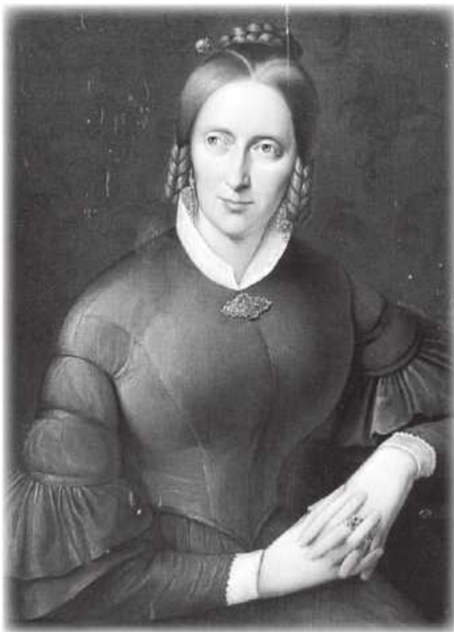
Аннет фон Дросте-Хюльсхоф (1797–1848). 1838

Известно, что предвидение чаще всего случается в лунные ночи. Ясновидящий неожиданно просыпается, что-то влечет его к окну или на улицу, и он волей-неволей видит то, что открывается его «второму зрению», например, похоронные процессии, длинные ряды воинов и сражения, которые произойдут в будущем. Кто не наделен даром ясновидения, стоит рядом с провидцем, и, конечно, ничего такого не видит, лошади же в конюшне чувствуют происходящее и испуганно фыркают, собаки воют, поджимают хвост и жмутся к ногам хозяев. Но «второе зрение» может передаваться тому, кто однажды присутствовал в момент, когда провидцу явились призраки, и наблюдал в это время за ним. Потом он уже сам будет обладать этим даром (см. ниже).