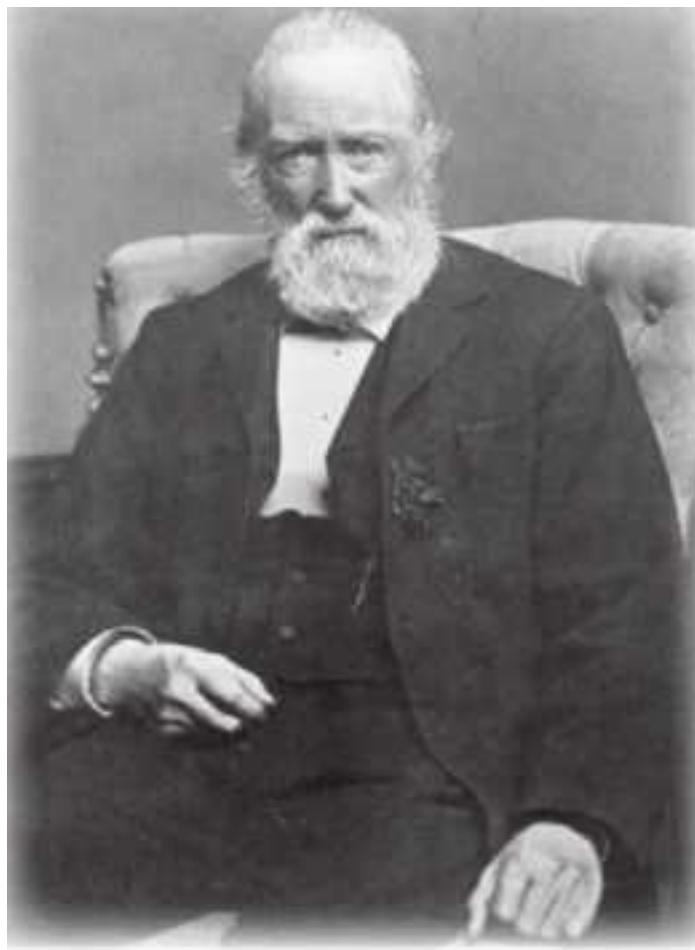
Теодор Шторм (1817–1888)

Я думаю, не стоит и говорить, насколько взволновал меня этот рассказ, ведь он казался мне подтверждением тому, что я видел в доме священника. Однако не желая долгие оставаться во власти виденного, которое могло быть заблуждением или ошибкой, я ничего не рассказал службе о пережитом видении и остался жить в комнате, в которой мне явились призраки. Они больше не посещали меня, и даже воспоминания о них постепенно стирались из памяти. С наступлением зимы, когда в доме уже было слишком холодно, я велел протопить в спальне железную печь, за которой тогда на моих глазах исчезли три видения. Работникам пришлось попотеть, потому что печь нестерпимо дымила и от нее шел ужасный запах. Кузнец, которого вызвали, чтобы осмотреть и починить печь, обнаружил внутри нее, в самом дальнем углу, кости двух маленьких человеческих скелетов. Судя по их размеру, это могли быть скелеты детей, по рассказу службы, живших в доме священника. Я был поражен – находка доказывала истинность видения, которое раньше можно было бы считать обманом чувств. Я отказался от прихода, покинул местечко и вернулся в Кёнигсберг, но след этого происшествия навсегда остался в моей душе.