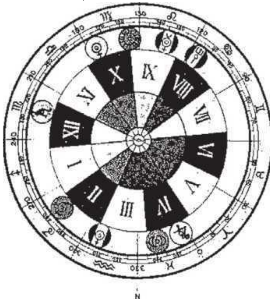
Гороскоп Гёте. 28.08.1749, 12 часов пополудни. Франкфурт-на-Майне