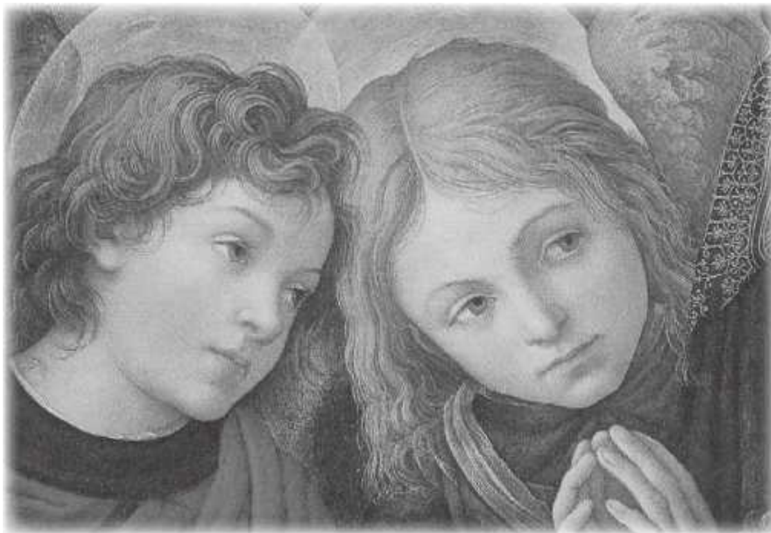
Филиппино Липпи (1757/8-1504). Две ангельские головки

Гете. Письма. Герцогу Карлу Августу, 18 января 1781 г.