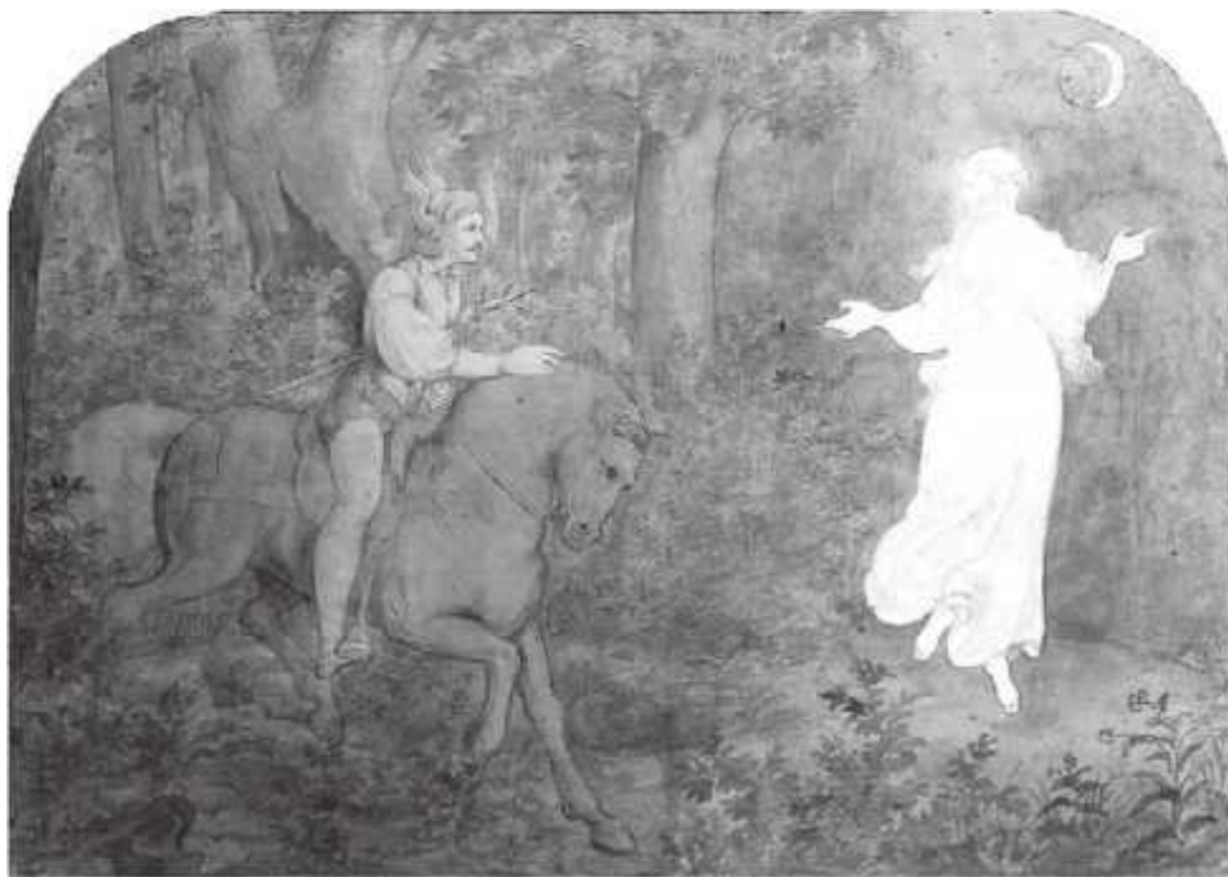
Мориц фон Швинд (1804–1871). Явление в лесу. Ок. 1823

Духи могут дать себя увидеть. Они – настоящий феномен в прямом смысле этого слова, потому что они являются взору изумленного наблюдателя. Греческое слово sphaivorevov (в современном произношении – феноменон) означает «чувственно воспринимаемое», «видимое явление», нечто «явившееся». Так что духов по праву можно называть феноменом. Но видим ли мы их физически, своими глазами или для этого требуется иное, «второе зрение»? За ответом на этот вопрос отправимся с Генрихом Гейне – на дворе 1820 г. – в местность, окутанную покровом тайны: «В Вестфалии, бывшей Саксонии, не все мертво, что похоронено. Прогуливаясь там по древним дубовым рощам, можно еще услышать голоса древности, там еще слышишь отголоски тех глубоких заклинаний, в которых бьет ключом больше жизни, чем во всей литературе марки Бранденбург».