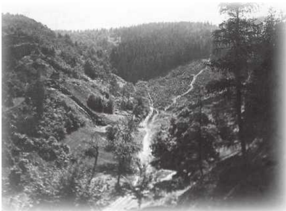
Вид на долину Дюбельсмулен из Хюненбринка, под Неттельштадтом. 1934

Хоть ночь без звезд, совсем темна, Делянка Гротуса видна. И вдруг он видит пламя. Часы давно уж полночь бьют. Дозор лишь мертвецы несут Да совы над горами. Жан в сени дверь с трудом открыл (Амбар пристроен к дому был), И в храмине той жалкой — О, жуть, трясет его озноб В о тьме стоит дубовый гроб, Там, под седьмою балкой.