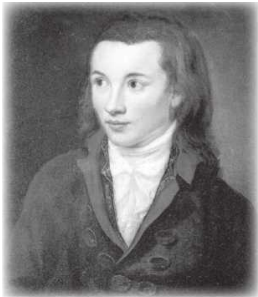
Франц Гарейс Новалис (Фридрих фон Харденберг, 1772–1801). Единственный сохранившийся портрет

Третья стадия очевидна. В эпоху, когда процветают узкие специалисты, ускоряется разрушение уже нецелостной природы, а человек одинок и живет изолированно, мы жаждем вновь объединиться и с Единым Богом, и с небесным миром. Восстановление разрушенной целостности проявляется на всех уровнях – как в масштабе всего человечества, так и в масштабе отдельной жизни. И на ум приходят воспоминания Новалиса о Золотом веке: