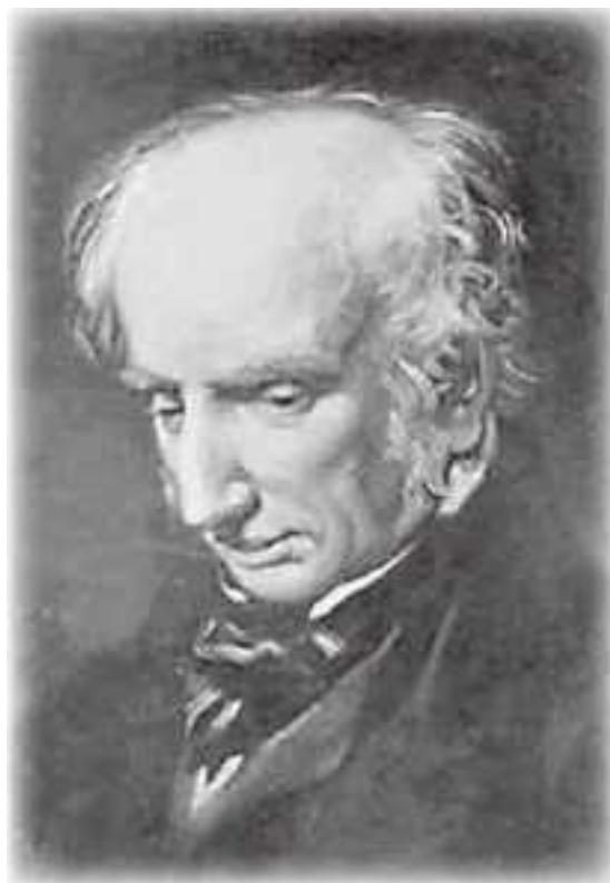
Уильям Вордсворт (1770–1850)

Вордсворт. Отголоски бессмертия по воспоминаниям раннего детства 5