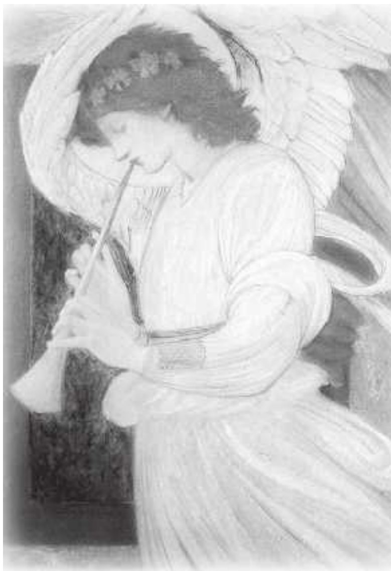
Сэр Эдвард Берн-Джонс (1833–1898). Ангел, играющий на флейте

ее с новой перспективы, и все сумасшедшее может возвратиться на свое место. Дистанция открывает нам глаза, и мы снова становимся хозяевами жизни. Именно это происходит при внетелесных переживаниях, когда мы можем увидеть себя из внешней перспективы, но при этом возникает вопрос: кто же здесь дух – мое новое Я, только что сбросившее с себя кожу, или покинутая, пустая телесная оболочка? После подобного внетелесного опыта многие люди преображаются и могут постичь смысл жизни. Они чувствуют ее наполненность – и счастливы.