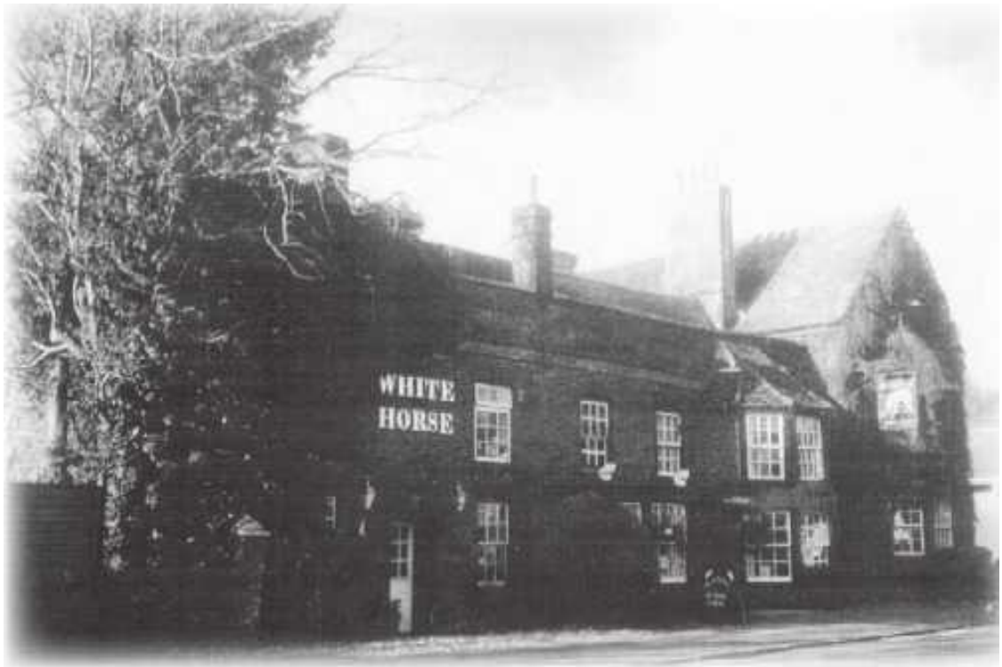
Дом с привидениями в Англии. Паб «Белая лошадь» в Сент-Никсе. 1998

В сентябре 1996 года я отправилась в литературное путешествие, начав свой долгий путь в Берлине. Затем я посетила Вольфенбюттель, Веймар, замок Обервидерштедт, Мюнхен, Шпейер, Трир, Юберлинген, монастырь Бойрон, Инсбрук, Вену, монастырь в Мельке, Фрейбург, Геттинген, Иену, Халле, добравшись в заключение до Лондона, Гётеборга и Стокгольма. В этой поездке я познакомилась с тысячами забытых, пока еще не изученных книг о духах.