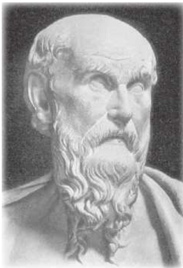
Гесиод (?) (ок. VIII в. до н. э.). Копия эпохи Клавдия с бронзовой статуи ок. 200 до н. э.

Начать эту книгу я бы хотела фразой, которой Аниела Яффе в 1958 г. закончила свой труд «Явления духов и предзнаменования»: такие феномены приближают нас к «ощущению единства бытия». Они символически связывают потусторонний мир и мир реальный, невидимое и видимое, нематериальное и материальное, синхронное и асинхронное, мнимое и явное, подсознательное и сознательное и придают нашему миру, ограниченному тремя измерениями, – по словам Карла Густава Юнга, «системе ящичков» – осмысленную завершенность (Юнг, 1985). Стремление постичь мир как единое целое, дойти до его сути, было свойственно человеку всегда, равно как и знание о том, что скрытое от глаз ( occultum на латыни), паранормальное, существующее наряду с обычным, привычным, является составной частью жизни, как бы ни противился рассудок человека этой истине. Человек по своей природе – существо, тесно связанное с миром, который он воспринимает как единое целое, а себя – его неотъемлемой частью. В детстве такая связь еще не нарушена, человек с доверием воспринимает мир, и это чувство – дар его Творца.