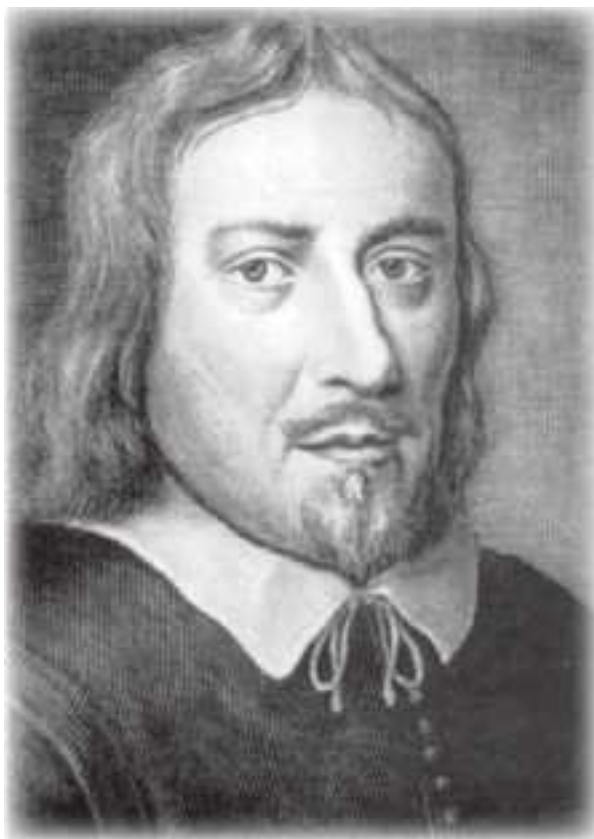
П. Гунст. Якоб Бёме (1575–1624), немецкий философ и мистик. XVII в.

Двухтомное издание Хорста «Дейтероскопия» (1830) дает самое полное представление о «втором зрении» в Германии, также по этой теме можно найти более новые работы Цур Вонзена (1907 и 1920) и Шмаинга (1954), а в книге «Описание западных островов Шотландии» ( A Description of the Western Islands of Scotland , ok. 1695) Мартин Мартин рассказывает о «втором зрении» на Гебридских островах (по-ирландски Taish ). Истории на эту тему, как в Германии, так и в Шотландии содержали одновременно и символику, и нечто конкретное. Если в