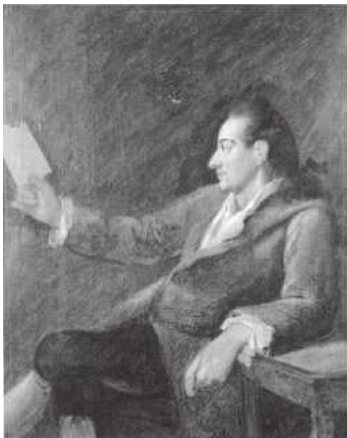
Гёте в возрасте 26–27 лет. Георг Мельхиор Краус (1737–1806). И. В. Гёте. 1775–1776.

Хотя далеко не все признают существование духов, многие вступали с ними в какие-то отношения. Но как? Есть множество способов повстречаться с духами, и для этого необязательно быть душевнобольным или сумасшедшим. Можно ли воспринять духов органами чувств или же они лишь плод чьего-то воображения? Являются ли они внечувственными или сверхчувственными созданиями? В этой главе описаны разные варианты восприятия духов, так что читатель может сам поразмышлять о том, какую роль играют чувства при встрече с ними. А есть ли в явлении духов какой-то смысл или же это лишь пустые, бессмысленные существа? Об этом будет сказано в самом конце книги (гл. IX, 6).