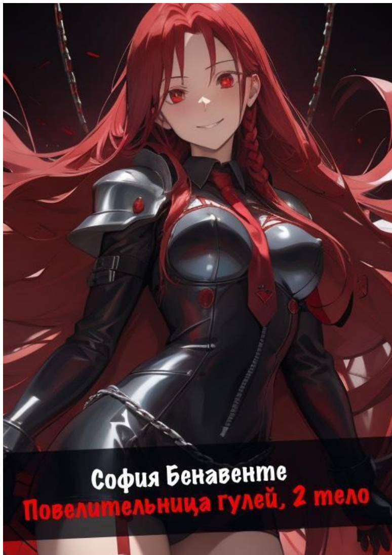
София Бенавенте Повелительница гулей, 2 тело