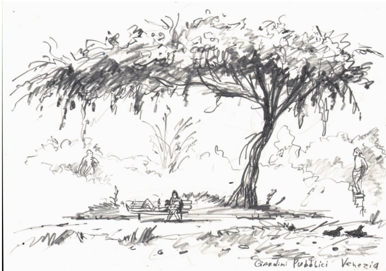
Giardini Pubblici Venezia