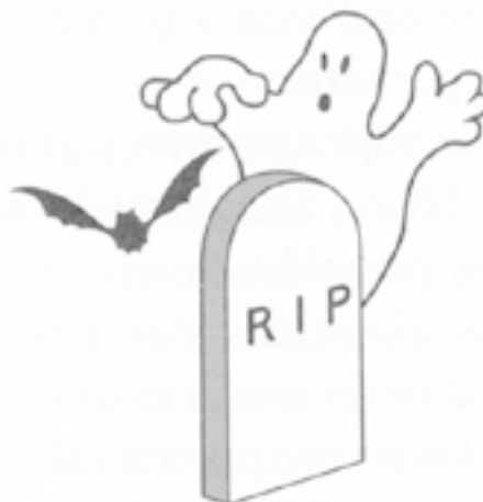
Привидение над кладбищенским памятником

Сущности, связанные с загробной жизнью, – это разумные силы с одной дополнительной особенностью: они существуют одновременно в этом мире и в загробном. В их число могли бы входить реинкарнированные души, а также привидения и некоторые духи. Наличие подобных сущностей позволяет устанавливать связь с умершими.