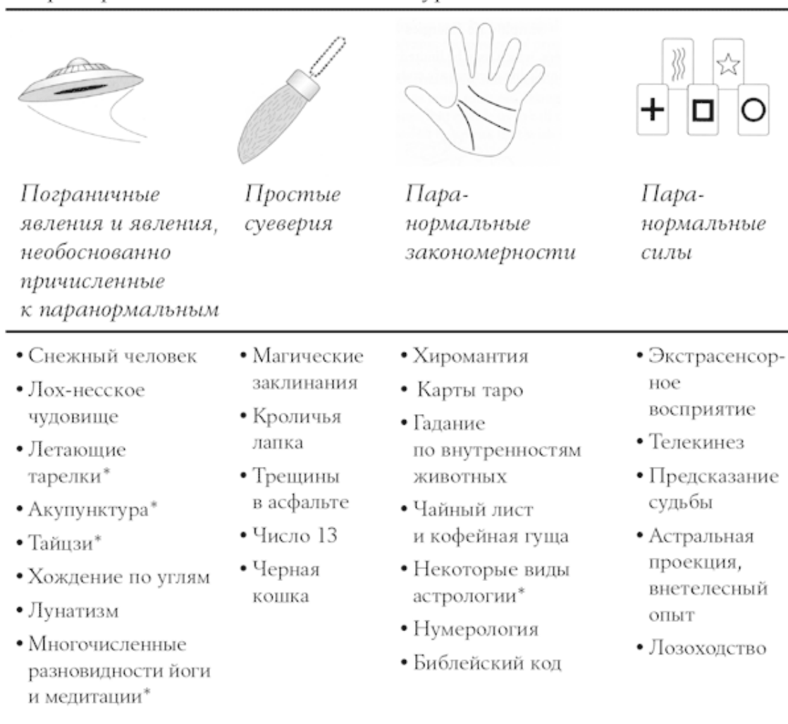
Таблица 1.1 Continuum Mysteriosum

* Многие паранормальные явления могут быть представлены в нескольких вариантах и классифицироваться по-разному. К примеру, утверждение о том, что акупунктура вызывает выработку в мозгу эндорфинов, не является паранормальным. Неопределенное утверждение о том, что акупунктура активирует туманную энергию тела, можно классифицировать как утверждение о простой энергии. Утверждение о том, что расположение звезд в момент рождения человека содержит информацию о его личности и будущем, относится к паранормальным закономерностям. Однако если говорится, что звезды обладают некой таинственной силой, способной повлиять на земную жизнь, то здесь речь идет уже о паранормальной энергии.