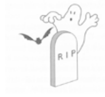
Сущности, связанные с загробной жизнью