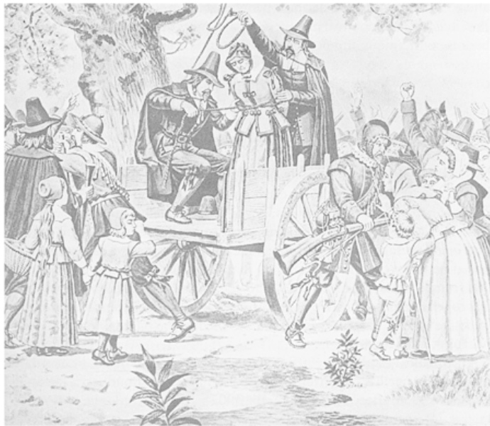
Рис. 2.3. Салемские процессы над ведьмами (повешение ведьмы — Бриджит Бишоп)