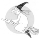
Разумные силы и сущности