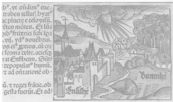
Рис. 2.1. Энзисхеймский метеорит

ме услышал в ясный день удар грома и увидел, как с неба на пшеничное поле упал камень. Он рассказал взрослым об упавшем камне, и вскоре возбужденная толпа начала откалывать кусочки от присланной Богом реликвии. Максимилиан I, король Австрии, решил, что это послание Господа предвещает ему победу в войне с французами. (И действительно, австрийцы победили.) Вера короля очень типична. На протяжении тысячелетий люди верили, что метеориты падают с небес и являются знаками Господа. Этим представлениям суждено было измениться лишь через триста лет после Энзисхеймского метеорита – во времена американской Войны за независимость.