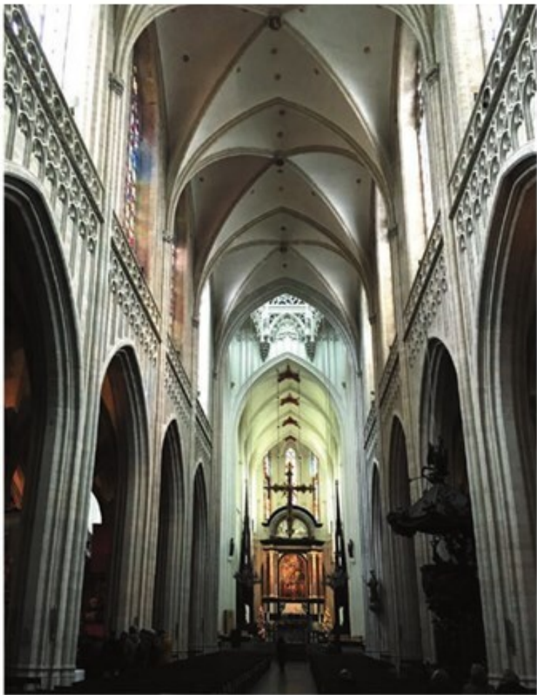
Собор Богоматери в Антверпене. Главный неф.