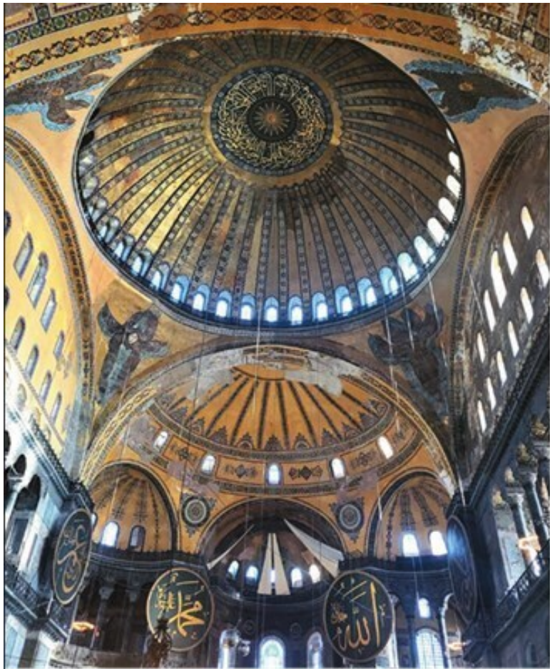
Собор Св. Софии, внутреннее пространство. Константинополь (Стамбул)