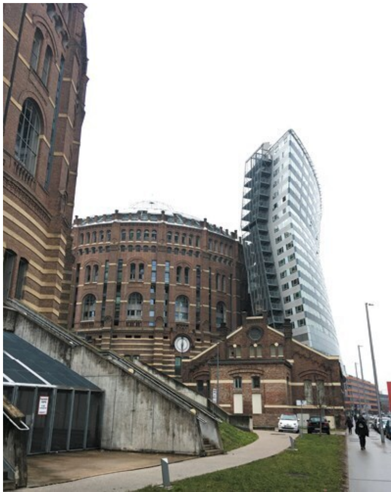
Газометр В. Австрия. Реконструкция Соор Himmelb(l)au 1999–2001 гг.