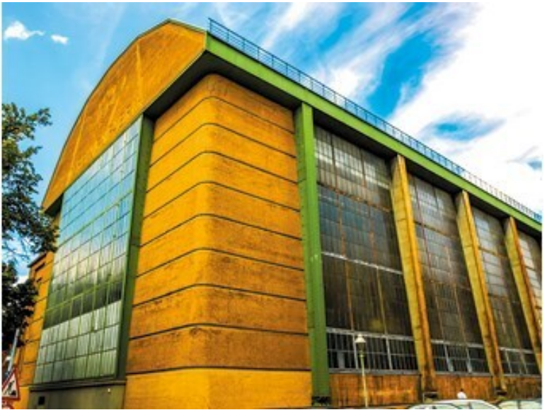
Завод электротехнического концерна АЕГ. Берлин. Германия Архитектор Петер Беренс 1909 г.