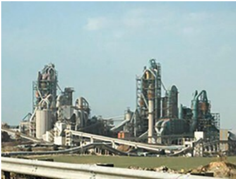
Цементный завод в Рамле. Израиль

Два завода – один с линейным конвейерным производством, другой с большим количеством параллельных процессов, в которых идёт смешивание и перемешивание. Не перепутаете?