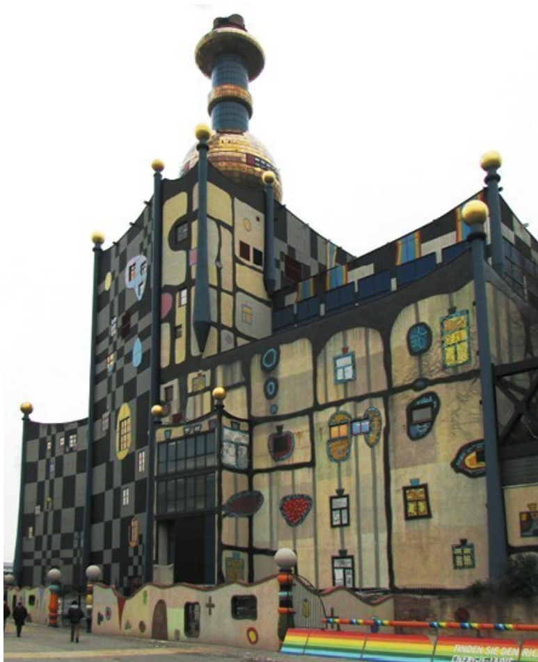
Мусоросжигательный завод в Шпитлау, Вена.