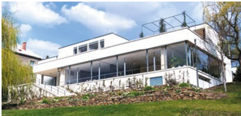
Вилла Тугендат, Брно, Чехия.

Архитектор Андреа Палладио. Виченца XVI век