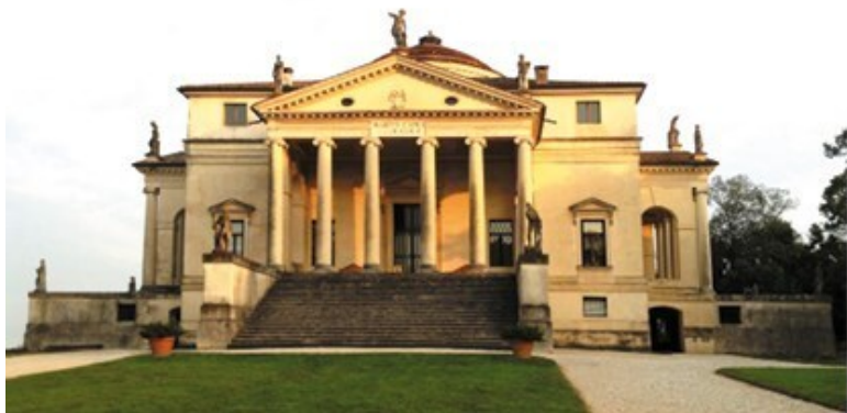
Вилла Ротонда. Италия.

Архитектор Андреа Палладио. Виченца XVI век