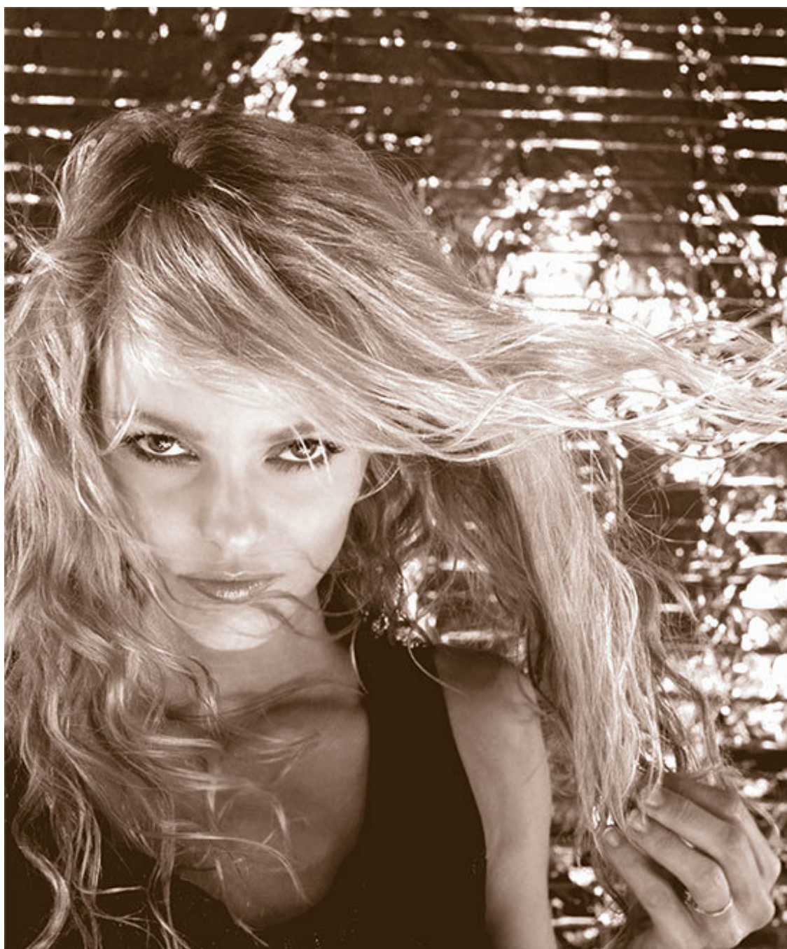
Талантливая француженка Ванесса Паради

Похоже, что на вдохновение Паради влияют и условия, в которых она живет. Актриса с детьми переехала в Лос-Анджелес (уже после расставания Джонни Депп купил бывшей жене дом в Голливуде на Малхолланд-Драйв, за 4,4 млн. долларов) и все еще скучает по Франции.