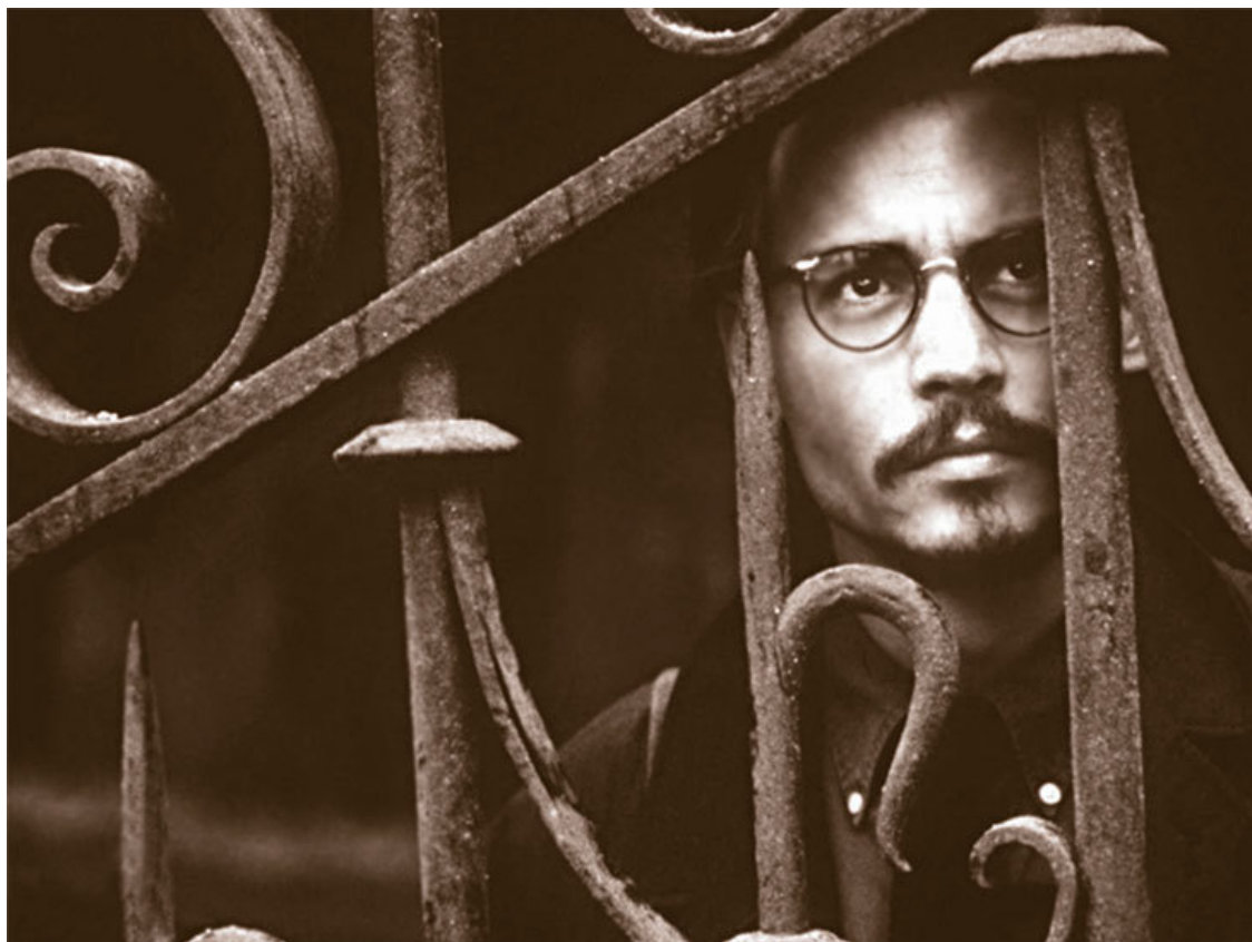
Кадр из фильма «Девятые врата»

...Ужиная с коллегами по съемочной площадке в одном укромном парижском местечке (отеле «Косте», Hotel Costes на площади Rue Saint-Honoré на правом берегу Сены), Джонни вдруг ощутил на себе долгий взгляд девушки, сидящей за барной стойкой. Она говорила волнующим, хрипловатым голосом, изящно курила и напоминала своей утонченностью волшебную фею.