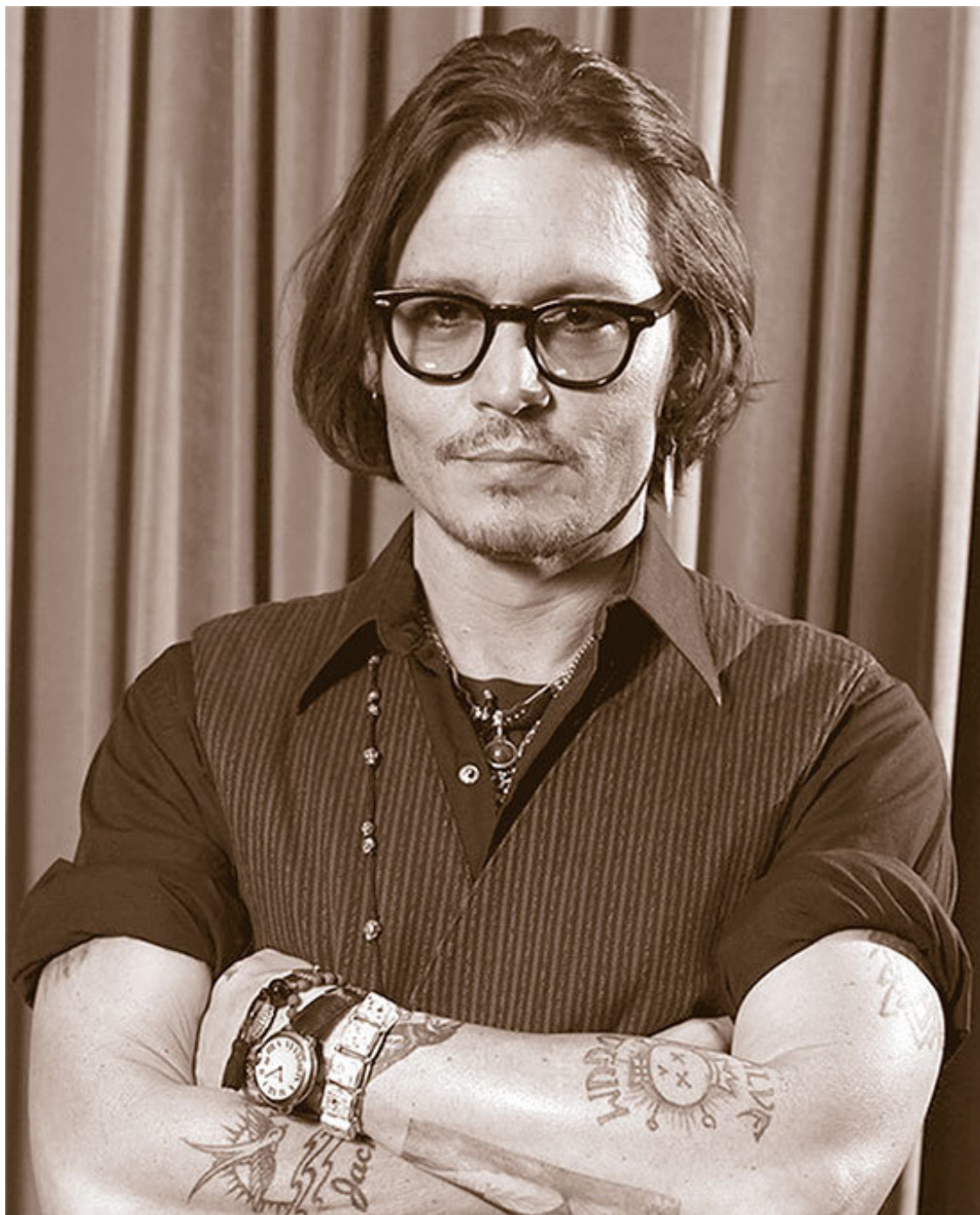
Голливудский красавчик и покоритель женских сердец Джонни Депп

В одном из недавних интервью Паради намекнула, что каждая песня, вошедшая в альбом, – это ее жизнь, ее любовь, ее собственные, временами очень личные переживания: