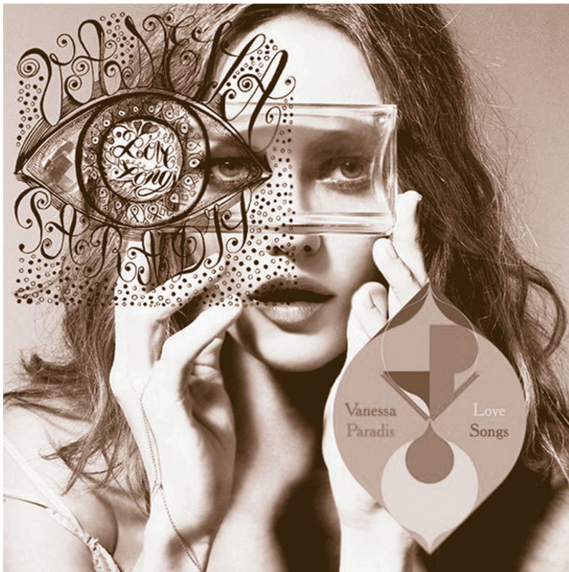
Романтический и светлый альбом «Песни о любви»