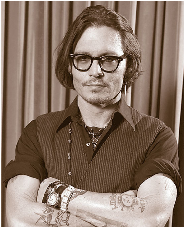
Голливудский красавчик и покоритель женских сердец Джонни Депп