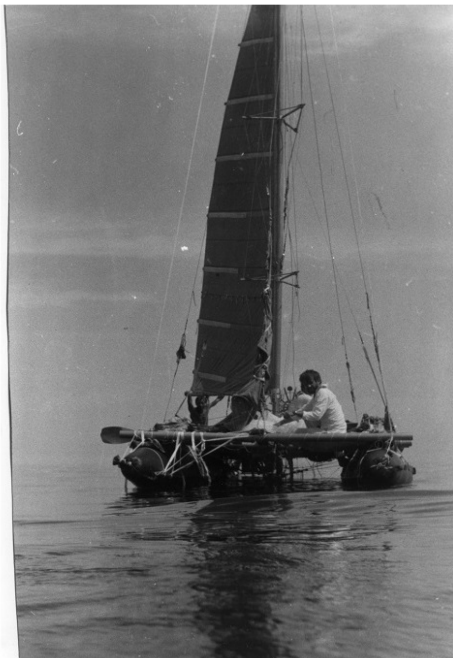
На Каспии штиль.

Место нахождения определялось как пересечение линий направленных на пеленгуемые радиостанции.