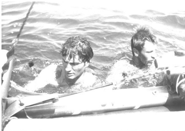
Ремонт в пути во время штиля.

На второй день у них вышла из строя радиостанция, и они после этого место определяли по одному приемнику, не имея возможности дублировать определение по другим.