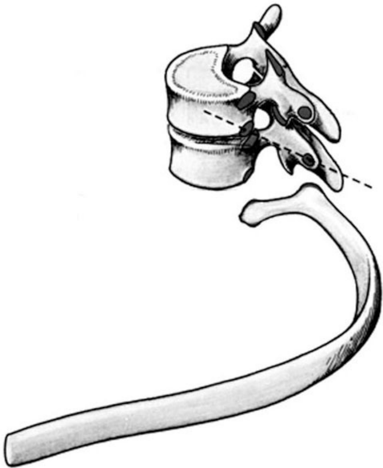
Рис. 2. Грудной позвонок