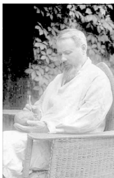
Скульптор Николай Андреевич Андреев