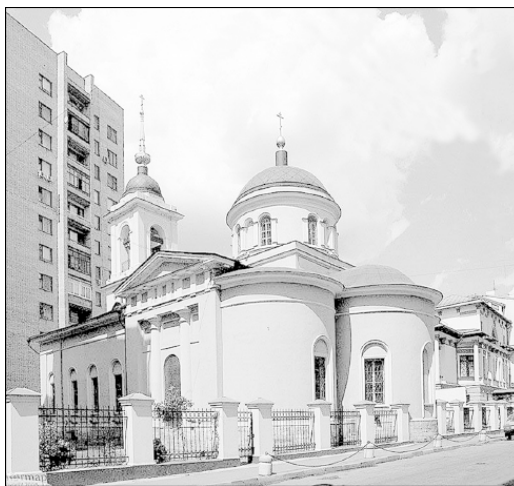
Церковь свв. Афанасия и Кирилла

Из-за бездумного, безразличного отношения к нашему наследию этот некогда один из самых поэтических уголков Москвы неузнаваемо изменился.