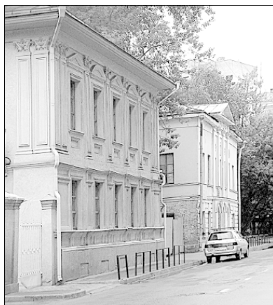
Большой Афанасьевский переулок, дома № 7 и 9