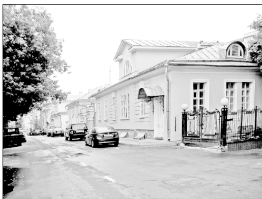
Большой Афанасьевский переулок, дома № 8 и 12

Напротив – два замечательных литературных мемориальных памятника. Один из них – одноэтажный с мезонином домик (№ 8, законченный постройкой, как сказано в архивном документе, 28 июня 1818 г.), к которому были сделаны пристройки в 1884 г. и, вероятно, тогда же изменен фасад. Здесь в 1920-х гг. жил Н.К. фон Мекк, погибший в застенках Лубянки. Он был сыном той самой Надежды Филаретовны, прославившейся поддержкой в течение многих лет П.И. Чайковского. Н.К. фон Мекк стал председателем правления Московско-Казанской железной дороги, был женат на племяннице Чайковского А.Л. Давыдовой. Его арестовали вместе с многими техническими интеллигентами, которым приписали образование так называемой Промпартии. Это был один из первых политических процессов, инсценированных Сталиным. Почти всех участников процесса расстреляли.