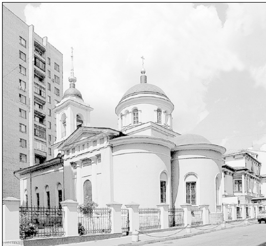
Церковь свв. Афанасия и Кирилла

Большой и Малый Афанасьевские переулки. Оба этих переулка называются по церкви святых Афанасия и Кирилла, здание которой находится по Большому Афанасьевскому ближе к перекрестку с Сивцевым Вражком. С 1960 по 1994 г. Большой назывался улицей Мясковского (композитора, жившего неподалеку), а Малый как-то сохранил свое старое имя. Большой назывался также Ушаковским, а часть его – от Гагаринского переулка до Сивцева Вражка – Юшковым – по фамилии домовладельцев. Большой Афанасьевский протягивается более чем на 700 метров от Гагаринского переулка до Арбата – это один из самых длинных здесь переулков. Он значительно изменил свой облик. Еще в 1948 г.