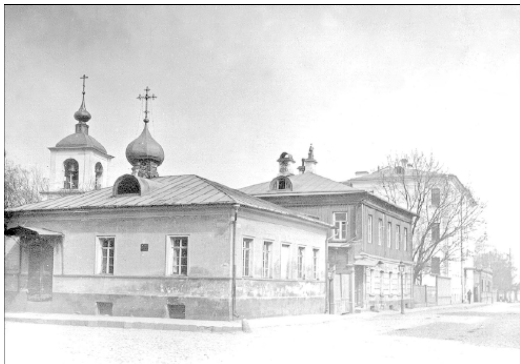
Власьевский Большой и Гагаринский переулки. Фото 1913 г.

В 1921 г. устроили придельный храм Серафима Саровского, переведенный из дома № 21 по Сивцеву Вражку.