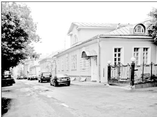
Большой Афанасьевский переулок, дома № 8 и 12