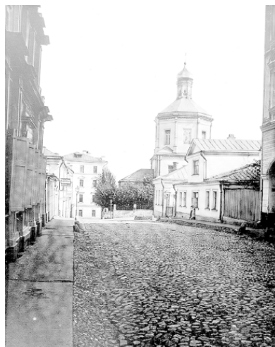
1-й Ильинский переулок. Церковь Ильи Обиденного близ Остоженки. 1913 г.