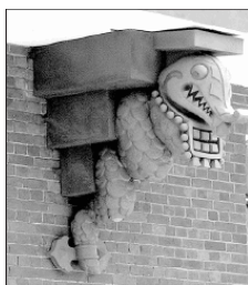
Дом Перцова. Деталь

«Подвал был обставлен скромно, но уютно, – вспоминал артист Н.Ф. Монахов. – Скромная буфетная стойка с простыми вкусными домашними закусками. Маленькая сцена, на которой артисты Художественного театра изощрялись в показе различных «самодеятельных» номеров. В кабаре я впервые увидел великого Станиславского, который показывал на сцене фокусы». Как писали тогда, «каждый спускавшийся под свод оставлял в прихожей, вместе с калошами, печаль, снимал с себя вместе с пальто и заботы».