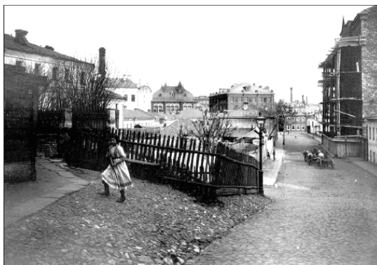
2-й Ильинский переулоч от церкви Ильи Обыденного в сторону Остоженки. 1913 г.

Недалеко от стены Белого города, подхотившей к Москве-реке, напротив его башни, украшенной семью шатрами, стояла маленькая деревянная Ильинская «обыденская» церковка, построенная «обыдень» – в один день, по обещанию, обету. Возможно, что впервые она появилась тут в конце XV или в XVI в. – в ризнице храма находился синодик, составленный между 1589 и 1607 гг. В 1612 г., в год победы русского ополчения над польско-литовскими интервентами, недалеко от этих мест, у Арбатских ворот, находились главные силы русского ополчения под командованием Дмитрия Пожарского и его соратников. Перед решающим сражением 24 августа, разгоревшимся в Замоскворечье, ополчение было передвинуто к берегу Москвы-реки, а сам «князь Дмитрий же Михайлович с своей стороны ста у Москвы-реки, у Ильи пророка Обыденного».