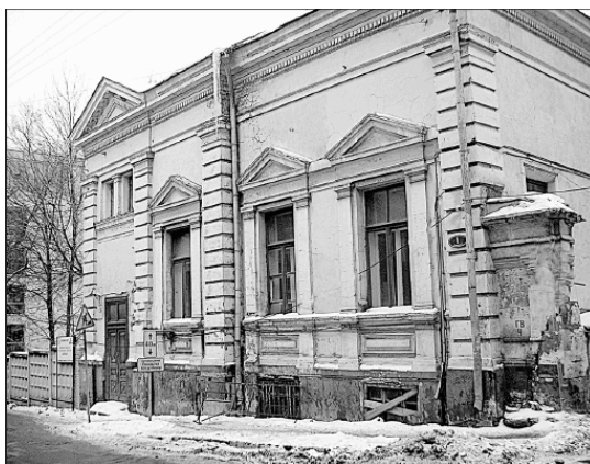
Коробейников переулок, дом № 1

1-й Зачатьевский переулочек в 1962 г. был переименован в улицу Дмитриевского в память героя войны, молодого лейтенанта, командира танковой роты, погибшего уже почти в самом конце войны, 11 марта 1945 г. (он жил в Курсовом переулке, д. 12 – вот здесь и надо было бы поставить мемориальную доску герою). В 1992 г. возвратили исконное название этого переулочка, как и еще двух, произошедших от Зачатьевского монастыря, находящегося в квартале между 2-м и 3-м Зачатьевскими, Молочным и Коробейниковым переулочками.