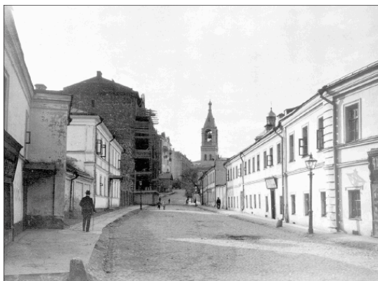
2-й Ильинский переулок к церкви Ильи Обыденного. 1913 г.