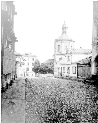
1-й Ильинский переулоч. Церковь Ильи Обиденного близ Остоженки. 1913 г.