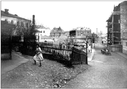
2-й Ильинский переулок от церкви Ильи Обыденного в сторону Остоженки. 1913 г.

Отсюда он в опасный момент послал Минина на гетмана Ходкевича, пытавшегося пробиться к осажденным полякам в Кремле: «...Козьма задумал сам ударить на врагов, пришел к кн. Пожарскому и стал просить людей. „Бери, кого хочешь!“ – ответил князь. Козьма взял роту Хмелевскаго да дворян три сотни. На том берегу, у Крымского двора (церковь Иоанна Воина), стояли две гетманские роты, конная и пешая. Козьма, переправясь за реку, с великою прыткостью ударил впрямь на эти роты. Они, не дождавшись еще дела, дрогнули и побежали, конные потоптали пеших. Козьма еще прытче погнал за ними. Тогда засевшие в ямах и крапивах наши ратные, услыша крики битвы и увидя, что Козьма с великим стремлением гонит Поляков, и все, в один час, ото