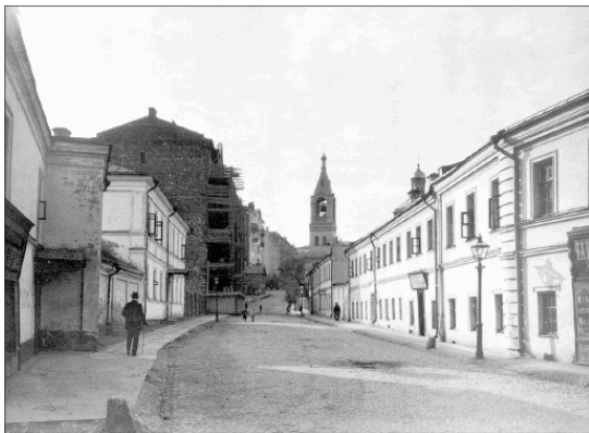
2-й Ильинский переулок к церкви Ильи Обыденного. 1913 г.