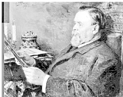
В.Е. Маковский. Иван Евменьевич Цветков. 1907 г.

енный в 1897 г. архитектором К.Ф. Буровым. Рядом – похожий на него, также с рустом и башенкой, – особняк, выстроенный для себя «классным художником», архитектором И.А. Мазуриным в 1886 г.; за ним, также несколько в глубине от набережной, – краснокирпичное здание (№ 33) с готическими деталями, занятое сейчас посольством Мадагаскара. Оно построено в 1896 г., как ни странно это может показаться, для нужд Сандуновских бань. Тогда владелица задумала их коренную перестройку, и на Неглинной по проекту Б.В. Фрейденберга выросло импозантное здание для магазинов, квартир и бань, а здесь, на берегу Москвы-реки, устроена водокачка, снабжавшая бани. Вот этот-то дом и был построен для нее тем же архитектором. Слева размещались паровые котлы, справа внизу стояли машины, а наверху были жилые комнаты обслуживающего персонала.