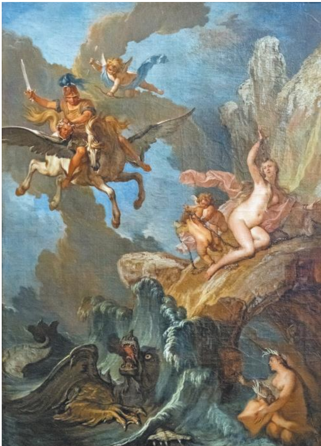
Н. Бертин. Персей и Андромеда. 1-я четв. XVIII в.

Персей – древнегреческий победитель Горгоны и чудовищ – типичный архетип героя