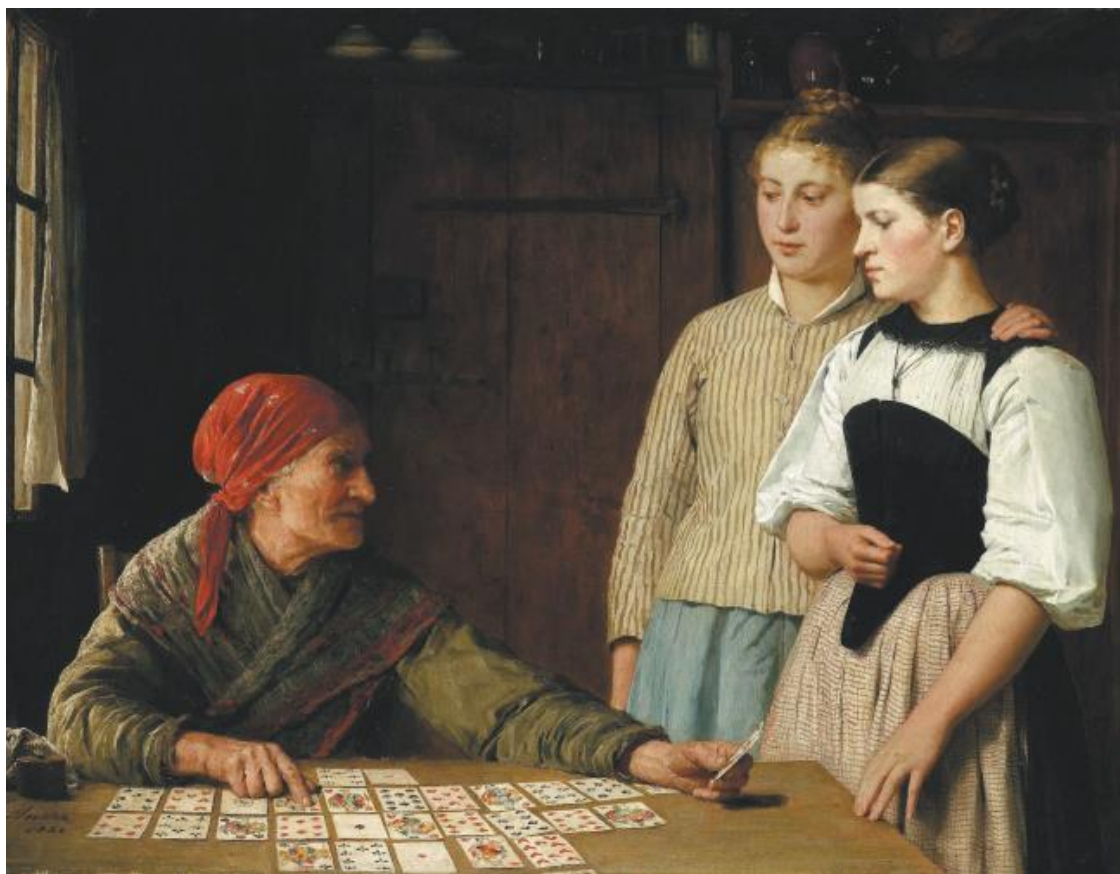
А. Анкер. Предсказание будущего. 1880 г.

ные и две красные масти. Причем есть версия, что мечи трансформировались в пики, монеты – в бубны, палицы – в трефы, а кубки – в червы. Постепенно закрепились такие элементы колоды, как Туз, Король, Дама, Валет; числовые карты получили обозначения от 2 до 10. Были также карты без обозначения мастей – видимо, там имело значение только «старшинство». Джокеры, или Шуты, которые во многих играх могут заменять собой любую карту, скорее всего, появились в колодах достаточно поздно.