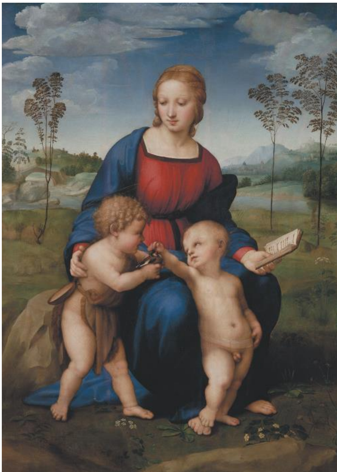
Рафаэль. Мадонна со щеглом. 1505–1506 гг.

Впрочем, мы уже слишком глубоко забрались на территорию сугубо эзотерическую. Остановимся пока на том, что в классическом искусстве – скажем, в живописи – архетипы, ассоциации и символы также играют огромную роль. Например, почему младенца Иисуса на картинах часто сопровождает птичка-щегол? Это известный символ: ярко-красные щечки щегла – намек на кровь, которую Спасителю предстоит пролить ради спасения человечества. А почему Георгия Победоносца, победителя дракона, обычно изображают восседающим на