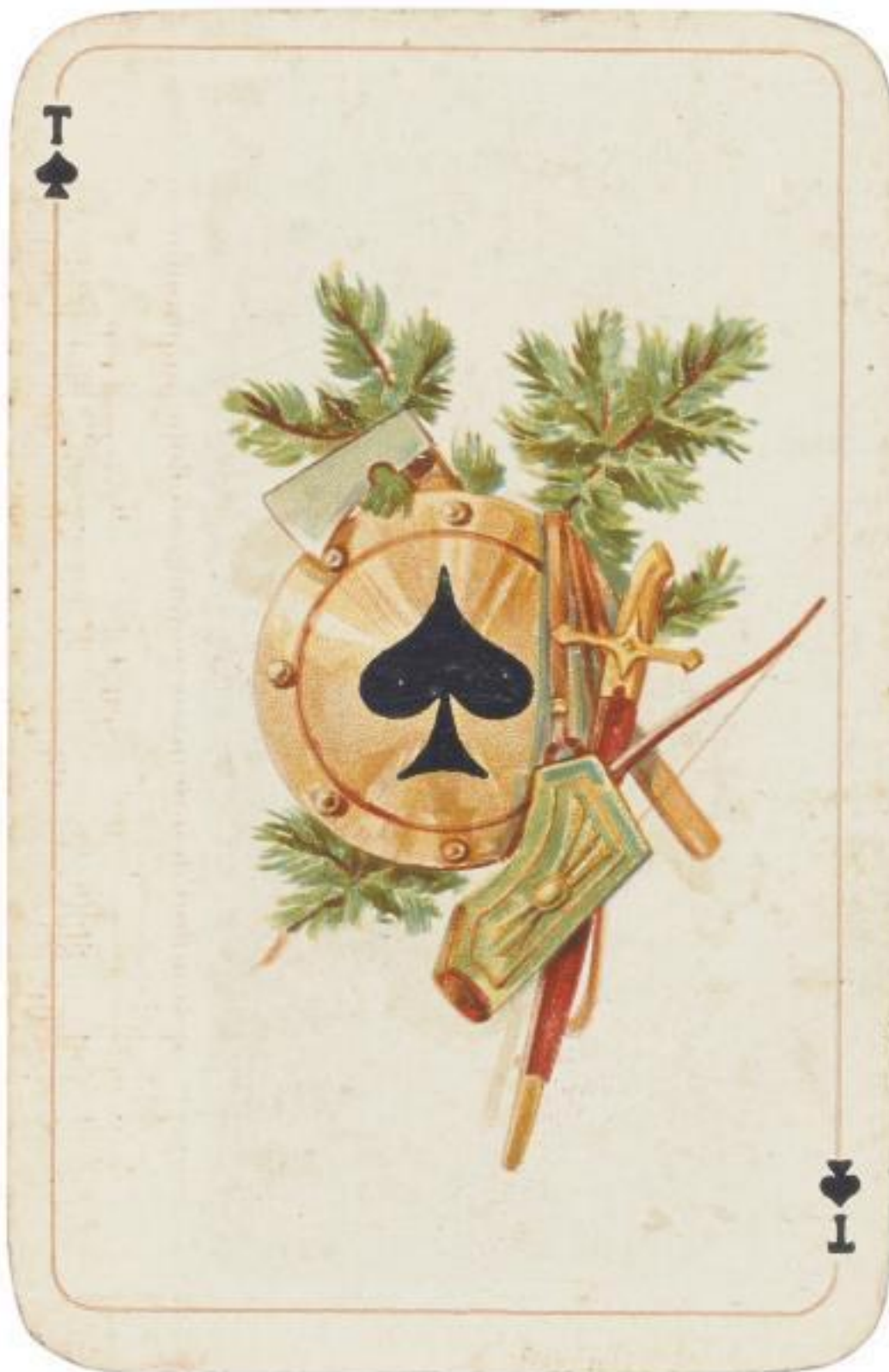
Туз пик из колоды Русский стиль. 1911

Занимаясь предсказаниями с помощью Таро, гадалка тоже включает прямые ассоциации. Например, при составлении прогноза для определенной личности выпавшая карта Император характеризует эту личность как весьма сильную, харизматичную и обладающую огромным потенциалом. И в то же время такая трактовка будет выглядеть очень упрощенной и