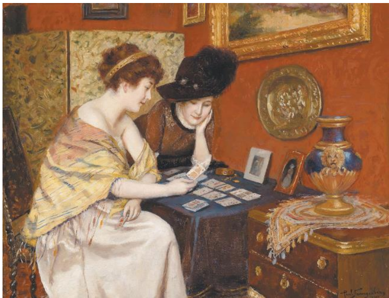
П. Спангенберг. Что означает карта? 1911 г.