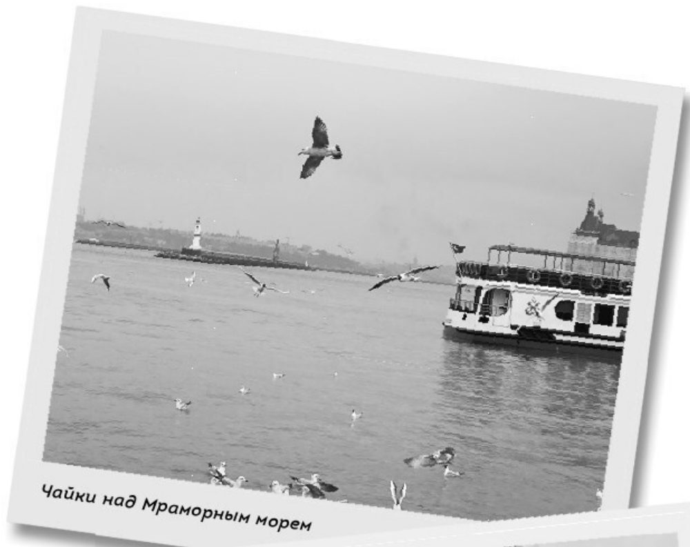
Чайки над Мраморным морем