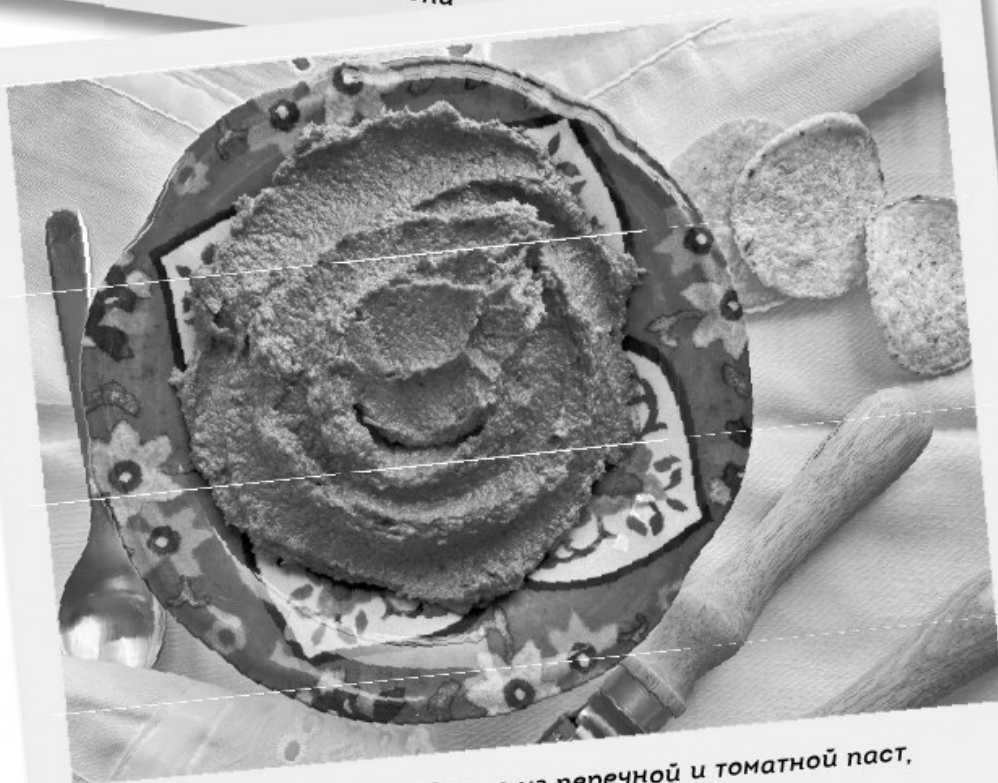
Традиционная утренняя аджука из перечной и томатной паст, грецких орехов и специй