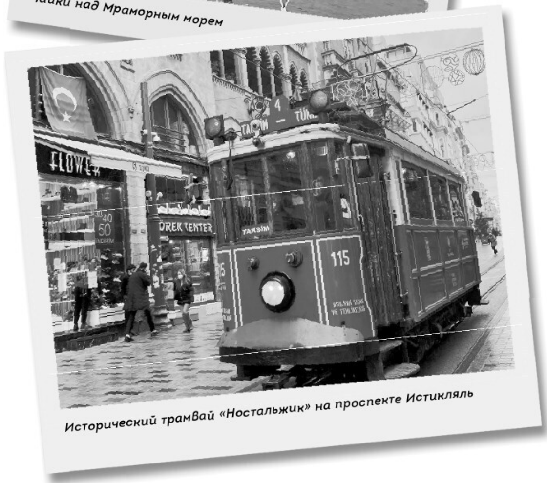
Исторический трамвай «Ностальжик» на проспекте Истикляль

Начало осени, которую вот уже третий год подряд я неизменно провожу в Стамбуле, приправлено шепоткой золотой куркумы и присыпано жменей бледной сушеной мяты. Эти