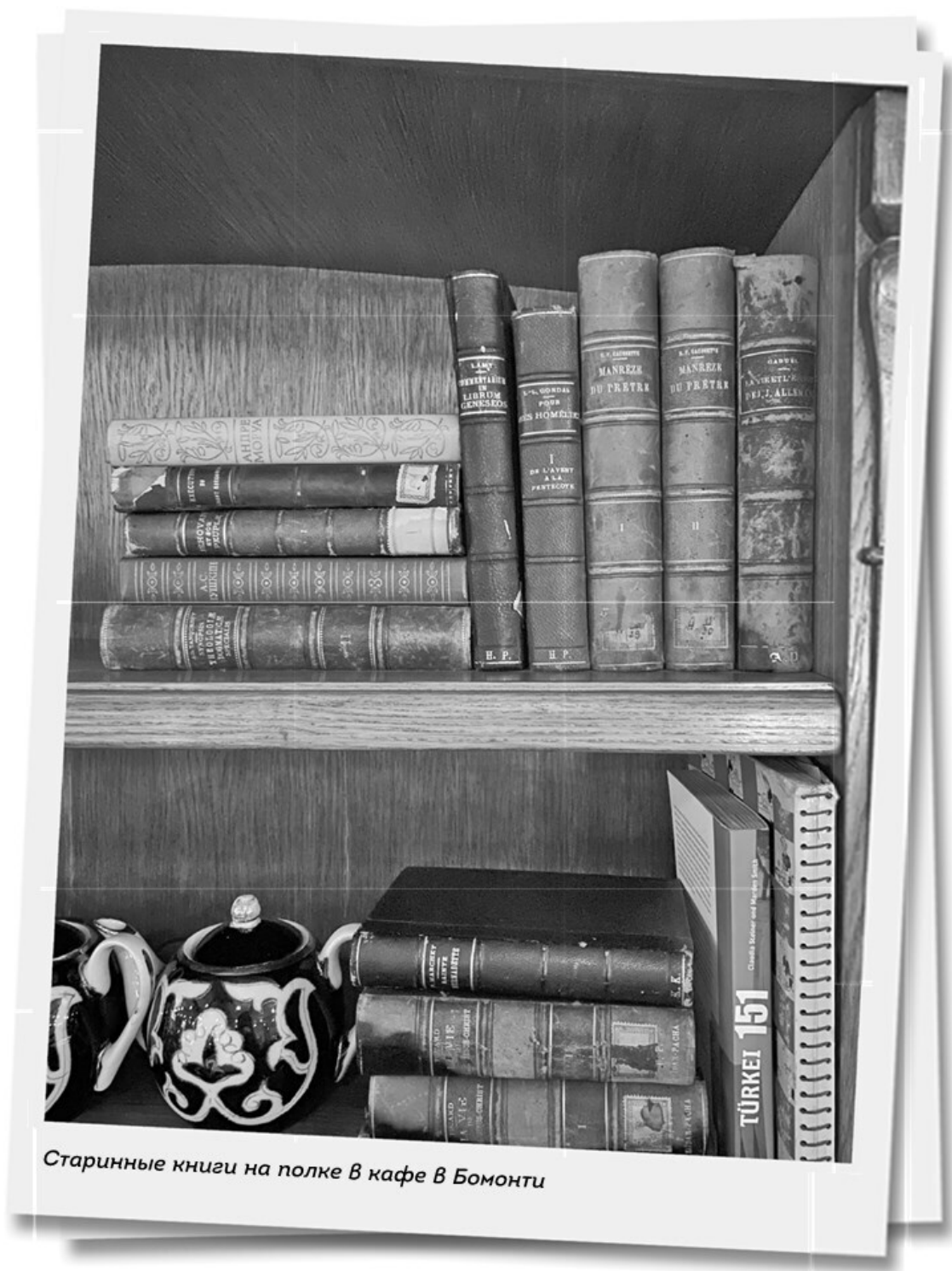
Старинные книги на полке в кафе в Бомонти