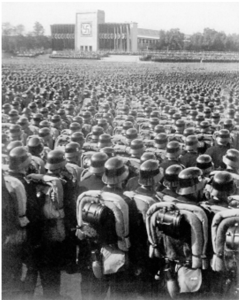
Массовая переключка войск на съезде НСДАП. Нюрнберг, 11 сентября 1935 года. Вашингтон, На-