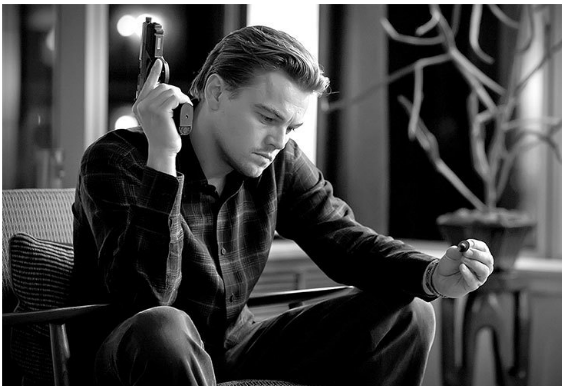
Кадр из научно-фантастического триллера режиссера Кристофера Нолана «Начало» (2010)