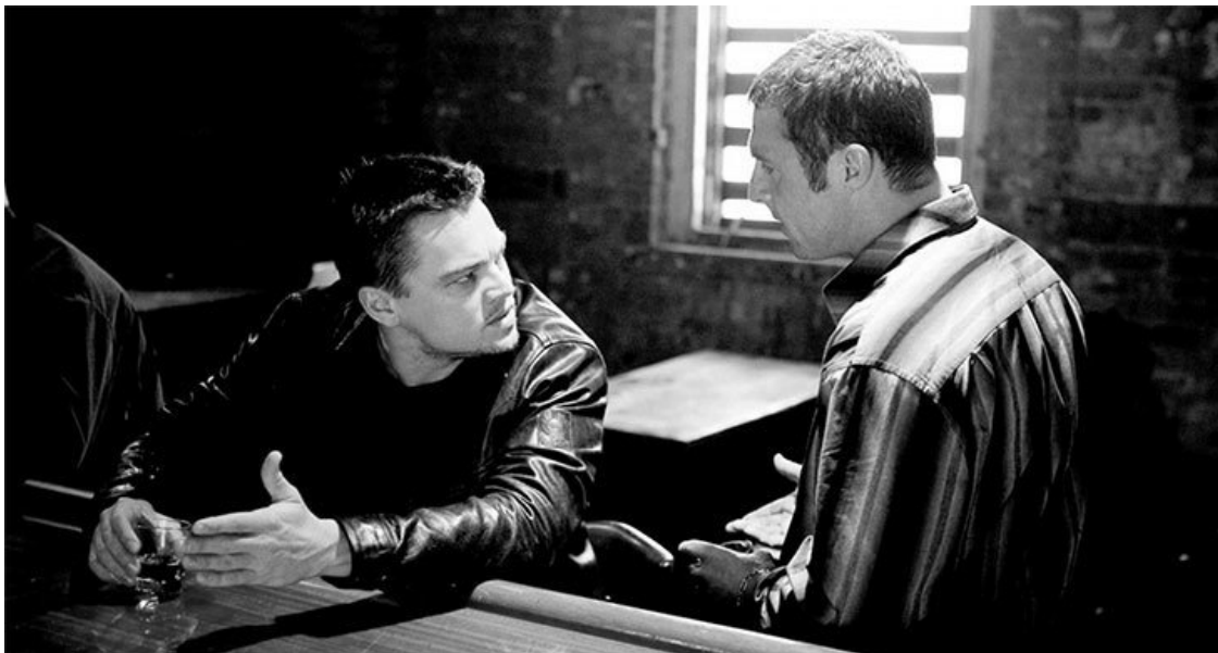
Кадр из криминально-драматического триллера режиссера Мартина Скорсезе «Отступники» (2006)

все они были похожи на хищников. Казалось, что какой-то ужасный монстр овладел ими, их лицами и душами. Очень рано жизни многих из них были уже разрушены».