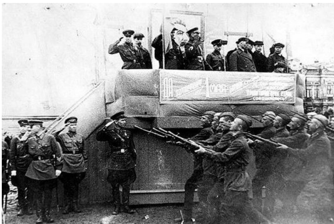
1 мая 1941 г. город Стерлитамак, маршируют бойцы 170 сд.

По итогам зимней боевой учебы в апреле 1941 года 15 военнослужащих 170-й стрелковой дивизии были награждены грамотами Президиума Верховного Совета БАССР 18 .