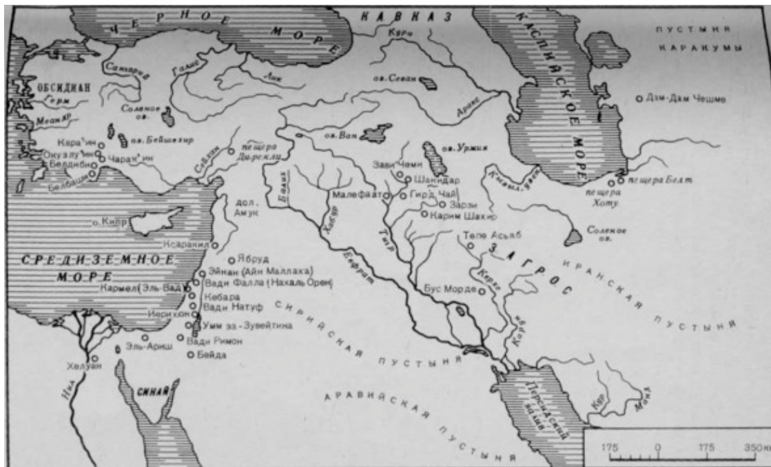
Карта Брабант-Атлант-гипериона (Хеприона), региона формирования Первоязыка Перво-и-Иноэтносов

месопотамии, вплоть до Инда, Дуная и Нила. К северу от Брабанта расселение первоэтноса шло по русской долине, по долинам рек Днепра, Дона, Волги, вплоть до Урала, о чём свидетельствуют древнейшие (56—52 000 лет до н. э.) на земле местонахождения их в археологических раскопах Костенок (шатры из бивней и костей мамонта), Сунгиря, Алтая, палеолитические изображения мамонтов в Каповой пещере Урала... и далее везде.