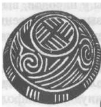
космическое яйцо с корне/субстанциональной свастикой первоязыка