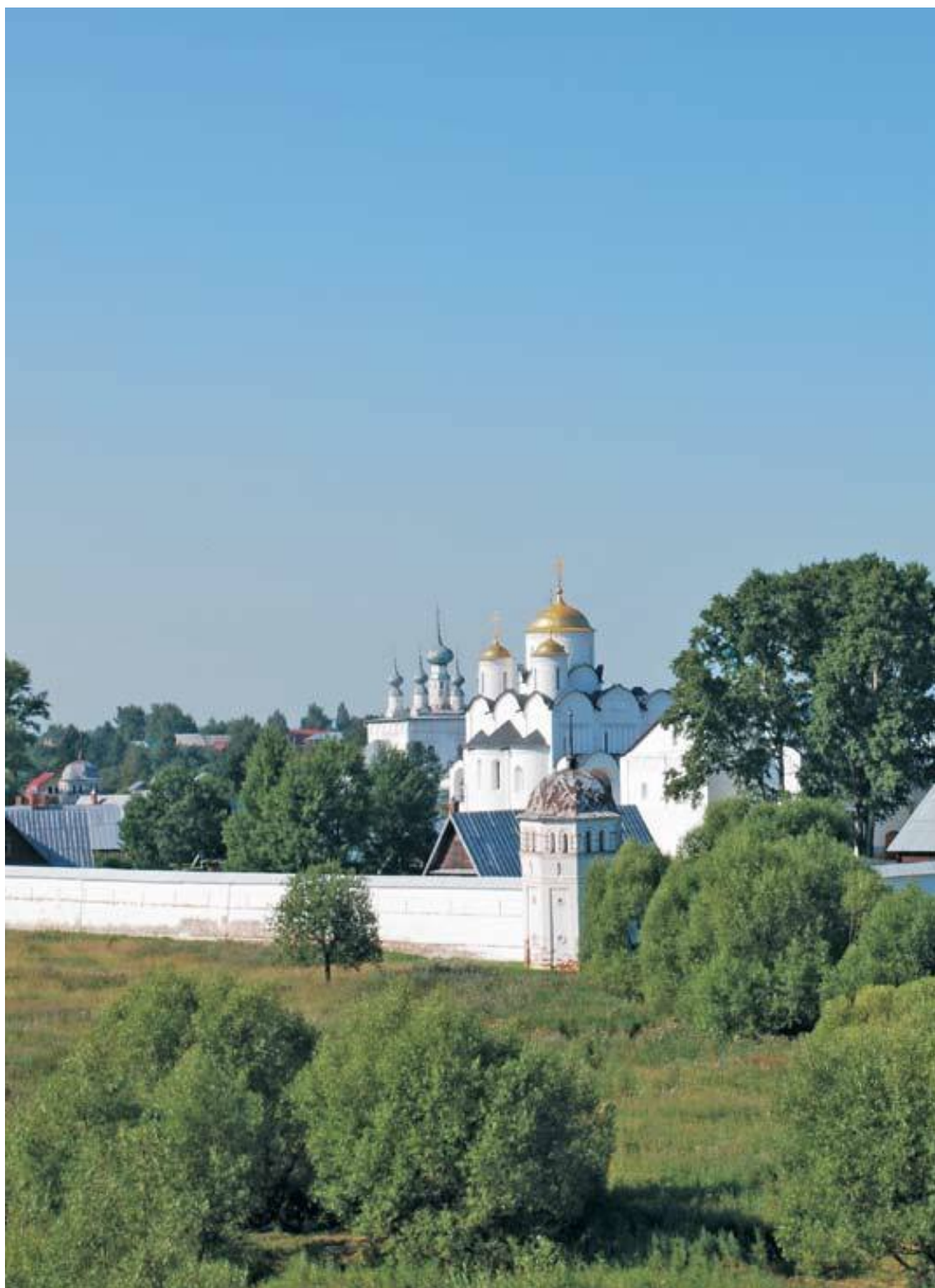
Суздальский кремль. Покровский монастырь