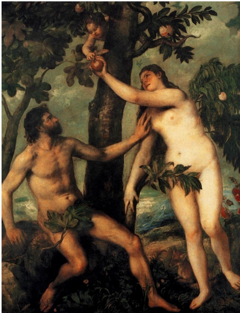
Тициан. Адам и Ева