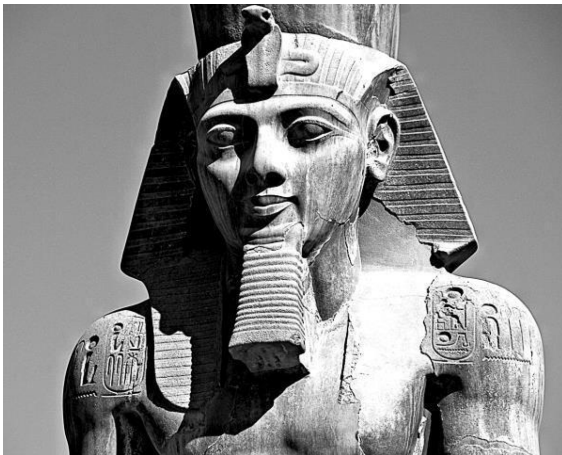
Фараон Рамзес II

Самым крупным государством Переднего Востока был Египет. Египетские границы при XVIII династии (середина второго тысячелетия до нашей эры) доходили до отрогов Тавра и реки Евфрата. В международной жизни Древнего Востока этого времени Египет играл первенствующую роль. Египтяне поддерживали оживленные торговые, культурные и политические связи со всем известным им миром – с государством хеттов в Передней Азии, с государствами севера и юга Месопотамии (государство Митанни, Вавилон, Ассирия), с сирийскими и палестинскими князьями, Критским царством и островами Эгейского моря. Дипломатической перепиской в Египте заведывала особая государственная канцелярия по иностранным делам.