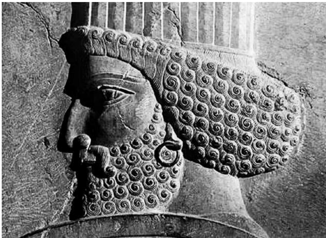
Персидский царь Дарий Великий

Наступательная политика ассирийских царей вызывала сильное беспокойство среди государств Переднего Востока и заставляла их забыть взаимные распри перед лицом общей опасности. Против Ассирии образовались три внушительные коалиции: первую – на юго-западе – возглавлял Египет, вторую – на юго-востоке – Элам и третью – на севере – Урарту. Все эти коалиции были очень пестры по своему составу, что облегчало победу ассирийцев. В конце VIII века до нашей эры Саргон при Рафии в Палестине разбил союзников египетского фараона и затем обратился против второй, эламско-халдейской, коалиции на Востоке. При этом он весьма искусно использовал недовольство халдейских городов против вавилонского царя Мардук-Белиддина. Ассирийский царь выступал якобы защитником вольностей халдейских городов, нарушенных его противником. Халдейские города получили прежние права, а победитель Саргон провозгласил себя вавилонским царем. Таким образом, Ашур и Вавилон связывались личной унией. Политическая гегемония переходила к Ассирии, но культурное преобладание оставалось за Вавилоном.