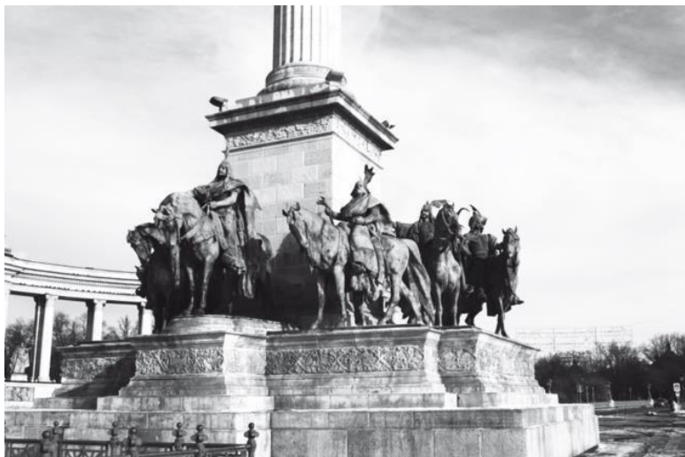
Памятник на площади Героев в Будапеште

Есть в Будапеште монументальный ансамбль – памятник Тысячелетию Венгрии. Оказавшись на этой площади, я, конечно, вспомнил берега Волхова, северный русский город – одну из первых столиц Руси. Город, который было принято называть весьма церемонно – Господин Великий Новгород. Вспомнил памятник «Тысячелетняя Россия».