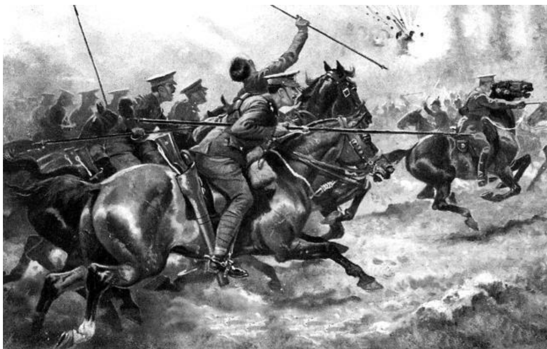
Британская конница в Первую Мировую войну

С началом мобилизации стороны начали переброску войск в районы развертывания. Германское командование развернуло против Франции 7 армий и 4 кавалерийских корпуса, до 5000 орудий, всего группировка германских войск насчитывала 1 600 000 человек. Германское командование планировало нанести сокрушительный удар по Франции через территорию Бельгии. Однако несмотря на то, что все основное внимание германского командования было приковано к вторжению в Бельгию, германцы принимали все меры для того, чтобы не дать французской армии, наступавшей в Эльзас-Лотарингии, захватить этот регион.