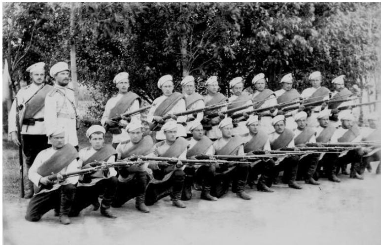
Пехотинцы русской армии

Помимо этого, мировая война стала одной из главных причин, перевернувших жизнь России революций – Февральской и Октябрьской. Старая Европа, на протяжении столетий сохранявшая ведущие позиции в политической, экономической и культурной жизни, начала утрачивать лидирующее положение, уступая его нарождающемуся новому лидеру – Соединенным Штатам Америки (или САСШ – Североамериканским Соединенным Штатам, как было принято называть эту страну в то время).